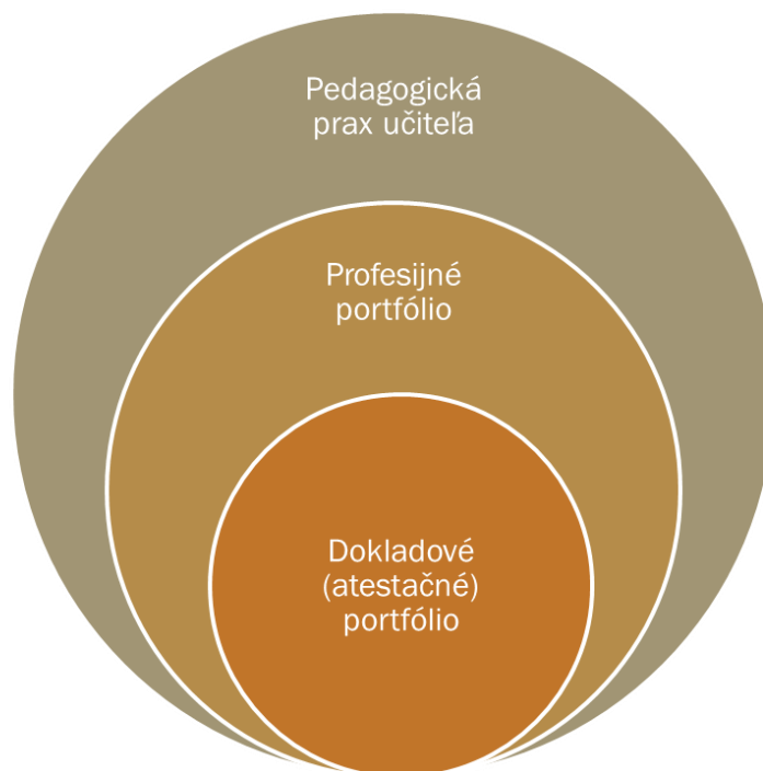
Obrázok 1: Druhy portfólií v praxi učiteľa (Pupíková, 2019)