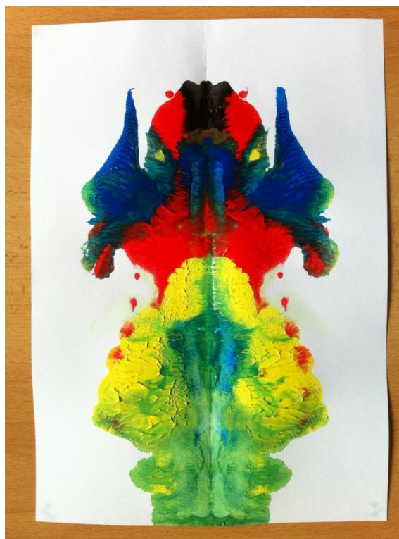
abstraktný obraz - čarodejník