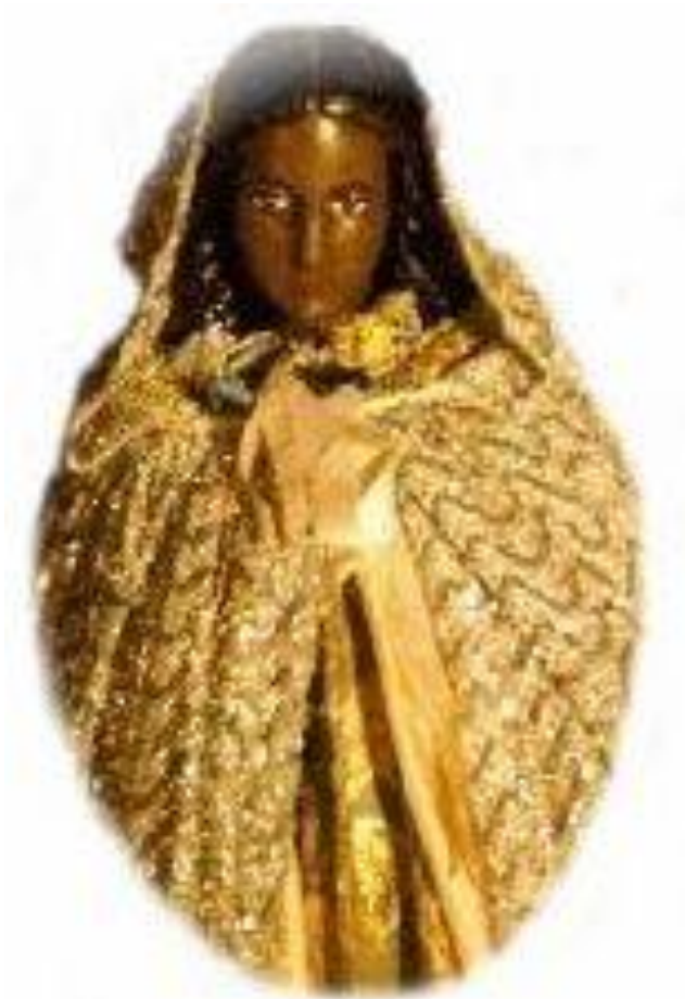
Svätá Sára, patrónka Rómov