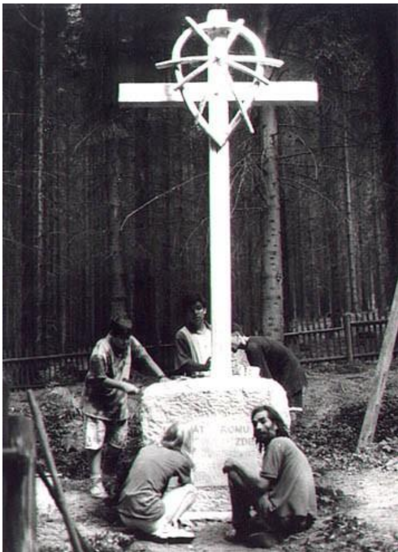
Pamätník holokaustu od E. Oláha v Hodoníne u Kunštátu

Najznámejší sú však Rómovia pôsobiaci v hudobnej produkcii. Na Slovensku žije veľa nadaných rómskych hudobníkov. S hudbou začínajú deti už od malička.