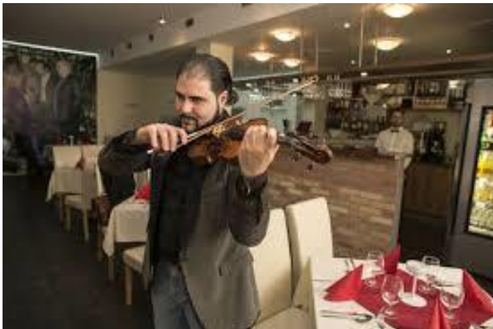
Primáš Cigánskych diablov