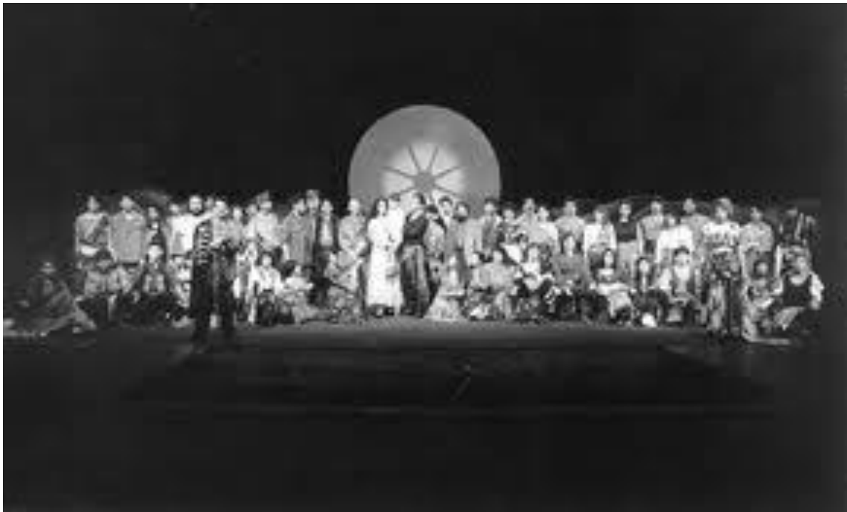
Divadelný súbor Romathan