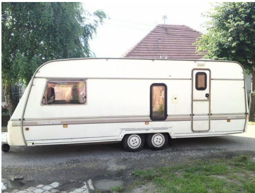
Obytný príves – karaván

Stany mali rôzne formy a veľkosti. Najrozšírenejším boli kužeľovité, alebo mali formu štítu. Na postavenie stanu potrebovali žrde a celtovinu. V Albánsku sa v 19. storočí objavil aj voz, ktorý ťahalo 10-12 volov a na ňom bola chatrč pokrytá kôrou. Bohaté kočovné rodiny prešli v 20. storočí na iný typ pohyblivého obydľia, a to na maringotky. V prednej časti bola železná piecka alebo sporák, kuchynská skriňa s riadom, stôl, stoličky. V zadnej časti sa nachádzali postele. Na stenách nesmelo chýbať zrkadlo a niekoľko lacných obrázkov. Vo Francúzsku, Španielsku a niektorých západoeurópskych krajinách dodnes mnohí Rómovia kočujú. Kupujú si obytné prívesy – karavány.