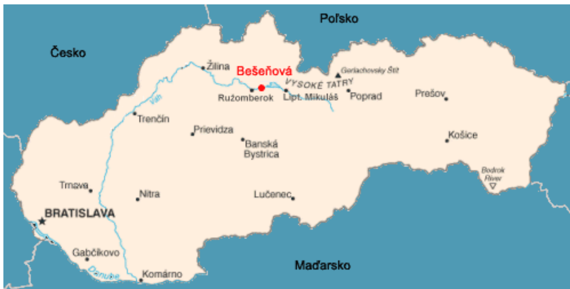
Obrázok 4 - Rieka Váh