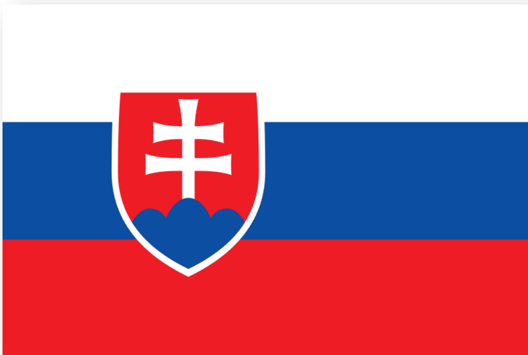
Obrázok 1 - Štátna vlajka SR

Prvý štátny útvar Slovanov na území dnešného Slovenska bola Samova ríša (7. storočie), neskôr Nitrianske kniežatstvo (začiatok 9. storočia), ktorého spojením s Moravským kniežatstvom vznikla v roku 833 Veľká Morava. Od polovice 10. do konca 11. storočia sa územie Slovenska postupne začlenilo do Uhorska, ktoré sa v roku 1526 stalo súčasťou Rakúskej monarchie (Habsburskej monarchie), od roku 1867 nazývanej Rakúsko-Uhorsko. Po rozpade Rakúsko-Uhorska v roku 1918 bolo Slovensko súčasťou Česko-Slovenska až do roku 1993 (okrem obdobia samostatnosti počas prvej Slovenskej republiky). 1. januára 1993 vznikla rozdelením tohto štátneho útvaru samostatná Slovenská republika.