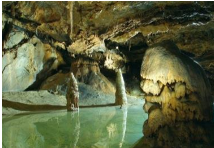
Obrázok 6 - Belianska jaskyňa

Jedinečnú prírodnú pamiatku, ktorá predstavuje súčasť najvýznamnejšieho prírodného dedičstva štátu, môže ministerstvo ustanoviť všeobecne záväzným právnym predpisom za národnú prírodnú pamiatku (skratka NPP ). (Wikipédia, 2014)