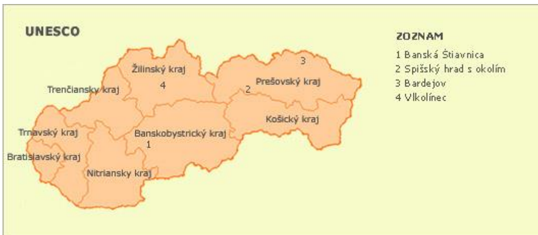
Obrázok 7 - Lokality svetového dedičstva UNESCO na Slovensku

UNESCO je skratka, ktorá v angličtine znamená: The United Nations Educational, Scientific and Cultural Organization. Ide o svetovú organizáciu, ktorá bola založená 16. novembra 1945. Jednou z činností organizácie je aj vytváranie Zoznamu svetového kultúrneho a prírodného dedičstva národov z celého sveta. Pôvodný názov Zoznamu v angličtine je UNESCO's World Heritage List, Zoznam svetového dedičstva.