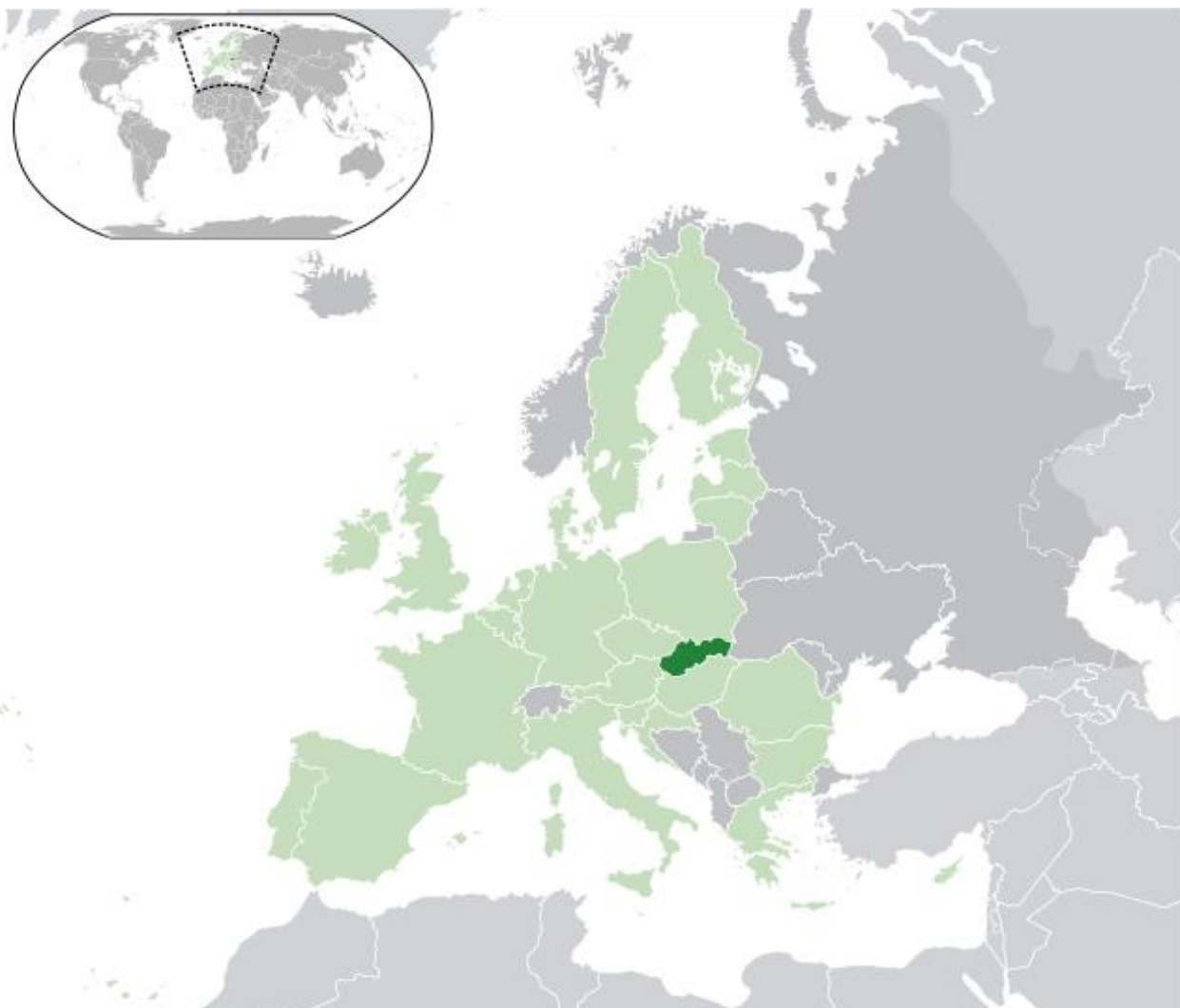
Obrázok 3 - Pozícia SR v Európe a vo svete