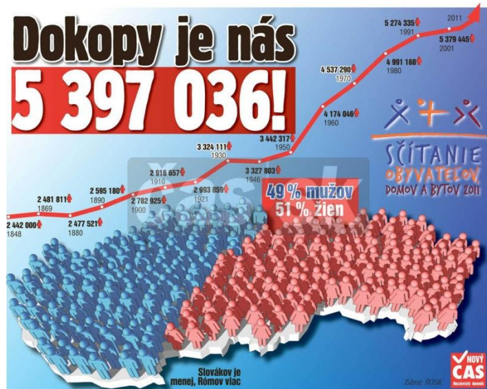
Obrázok 5 - Vývoj počtu obyvateľov Slovenska