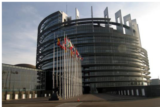
Obr. 3 Budova Európskeho parlamentu v Štrasburgu https://enacademic.com/dic.nsf/enwiki/5222978

Štrasburg vo Francúzsku, Brusel v Belgicku a Luxemburg. V Štrasburgu má Parlament sídlo, kde sa každý mesiac konajú schôdze vrátane schôdze o rozpočte. V Bruseli sa konajú dodatočné schôdze a parlamentné výbory sa schádzajú v Bruseli. V Luxemburgu je sekretariát a podporné oddelenia.