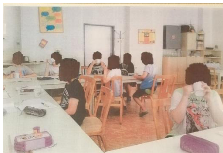
Obr. 9: Záverečné hodnotenie spojené s pitím čaju z liečivých rastlín

Každá skupina dostala hodnotiaci hárok, spoločne hodnotili aktivitu žiakov emotikonom ( smajlíkom ). V prípade, že sa smajlík neusmieval, skupina uviedla dôvody, ktoré ich k tomu viedli. Uviedli ich do poznámky. Hodnotenie bolo realizované v príjemnej atmosfére, pri pití čaju z liečivých rastlín.