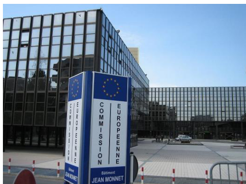
Obr. 4 Budova Európskej komisie v Luxemburgu