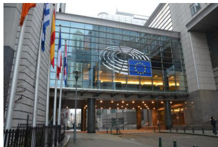
Obr. 2 Budova Európskeho parlamentu v Bruseli

Cieľ aktivity: Analyzovať organizáciu a činnosť Európskeho parlamentu.