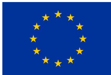
Obr. 1 Zástava EÚ 1024px-Flag_of_Europe.jpg

EÚ – cesta k jazykom, k porozumeniu kultúr a k tolerancii