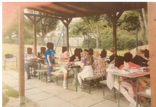
Obr. 8: Kooperácia žiakov

Klobúčik žltý má, lúku krásne pokrýva. (púpava)