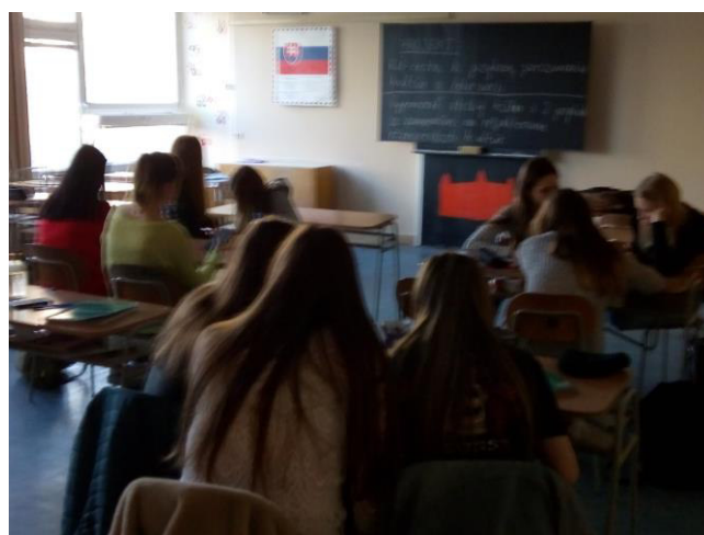
Obr. 5, 6 a 7: Kooperácia žiakov