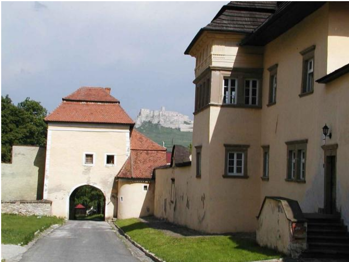
Dolná brána Spišskej kapitule