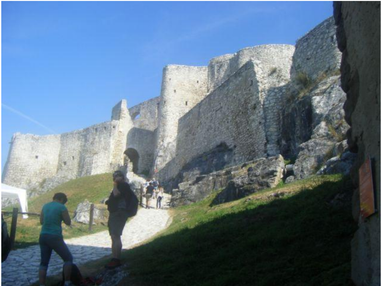
Vstup na hrad