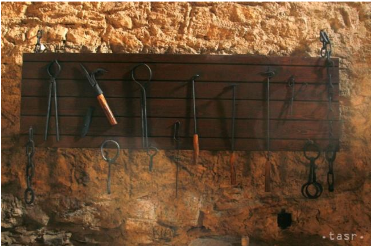
Hradná mučiareň Spišský hrad