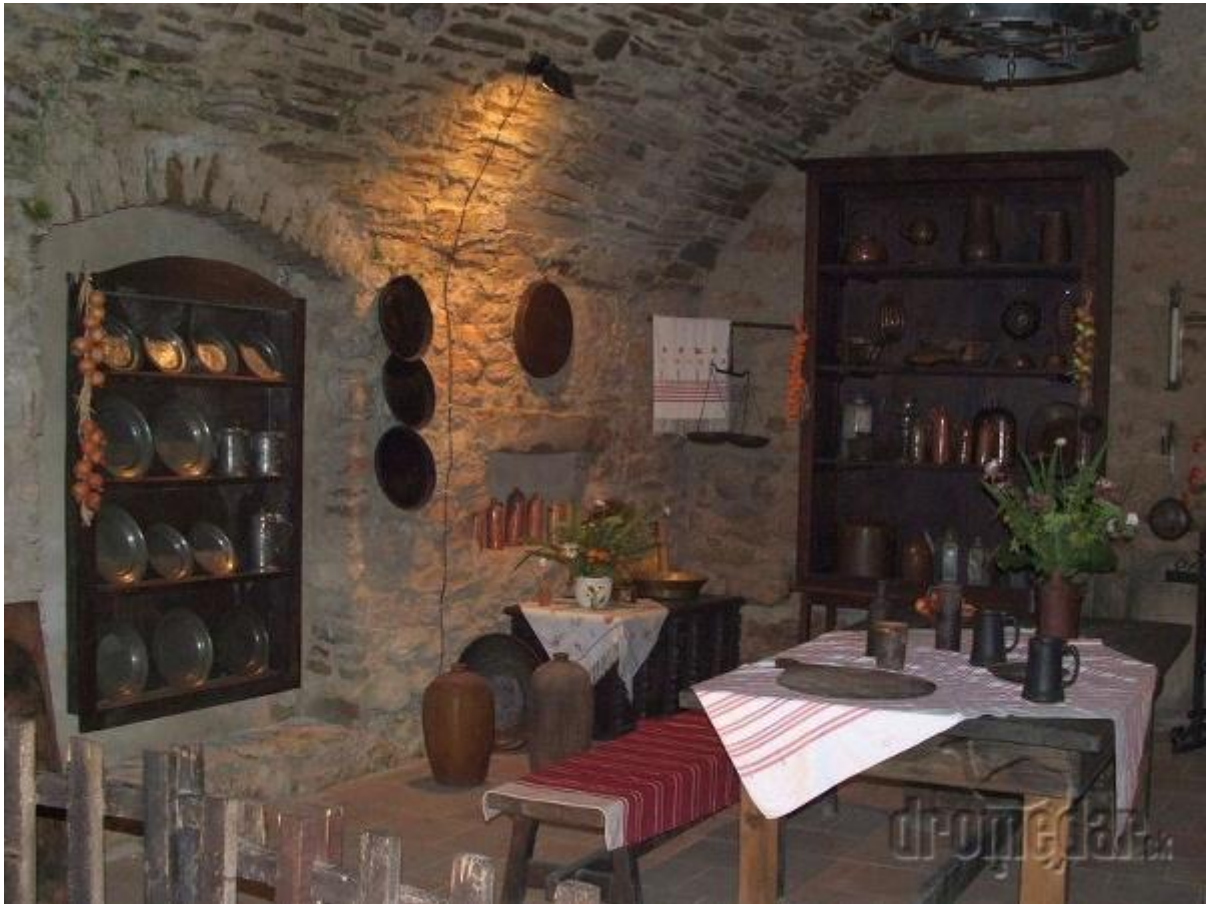
Hradná kuchyňa Spišského hradu