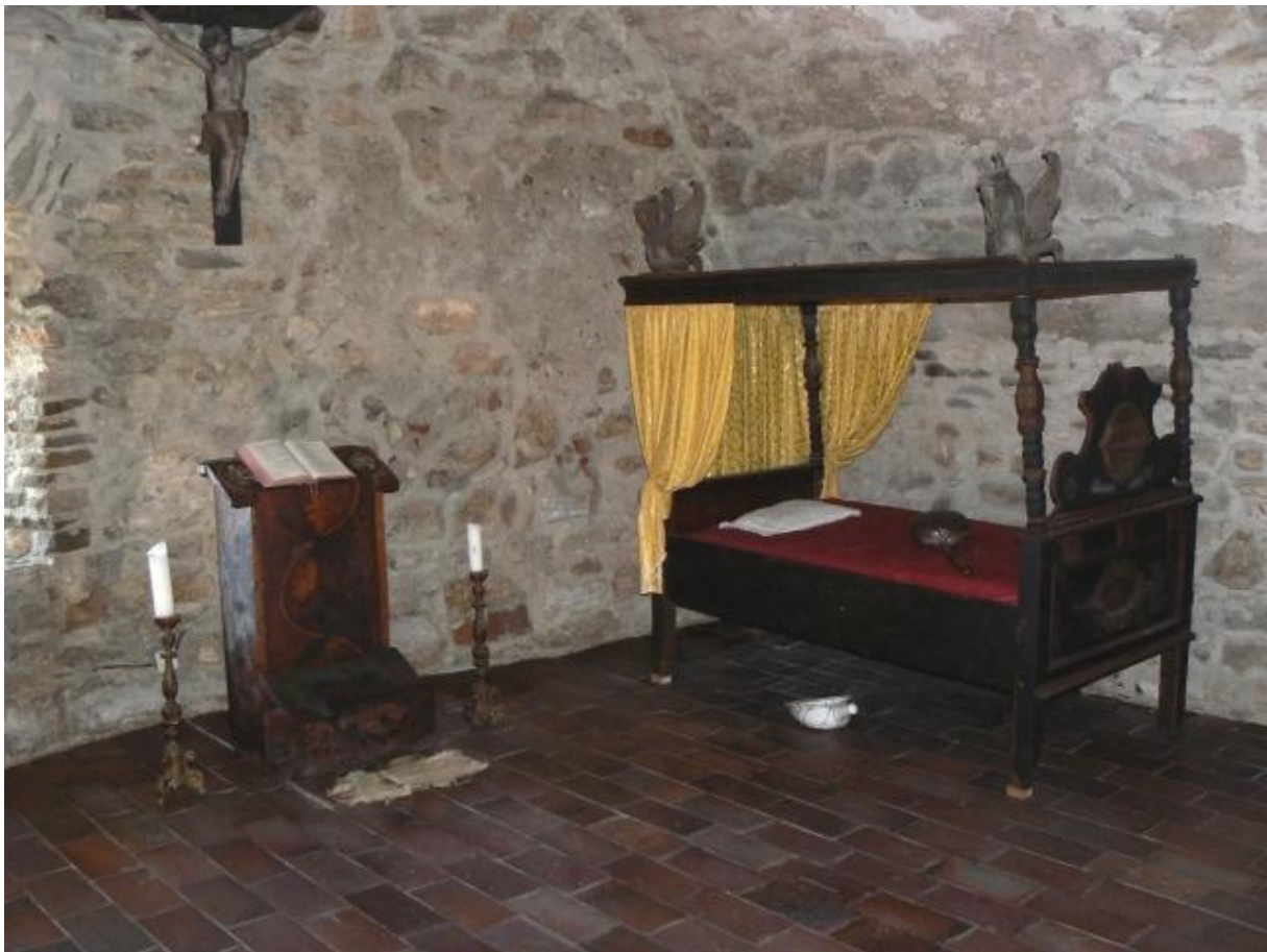
Hradná spálňa Spišského hradu