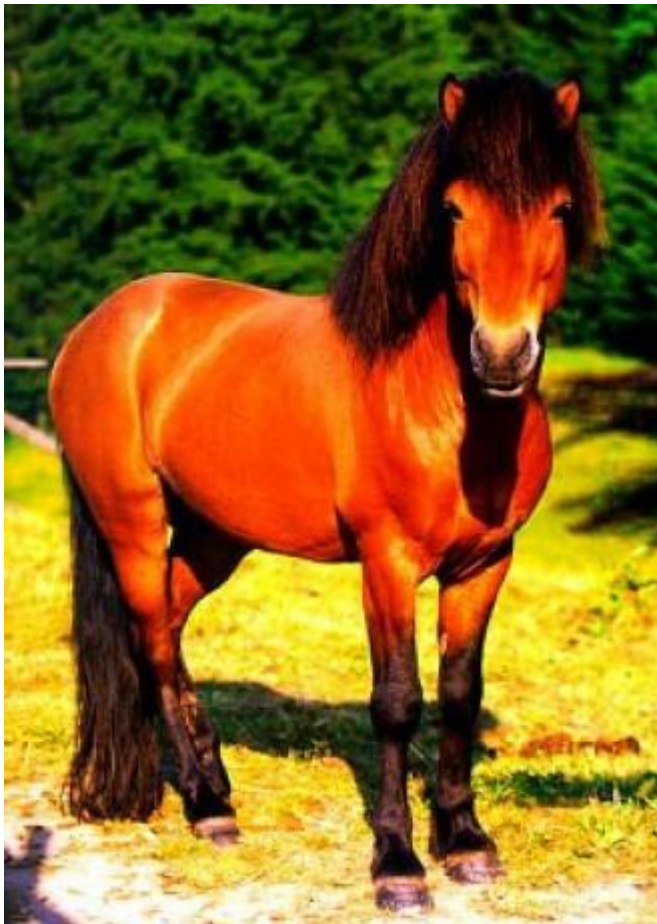
HUCUL- prvý obyvateľ košickej ZOO