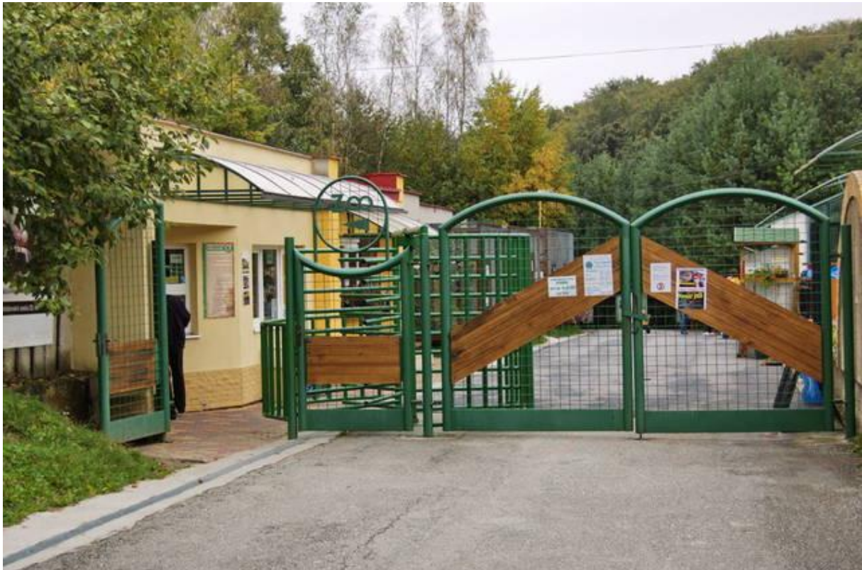
Vchod do Zoo