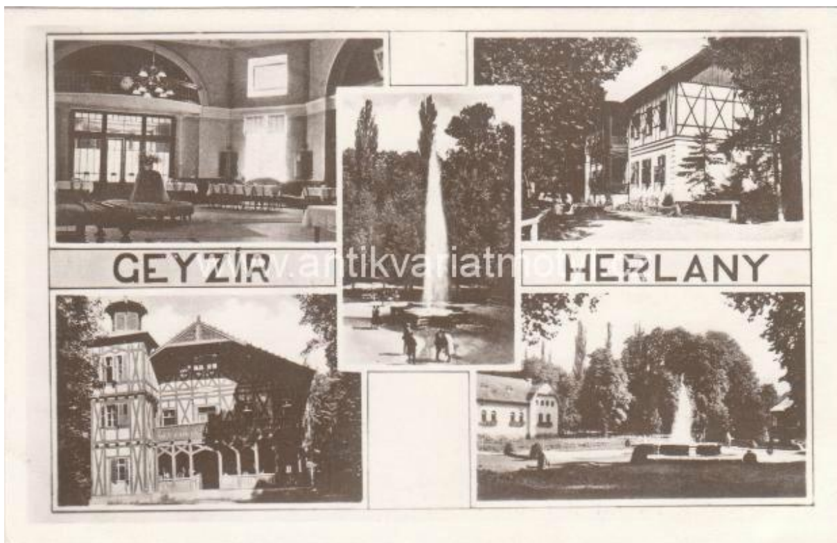
Pohľadnica Herľan z roku 1940