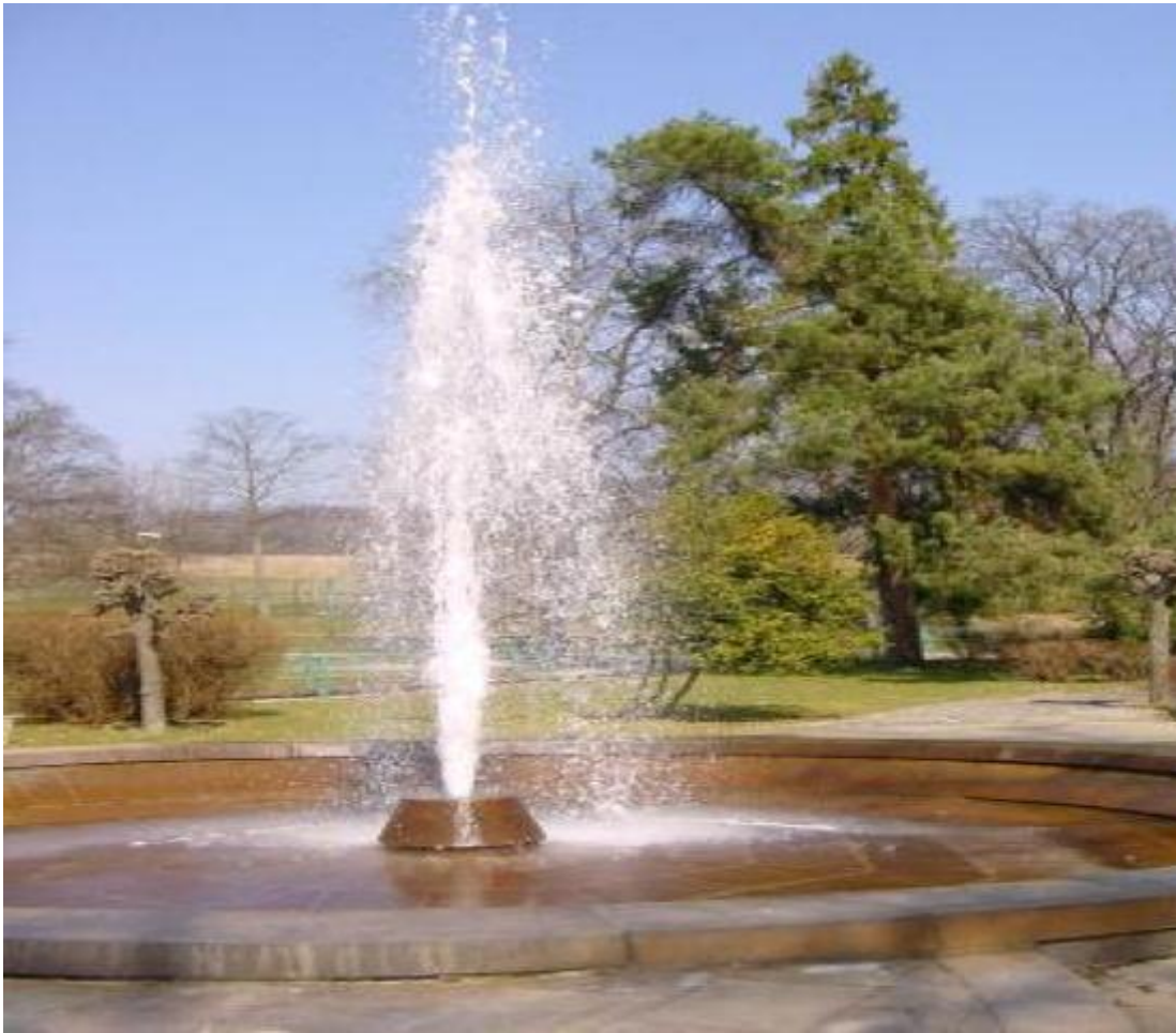
Gejzír v Herľanoch