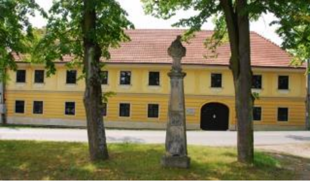
1. slovenské katolícke patronátne gymnázium