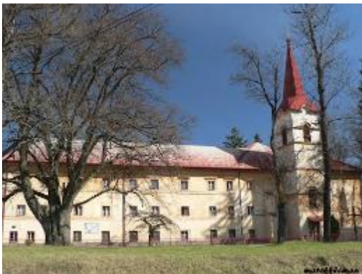
Kláštor a kostol Panny Márie