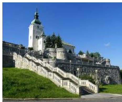
Kostol sv. Ondreja v Ružomberku