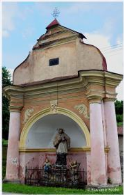
Baroková kaplnka v Smolníku