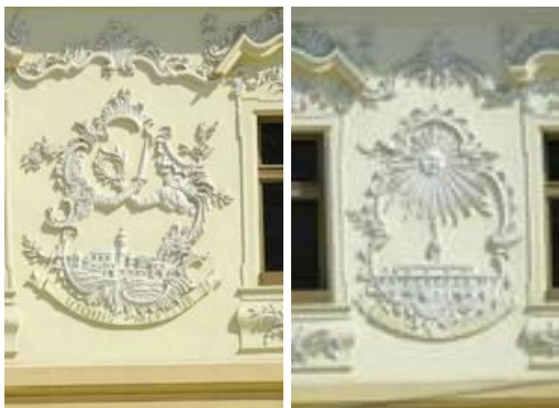
Detaily štukovej výzdoby na Provinčnom dome

K technickým pamiatkam patrí Úhornianske jazero a vodné kanály.