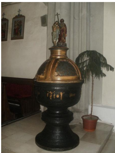
Krstiteľnica v gelnickom kostole

Zaznamenávame i zmenu v stavbe kostolov. Do popredia sa dostávajú trojlod'ové chrámy. Vidiecke kostoly hýria farebnosťou. Stredoveký človek nemal rád prirodzenú farbu použitého materiálu. Pestro pomaľoval strop, plochy stien i klenieb. Pretože výzdoba interiérov (vnútorné zariadenie) bola finančne náročná, robili ju po etapách. To znamená, že kostoly sa zariaďovali postupne. K pozoruhodnostiam gotiky na Spiši patrí neobyčajne dlhé a široké sanktuárium (svätostánok) v kostole v Gelnici, ktoré patrí k najväčším. Najvýznamnejšie gotické maľby nachádzame v Žehre a v Dravciach, na ktorých badať byzantský vplyv.