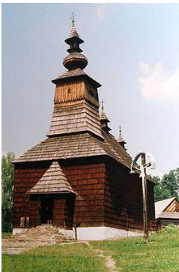
Drevený kostol v Starej Ľubovni

V roku 1675 bola na travertínovom vršku Sivá brada postavená baroková kaplnka sv. Kríža.