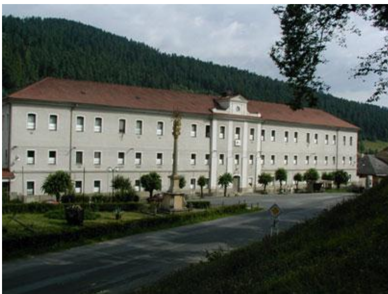
Továreň na výrobu cigariet

Neskôr v meste vybudovali továreň na výrobu železného nábytku , matracov a iných predmetov. Ťažba sa nezastavila ani po vypuknutí I. svetovej vojny a jej skončení, ale