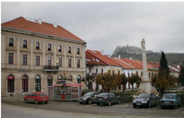
Spišské Podhradie s morovým stĺpom a Spišským hradom v pozadí