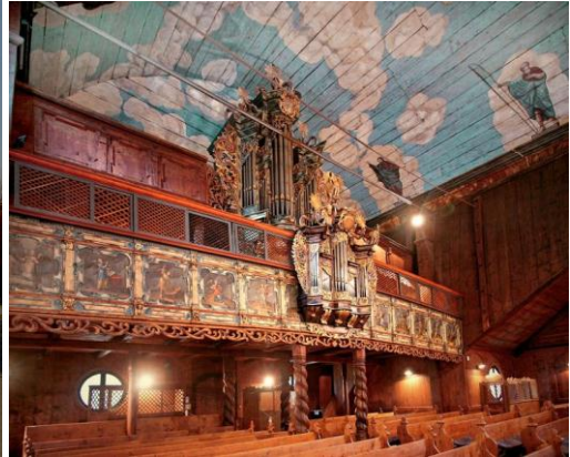
Drevený kostolík a interiér kostola v Kežmarku