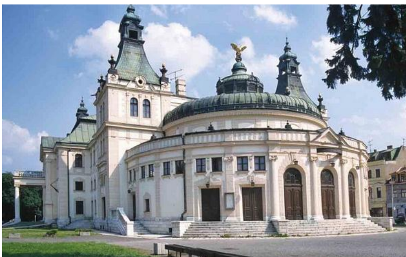
Reduta v Spišskej Novej Vsi

Najviac pamiatok tohto umeleckého smeru je v Hnileckej doline. 19.storočie je aj storočím stavanie divadiel. V roku 1805 postavili v Smolníku divadlo s otáčavým javiskom. Divadlo si postavila Levoča i Spišská Nová Ves ( začiatok 20.storočia).