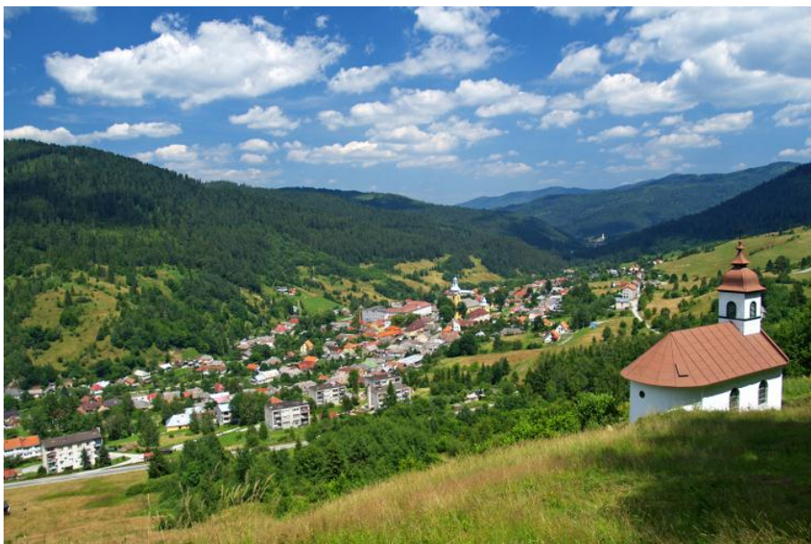
Pohľad na mesto

postupne klesá výroba pre značné vyčerpanie rudnej zásoby kvalitného pyritu, ale i pre nízku cenu v Československu. V Smolníku ešte stále žila mnohopočetná skupina obyvateľov nemeckej národnosti, čo situáciu využili fašistické a fašizujúce sily pred rozbitím republiky. Smolník bol oslobodený sovietskou armádou 23.1.1945. Banský závod bol roku 1946 znárodnený. Od 50.rokov prešiel závod mnohými zmenami. Zlepšilo sa sociálne postavenie obyvateľov, ale i napriek tomu počet obyvateľov v meste klesá. Migrácia obyvateľov do miest je súčasný všeobecný jav v celej Európe.