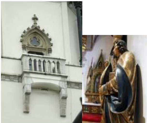
Interiér kostola Spišská Nová Ves

Ďalšími gotickými pamiatkami sú mýtna stanica v Spišskom Podhradí, radnica v Spišských Vlachoch, meštianske domy a hradby v Levoči. Spomedzi architektonických detailov (menšia časť celku) sú najcennejšie portály zo 14.-15.storočia, napr. gotický portál kostola v Spišskej Novej Vsi s bohatým reliéfom na tympanóne a zachovala sa i pôvodná polychrómia na klenbe.