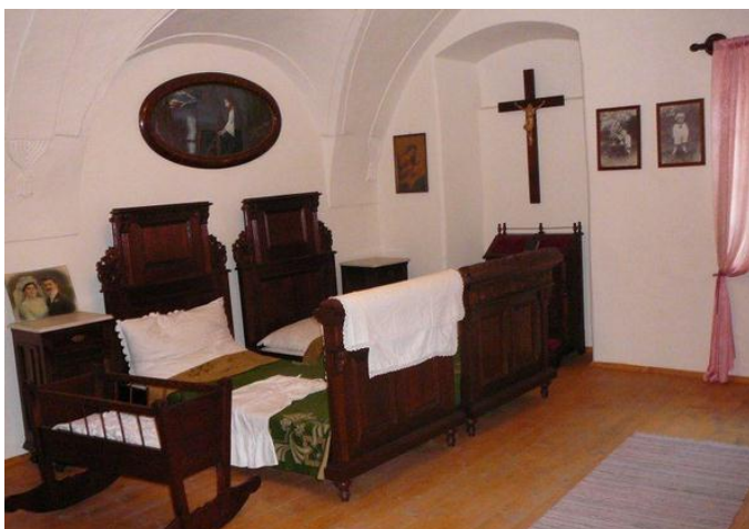
Interiér domu mešťana

Roku 1412 sa stalo mesto centrom 16 zálohovaných spišských miest. Keď sa hrad Ľubovňa stal sídlom starostu zálohovaného územia, v meste sa odohrálo mnoho poľsko-uhorských diplomatických rokovaní o vrátení zálohy. Obyvatelia sa venovali obchodu, remeslám, alebo splavovaniu dreva po rieke Poprad do Gdaňska. Možnosť poskytovania služieb obyvateľom a hosťom hradu povzniesla úroveň miestnych cechov a podporila vznik mincovne. Koncom 18.storočia mesto upadlo, zanikli niektoré remeslá. Tiež bola pričlenená do Provincie XVI. spišských miest. Tento návrat do Uhorska veľmi neprospeš, nakoľko stratilo svoje výsadné postavenie. Z mesta odišli úradníci i šľachta. Historické jadro mesta tvorí námestie obdĺžnikového tvaru s meštianskymi domami s renesančnou dispozíciou a neskoršími barokovými a klasicistickými úpravami. Dominantou námestia je Kostol svätého Mikuláša pochádzajúci z obdobia okolo roku 1280 a Provinčný dom - bývalé sídlo gubernátora zálohovaných miest, v 16.storočí prestavané v renesančnom slohu.