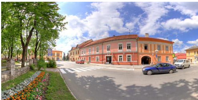
Námestie v Starej Ľubovni

Roku 1412 sa stalo mesto centrom 16 zálohovaných spišských miest. Keď sa hrad Ľubovňa stal sídlom starostu zálohovaného územia, v meste sa odohrálo mnoho poľsko-uhorských diplomatických rokovaní o vrátení zálohy. Obyvatelia sa venovali obchodu, remeslám, alebo splavovaniu dreva po rieke Poprad do Gdaňska. Možnosť poskytovania služieb obyvateľom a hosťom hradu povzniesla úroveň miestnych cechov a podporila vznik mincovne. Koncom 18.storočia mesto upadlo, zanikli niektoré remeslá. Tiež bola pričlenená do Provincie XVI. spišských miest. Tento návrat do Uhorska veľmi neprospeš, nakoľko stratilo svoje výsadné postavenie. Z mesta odišli úradníci i šľachta. Historické jadro mesta tvorí námestie obdĺžnikového tvaru s meštianskymi domami s renesančnou dispozíciou a neskoršími barokovými a klasicistickými úpravami. Dominantou námestia je Kostol svätého Mikuláša pochádzajúci z obdobia okolo roku 1280 a Provinčný dom - bývalé sídlo gubernátora zálohovaných miest, v 16.storočí prestavané v renesančnom slohu.