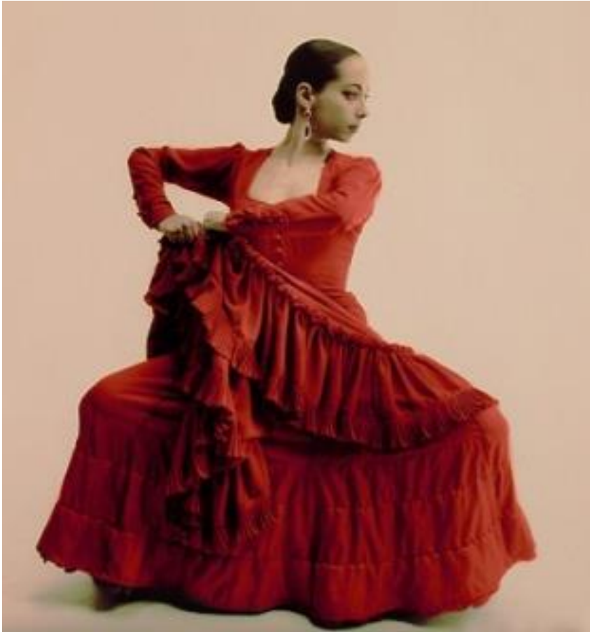
Španielsky tanec flamenco

rodinné rozpočty. Tanec sa stal tak obľúbeným, že sa tancovalo na námestiach, uliciach, dvoroch a na každom vhodnejšom mieste. Ich obľúbenosť v najširších vrstvách nezmenšili ani protesty kazateľov. Predvádzanie tanca, spevu a hudby bolo jedným z najbežnejších povolání španielskych Rómov.