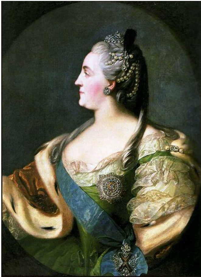
Cárovná Katarína II.

Neskôr bolo vydaných množstvo nariadení, ktorými chceli zmeniť kočovný život Rómov. Iba časť Rómov, ktorí sa venovali remeslám alebo roľníčeniu sa usadila a zmenila svoj spôsob života. Mnohí šľachtici si hudobníkov, tanečníkov, spevákov dovedli do svojich domov. Ostatní zostali kočovníkmi až do vzniku Sovietskeho zväzu, kedy sa opätovne začala riešiť otázka asimilácie Rómov do spoločnosti. Riešiť tento problém sa snažili cez zvyšovanie vzdelávania Rómov a postupného zapájania do výrobného procesu v závodoch a kolchozoch.