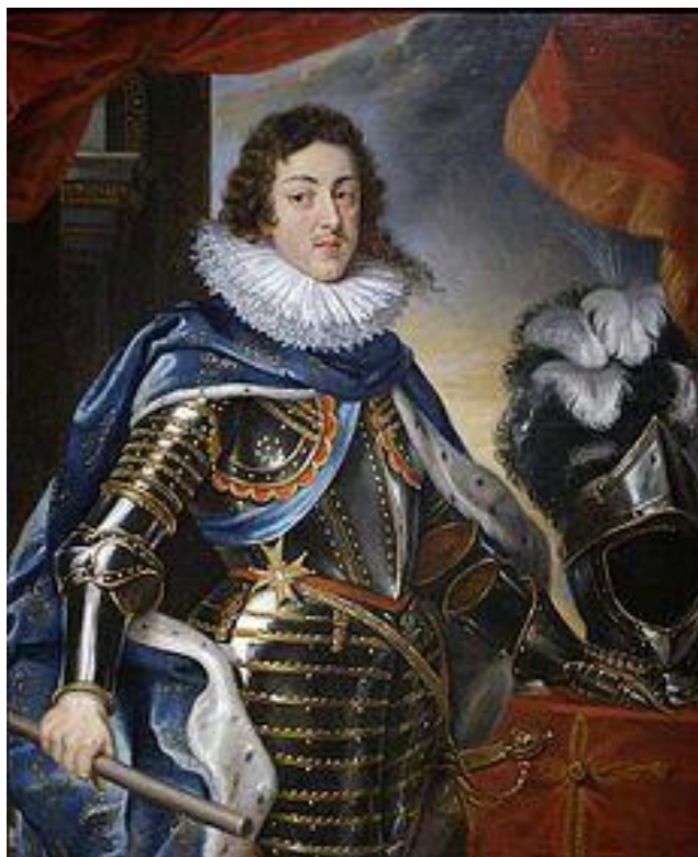
Francúzski králi : Ľudovít XIII.