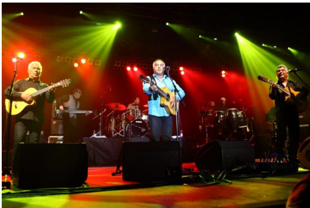
Španielska skupina Gypsy king