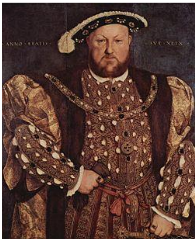
Henrich VIII. anglický král