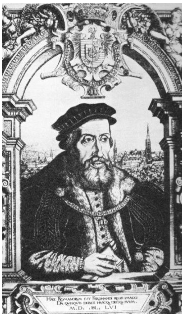
Španielsky kráľ Ferdinand I.

Rómovia mysliac si, že ide iba o dočasné opatrenie sa stiahli do odľahlejších oblastí. V Španielsku mala na prenasledovaní Rómov značný podiel cirkev. Inkvizícia, ktorá tu mala pevnejšiu pôdu ako kdekoľvek inde, mala rozhodujúce postavenie vo všetkých otázkach a jej vplyv bol jednoznačne negatívny. Vďaka kočovnému spôsobu života ľahšie unikali pred prenasledovaním, no i tak ich veľké množstvo zahynulo vo väzniciach, alebo ich upálili ako čarodejníkov. Ani urputné a dlhotrvajúce prenasledovanie Rómov zo Španielska nevyhnalo. V čase vrcholiacej diskriminácie bola podobná situácia v celej západnej Európe, a tak sa Rómovia ukrývali v horách a v iných ťažko dostupných miestach, na ktoré bola príroda Pyrenejského polostrova najmä v tom čase veľmi bohatá. V porovnaní s ostatnými západoeurópskymi krajinami našli Rómovia v Španielsku najlepšie existenčné podmienky. Obrovský úspech malo najmä predvádzanie tancov, ktoré svojim temperamentom strhli ľudové vrstvy obyvateľstva. Podľa správ z rokov 1598 a 1630 boli muži tancami rómskych dievčat tak nadšení, že výška peňažných súm, ktorými ich odmeňovali, vážne narúšala ich