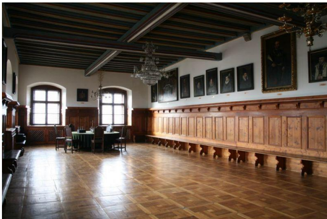
Zasadacia sieň levočských konšelov

a východnej Európy s Baltickým morom. Najstarším písomným dokladom, v ktorom sa prvýkrát vyskytuje pomenovanie Levoče „Leucha,“ je listina Belu IV. z roku 1249. Čítame v nej, že hranica zeme zvanej Jablonov zostupuje k ceste, ktorá vedie do Levoče. Poznáme i ďalšie pomenovania Levoče napr. Lyucha, Lewcha, Leuche, Lyuche a pod. V roku 1271 sa Levoča stala hlavným mestom Spoločenstva spišských Sasov a sídlom grófa. V roku 1317 sa už spomína výslovne ako slobodné kráľovské mesto s vlastnou samosprávou, súdnou právomocou, osobnou slobodou, právom ťažiť rudu, využívať lesy, vykonávať remeslo, obchodovať a využívať právo skladu. Hospodársky rozkvet Levoče sa začína v 14.storočí. Najznámnejším právom, ktoré mesto malo, bolo právo skladu. Na základe tohto práva obchodníci museli v meste zostať 15 dní a ponúknuť svoj tovar na predaj. Táto výsada výdatne pomáhala plniť mestskú pokladnicu i mešce samotných mešťanov. Nečudo, že takéto významné hospodárske privilegium bolo trňom v oku mešťanov okolitých miest na Spiši. Aj oni sa snažili získať túto výsadu.