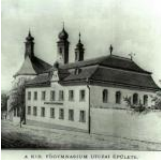
Historická budova lýcea