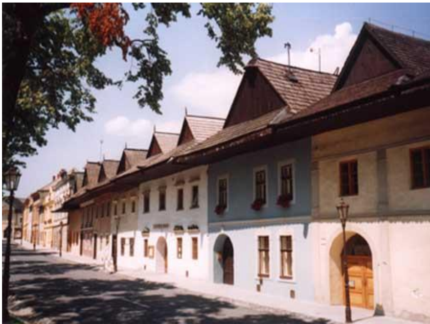
Meštianske domy v Spišskej Sobote

národnozdjednocovací proces na Slovensku. Roku 1889 bola vybudovaná trať Poprad – Tatry – Kežmarok. Zvýšený záujem o tatranskú turistiku podnietil i stavbu lokálnych tratí ( napr. zubačka zo Štrby na Štrbské Pleso). Okrem železničnej dopravy vzrastá aj význam cestnej dopravy. V druhej polovici 19.storočia zaznamenávame mohutný rozvoj turistického ruchu. V podtatranských mestečkách vznikajú prvé turistické ubytovacie kolónie ( Poprad, Spišská Sobota, Veľká ). Viacerí obyvatelia Popradu a blízkeho okolia našli zdroj obživy pri doprave turistov do výletných centier Vysokých Tatier na fiakroch. K rozvoju turizmu a rekreačných aktivít prispievala i novovybudovaná rekreačná a liečebná osada Kvetnica. Postupom času Poprad získal v pôvodnom päťmestí popredné miesto. Ostatné mestá strácali na svojom význame. Postupne v nich upadalo remeslo. Prispela k tomu i vybudovaná železnica, ktorá viedla cez Poprad a spájala ho s okolitým svetom. Zároveň umožnila masovému prúdeniu českých a sliezskych výrobkov, ktoré boli oveľa lacnejšie ako výrobky domácich remeselníkov. Stratu dôležitosti najhoršie niesla Spišská Sobota, ktorá bola z pôvodného päťmestia najrozvinutejšia.