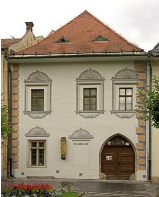
Dom Majstra Pavla

strednej a zadnej. Majú arkádové nádvoría- vplyv talianskej kultúry. Priaznivý vývoj mesta umožnil na prelome 15.a 16.storočia vznik umeleckých skvostov, akým je dielo Majstra Pavla v Chráme sv. Jakuba.