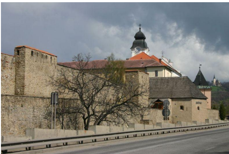
Časť mestského opevnenia

Levoču obkolesovalo dodnes zachované mestské opevnenie, ktoré sa niekoľkokrát prestavovalo. Zachovali sa tri brány: Poľská, Košická, Menhardská.