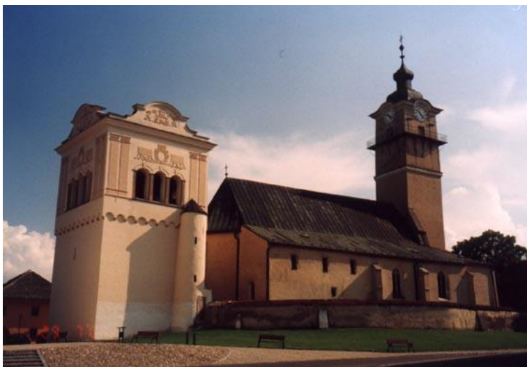
Kostol a zvonica v Spišskej Sobote.