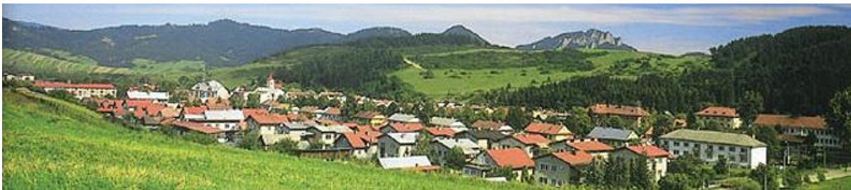
Pohľad na Spišskú Starú Ves

Najprv tu sídlilo cisárske vojsko a neskôr tadiaľ prechádzal aj sa na jeden deň zastavil jeden prúd ruskej armády, ktorá pomohla cisárovi poraziť maďarských povstalcov. Po roku 1850 sa Spišská stolica rozdelila na okresy a jedným z nich bol aj Magurský okres so sídlom v Spišskej Starej Vsi. V 19.storočí dožíval ešte obchod s vínom, ktoré starovešťania vyvážali do Poľska, Ruska a Saska. Po I. svetovej vojne si na toto územie robili nároky Poliaci. Definitívne bolo Zamagurie so Spišskou Starou Vsou začlenené do Československa 14.januára 1919. Poľsko sa svojich nárokov nevzdávalo, a tak nepokoje trvali až do roku 1920, kedy sa obe vlády dohodli na pridelení 13 obcí Poľsku.