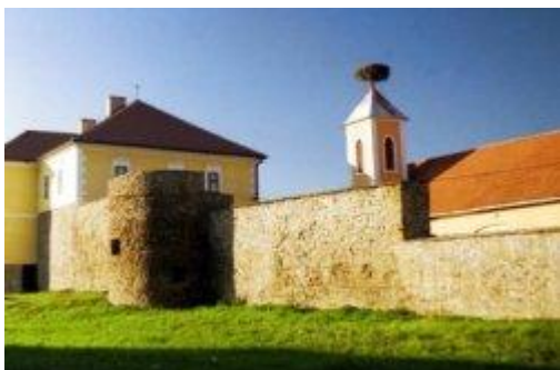
Hradné múry a bašta v Podolíneček