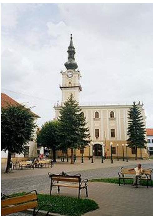
Kežmarok –námestie s radnicou

Vyššie sedem storočí existencie Kežmarku poznačilo i jeho architektúru, ktorá počnúc románskym slohom obsahuje každý stavebný štýl. Tak ako Levoča i Kežmarok si vybudoval v 15.storočí mestské opevnenie, ktoré ho malo chrániť pred nepriateľom. V centre mesta sa nachádza radnica. Okolo nej sa nachádzajú meštianske domy.