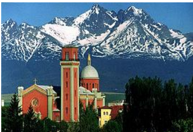
Kežmarok, v pozadí Vysoké Tatry

Vyššie sedem storočí existencie Kežmarku poznačilo i jeho architektúru, ktorá počnúc románskym slohom obsahuje každý stavebný štýl. Tak ako Levoča i Kežmarok si vybudoval v 15.storočí mestské opevnenie, ktoré ho malo chrániť pred nepriateľom. V centre mesta sa nachádza radnica. Okolo nej sa nachádzajú meštianske domy.