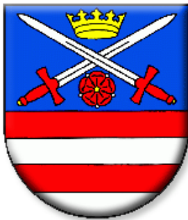
Erb Kežmaroku, ktorý symbolizuje pohraničné obranné postavenie.

Mesto bolo osídlené už v neolite, eneolite, dobe bronzovej ako i v neskorších dobách, o čom svedčia bohaté archeologické nálezy. V polovičke 13.storočia boli na mieste dnešného Kežmaroku tri osady. Najstaršou osadou bola slovenská osada rybárov, kde sa konali trhy. Na Michalovskom vršku bola osada kráľovských pohraničných strážcov, ktorá však posunutím hraníc do dnešnej podoby stratila svoj pôvodný význam. Po tatárskom vpáde sa v susedstve rybárov začali usadzovať nemeckí kolonisti. Prvá písomná zmienka o Kežmaroku pochádza z roku 1251 v darovacej listine kráľa Bela IV, kde sa spomína Kežmarok ako Villa Sancta Elisabeth. Mesto získalo mestské výsady v roku 1269 a s nimi tiež meno Käsmarkt, neskôr Käsmerk/Kesmerk. Slovenské a maďarské označenie mesta pochádza z nemeckej formy. Názov dostalo možno podľa najviac predávaného tovaru na trhu - syra ( Käse- syr, Markt-trh). Dodnes existuje 150 variantov jeho pomenovania. Medzi najvýznamnejšie výsady patria: právo slobodného trhu, právo voliť richtára a samosprávu, právo meča, mali osobnú