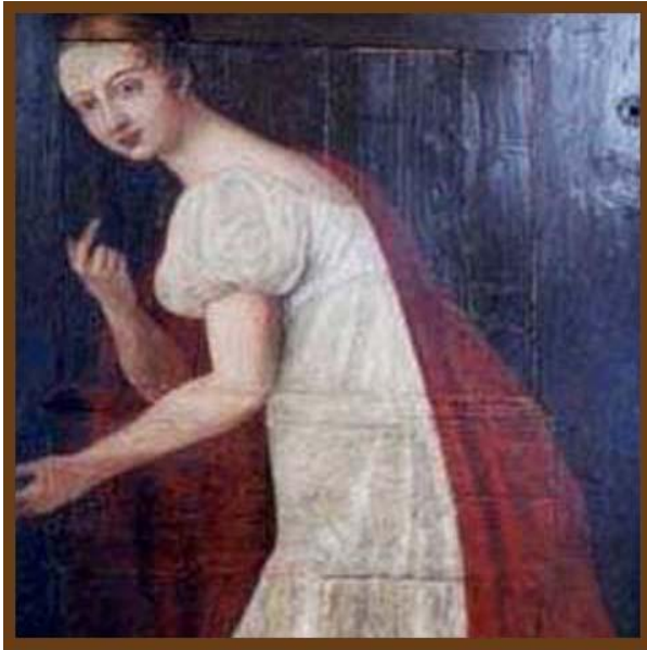
Obraz levočskej bielej panej na radnici v Levoči