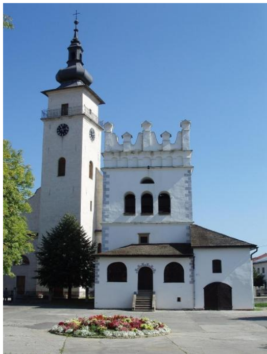
Podolíne- kostol a zvonica