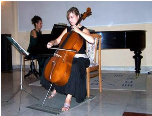
Obr. 4 .....