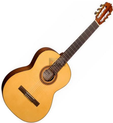
Obr. 2 .....