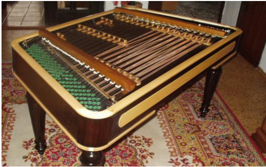
Obr. 1 .....

Úloha 1.: Pomocou internetu zisti názvy jednotlivých hudobných nástrojov zobrazených na obrázkoch, ktoré patria do skupiny strunových hudobných nástrojov.