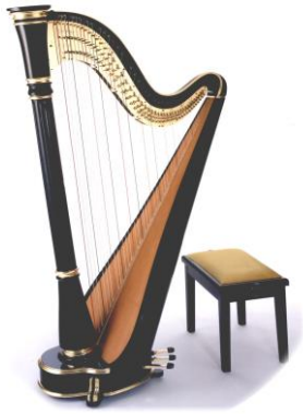
Obr. 3 .....