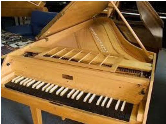
Obr. 2 – Čembalo