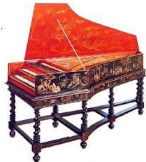
Obr. 3 – Clavecin