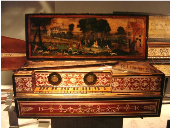
Obr.1 – Virginal