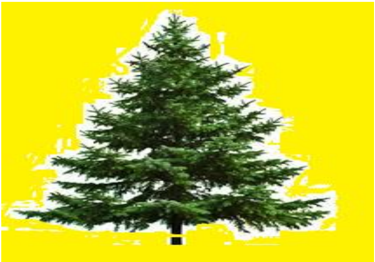
Na obrázku je ..... strom