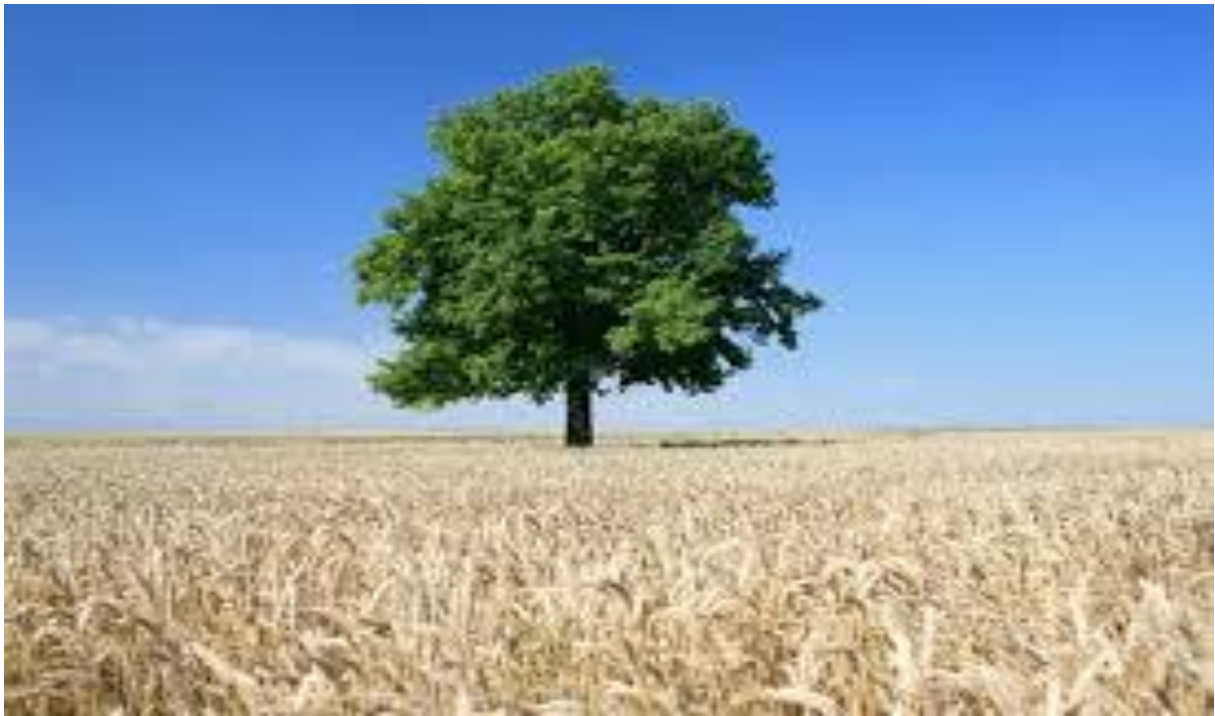
Na obrázku je ..... strom