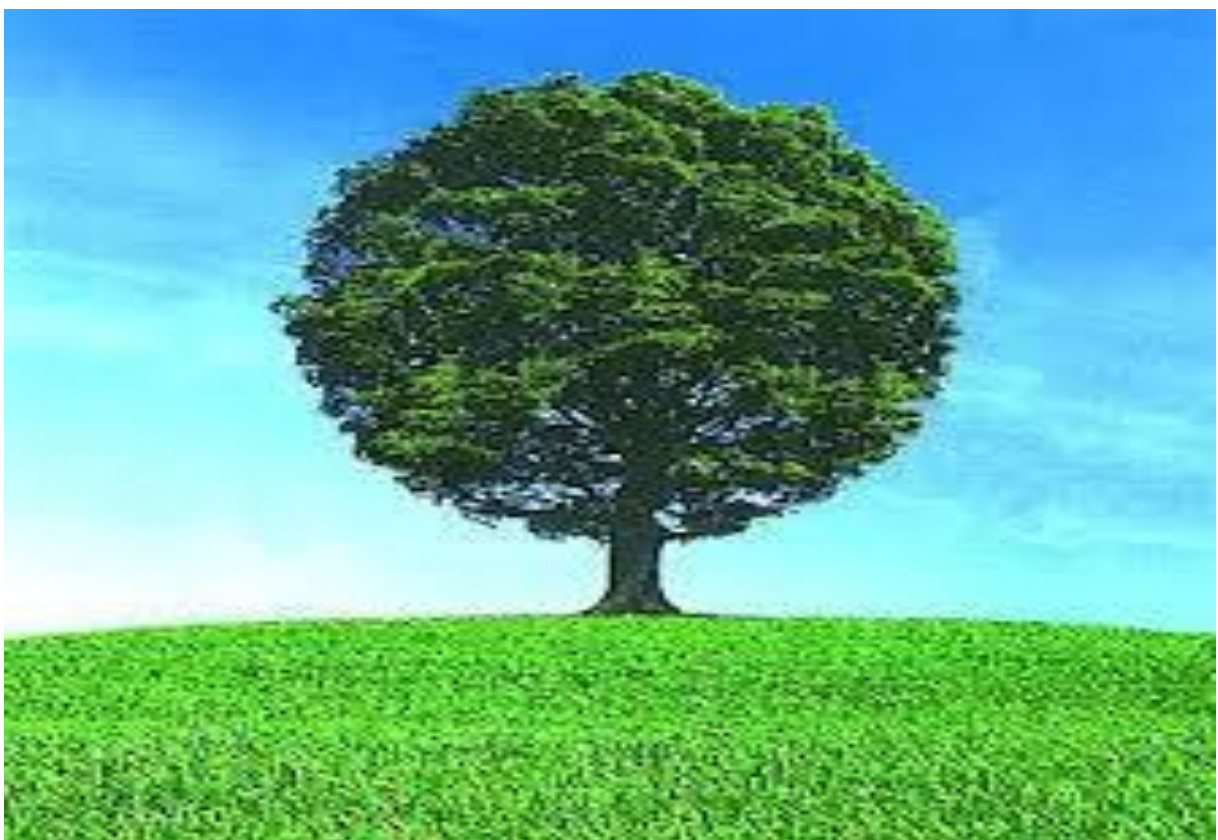
Na obrázku je ..... strom