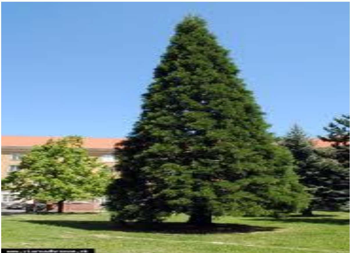
Na obrázku je ..... strom