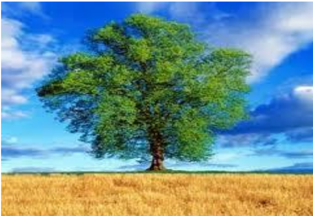
Na obrázku je ..... strom