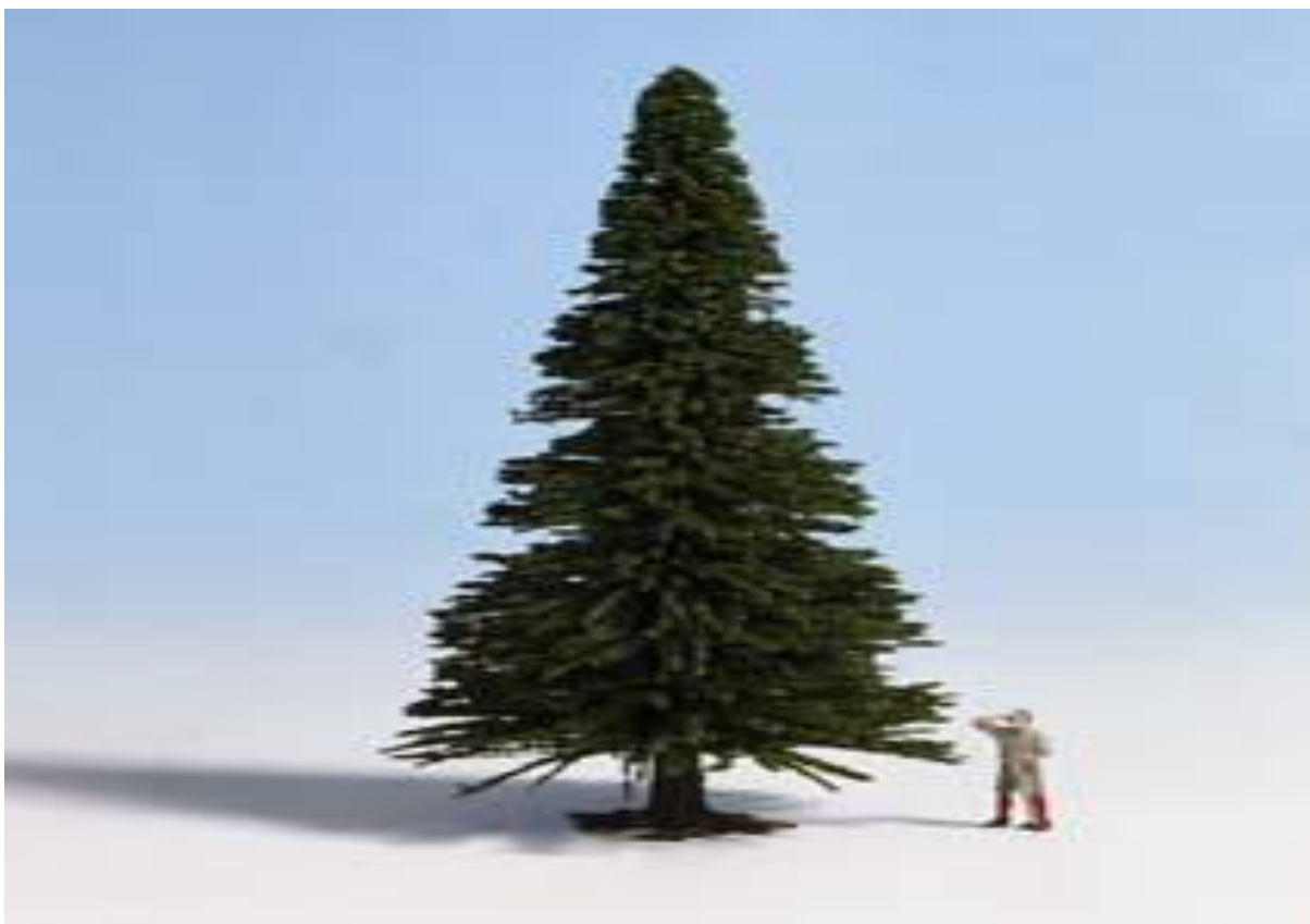
Na obrázku je ..... strom.