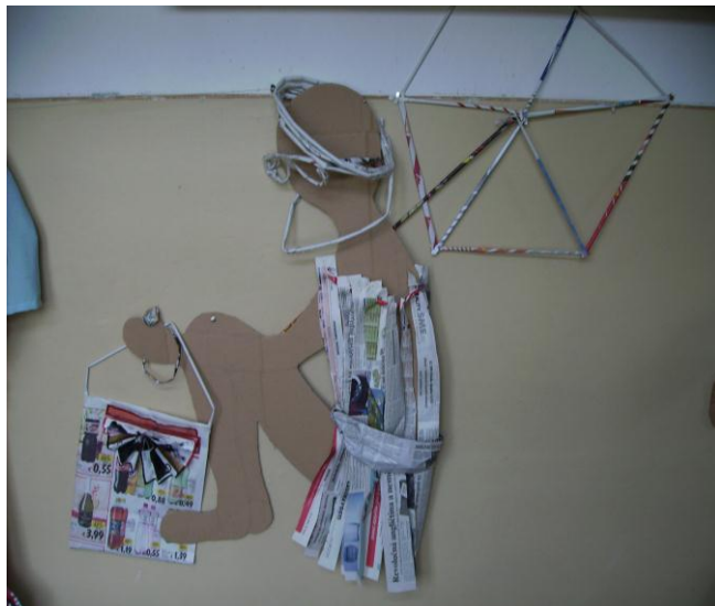
obrázok 17- dievča pod slnečnikom