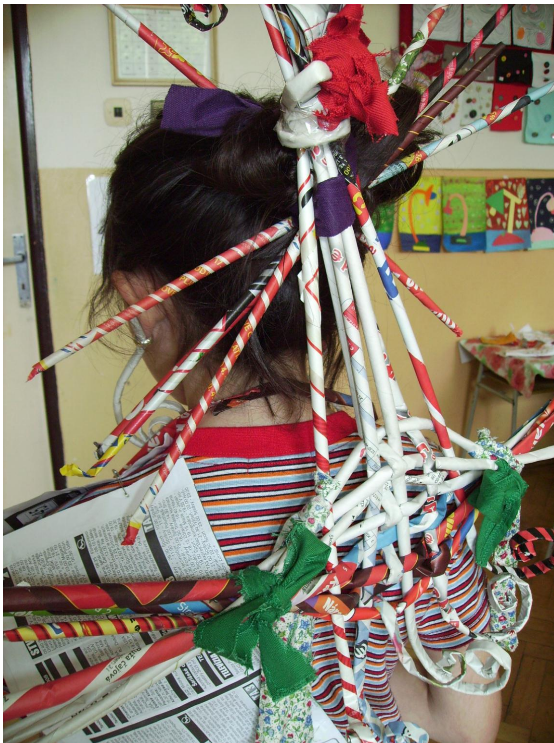
doplňky- ozdoby vlasov