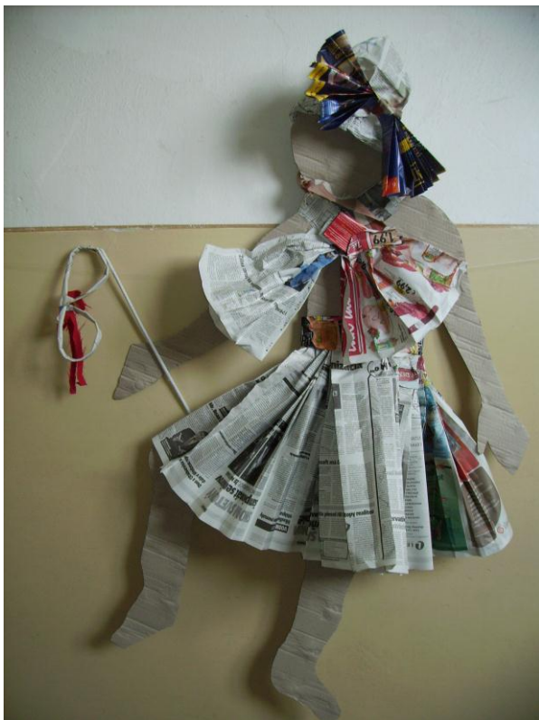
obrázok 15 - žena v kroji