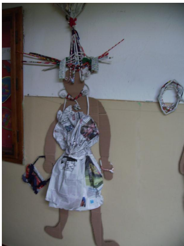
obrázok 19- modelka