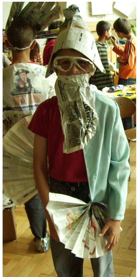
doplňky- brada, čiapka