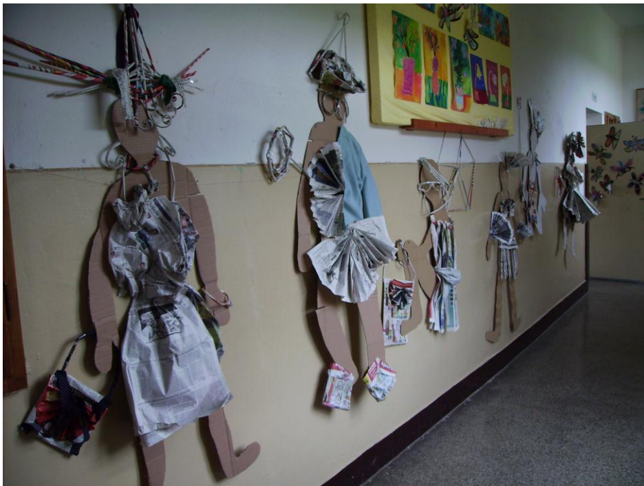
obrázok 22- papierová módna prehliadka

10. Oblečené figúry pripevni v páse na stenu v priestoroch chodby, alebo triedy. Ku každému modelu prilep na stenu aj jeho popis- pracovný list (Názov modelu). Takto sa na papierovú módnú prehliadku môže prísť pozrieť neskôr hocikto.