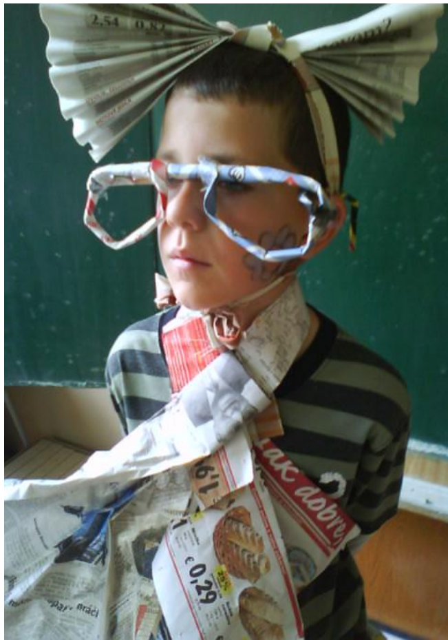
doplňky- mašľa a šatka