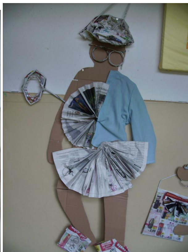
obrázok 20 – trpaslík