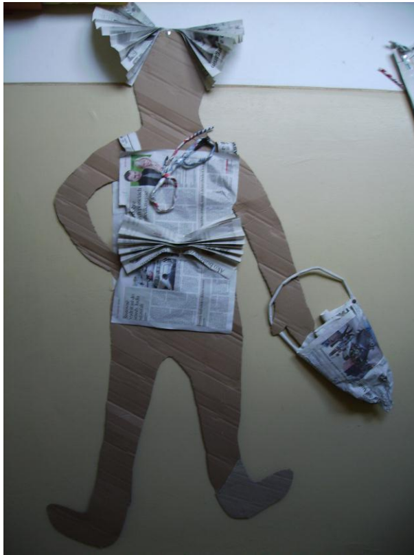
obrázok 21- dievča v lete

10. Oblečené figúry pripevni v páse na stenu v priestoroch chodby, alebo triedy. Ku každému modelu prilep na stenu aj jeho popis- pracovný list (Názov modelu). Takto sa na papierovú módnú prehliadku môže prísť pozrieť neskôr hocikto.