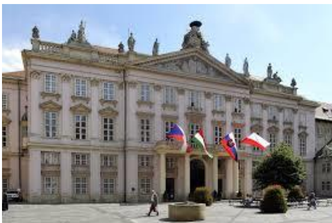
Primaciálny palác v Bratislave