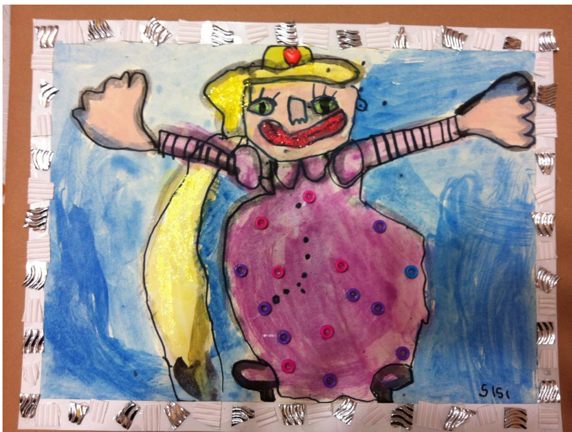
princezná Rapunzel z rozprávky „Na vlásku“

Využitie: Usporiadame si výstavu bábik. Obrázok umiestnime do detskej izby.