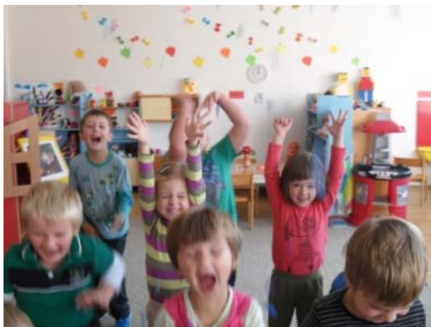
Obr. 5 Dramatické stvárnienie dažďa

bovala deťom veľkú radosť, deti dokázali reagovať na dohovorený signál. Hra prechádza do výtvarnej aktivity na tému jeseň. V závere deti naliepali dažďové kvapky na výtvarné práce s témou jesennej krajiny, ktoré vytvorili deň predtým (obr. 6).