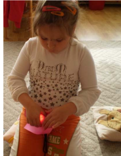
Obr. 46 Overovanie predpokladu o priesvitnosti materiálu II