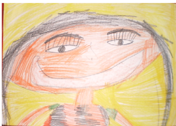
Obr. 30 Kresba – autoportrét dieťaťa