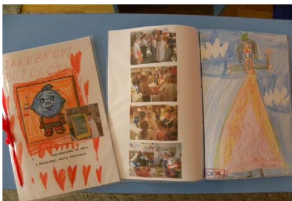
Obr. 29 Narodeninová knižka

Odovzdávanie „narodeninovej knižky“ oslávencovi sa realizuje z časových dôvodov až v niektorý z nasledujúcich dní. Knižka je vytvorená z kresieb každého dieťaťa na výkres. Výkresy sú pomocou dierkovača a farebných stužiek (podľa prania dieťaťa) zviazané. Súčasťou „narodeninovej knižky“ sú aj fotografie dokumentujúce celú oslavu. Obmenou darčeka k narodeninám je leporelo formátu A5 vytvorené z kresieb detí, ktoré sú kreslené obojstranne, zalaminované a zlepené lepiacou páskou. Na prvej a poslednej strane sú fotografie z oslavy v materskej škole.