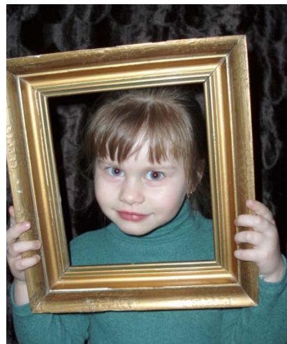
Obr. 75 Interpretácia obrazu I.