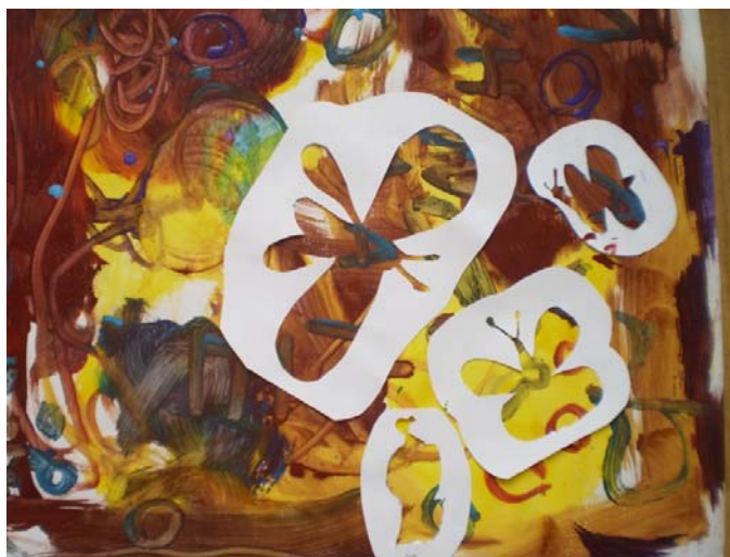
Obr. 55 Výtvarná práca deti

Po aktivite sa deti opäť posadili do kruhu, nasledovala reflexia, v ktorej vyjadrovali svoje názory na maľovanie aj na vypočutú hudobnú skladbu. V závere učiteľka rozložila do stredu triedy ich výtvarné produkty. Deti kládli šablóny motýľov na farebnú plochu, čím sa vytvoril priestor pôsobiaci ako lúka plná kvetov a motýľov (obr. 55). Nasledoval pobyt vonku so zameraním na pozorovanie motýľov a kvetov.