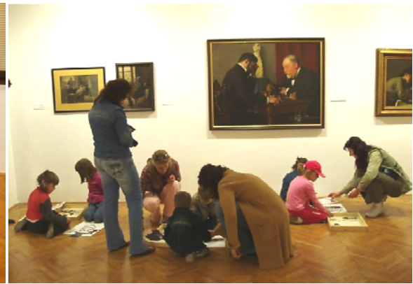
Obr. 81 Vytváranie portrétov