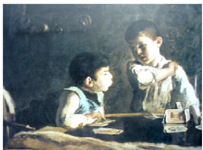
Obr. 69 Obraz Zámok z karát

Opis aktivity: Pred príchodom detí do triedy učiteľka pripravila prostredie na interpretáciu obrazu (tmavý záves, stolík, karty). Deti mali nájsť v katalógu medzi reprodukciami obrazov prostredie podobajúce sa tomu, ktoré bolo vytvorené v triede (obr. 69). Potom sa rozprávali o tom, ako sa cítia deti na obraze, a zdôvodňovali ich pocity. Nasledovalo vytváranie živého obrazu (obr. 70, 71).