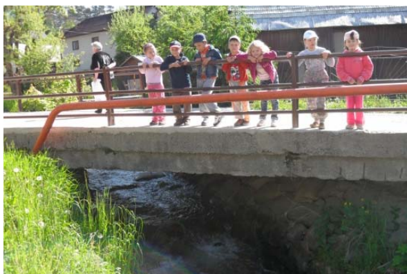
Obr. 40 Pozorovanie potoka

Reflexia aktivity: Pre deti bola uvedená aktivita netradičná a mali z nej hlboký zážitok. Najobľúbenejším miestom na pozorovanie potoka boli mosty. Prekvapilo ich vlievanie potoka do rieky, pretože tento jav videli prvýkrát.