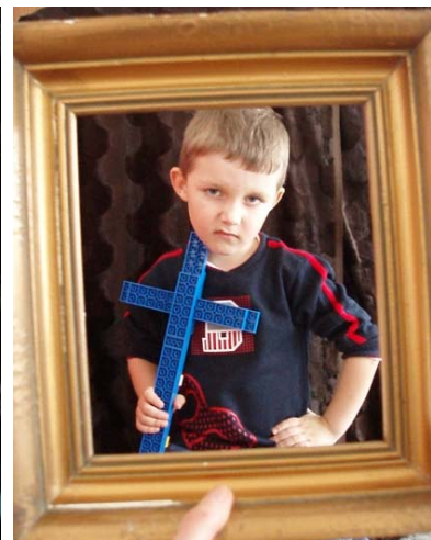
Obr. 76 Interpretácia obrazu II.

Reflexia aktivity: Prázdny rám bol pre deti veľmi pútavou motiváciou. Dokázali vymyslieť rôzne výrazy, pričom sa dobre zabávali. Vyjadrovali nielen vonkajšie prejavy správania (usmieva sa, mračí sa...), ale pomenúvali aj emocionálne stavy osoby na obraze, prípadne vlastnom autoportréte. Deti si samotné navrhovali rekvizity. Pri zisťovaní prekonceptov niektoré deti vyjadrili pojem autoportrét slovami: „...oni nakreslia auto, potom ho vymaľujú a presne také isté spravia.“