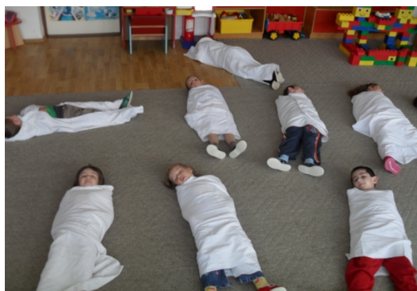
Obr. 58 Dramatické stvárnienie kukly