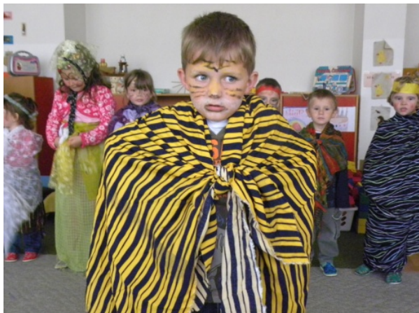
Obr. 1 Maska tigra

do aktivity spontánne zapojili. Je veľmi dôležité vychádzať zo záujmu detí. Najobľúbenejšími postavami, ktoré deti vytvárali, boli napr. zvieratá (obr. 1), princezné, šermiari, kovboji, sultáni (obr. 2) a rôzne iné. Výhodou je spolupráca dvoch tried, pretože deti môžu prezentovať vlastnú premenu a vytvorenie kostýmu pred kamarátmi z druhej triedy.