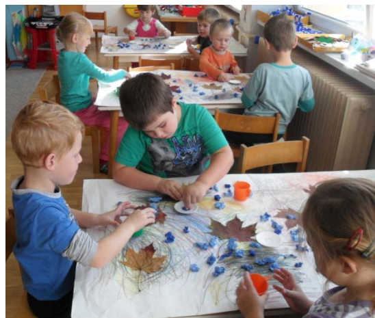
Obr. 6 Výtvarné práce na tému jeseň