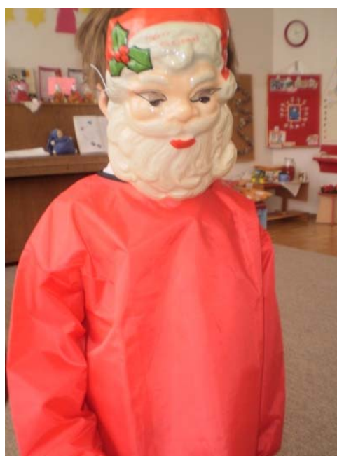
Obr. 20 Kostým Mikuláša

Reflexia aktivity: Aktivita bola zaradená bezprostredne po Mikulášskej besiedke. Deti sú naučené vytvárať príbehy v komunikatívnom kruhu na zadanú tému. Netradičné bolo zaradenie dramatizácie vytvoreného príbehu. Znenie príbehu bolo takéto: