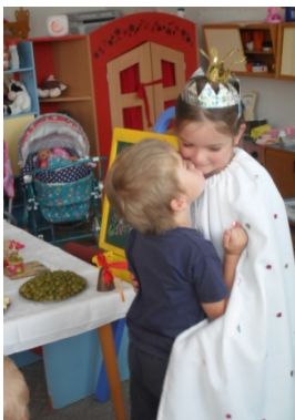
Obr. 26 Gratulácia

Reflexia aktivity: Rodičia s učiteľkou vopred dohodnú deň oslavy, aby ju mohla zaradiť do programu v určený deň v priebehu dopoludnia. Narodeninová oslava má svoje pevné pravidlá, ktoré sme si postupne spoločne vytvorili a na ktoré si deti zvykli. Všetci sa zapájajú aktívne do čítania narodeninového príbehu a podľa textu ho dopĺňajú (príroda v čase narodenia dieťaťa, príprava vecí pre novorodeniatko, starostlivosť o dieťa). Deti si vzájomne blahoželajú, obdarúvajú sa kresbou v podobe narodeninovej knižky (obr. 29). K oslave patrí ovocné pohostenie, spev a tanec.