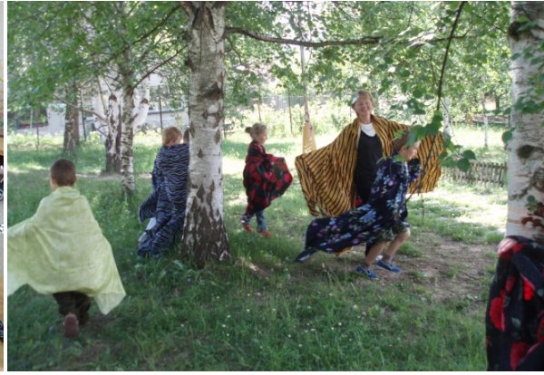
Obr. 61 Motýle v exteriéri školy