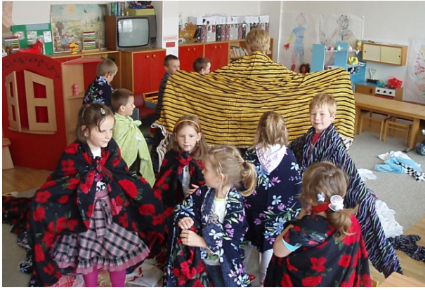
Obr. 60 Tanec na hudbu