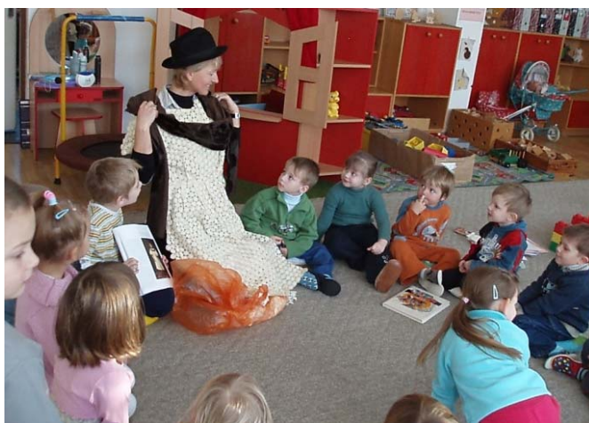
Obr. 66 Príprava rekvizít na interpretáciu obrazu

Reflexia aktivity: Učiteľka pri príprave projektu využila oslavu narodenín v materskej