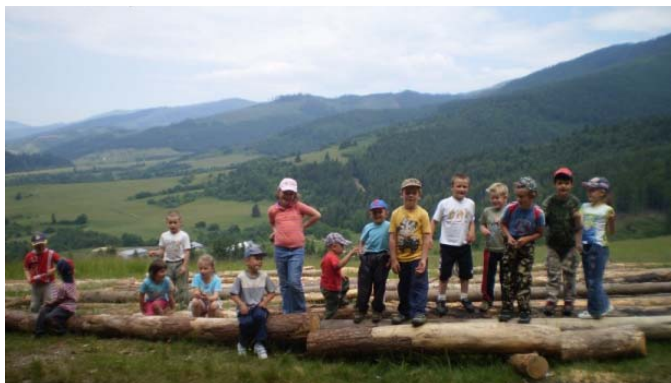
Obr. 64 Turistická vychádzka I

Deti boli na vychádzku primerane vystrojené. Pred ňou sa s učiteľkou rozprávali o tom, čo budú v prírode pozorovať a ako sa majú správať. Na vychádzke detailne pozorovali stromy, kríky, kvety, oblohu, drobné živočích. Učiteľka upriamila ich pozornosť na motýle. Pozorovali ich let a sfarbenie.