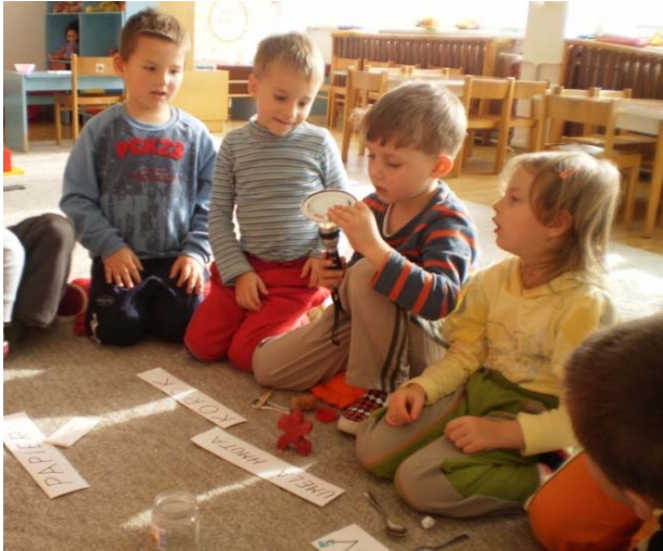
Obr. 45 Overovanie predpokladu o priesvitnosti materiálu I