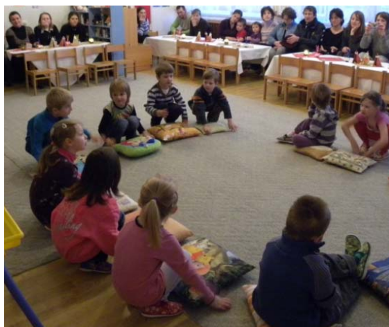
Obr. 16 Pantomíma – Malá rozprávka o repe

Reflexia aktivity: Deti si mohli vymyslieť aj ďalšie vedľajšie postavy, ktoré v príbehu vystupovali (napr. ľudia v čakárni), aby ich bolo do aktivity zapojených viac. Dramtizáciu je vhodné opakovať niekoľkokrát za sebou. Jej obmenou bola hra na lekára, v ktorej deti využili nadobudnuté vedomosti a schopnosti v rámci projektu „Ľudské telo“ (podkapitola 3.5).