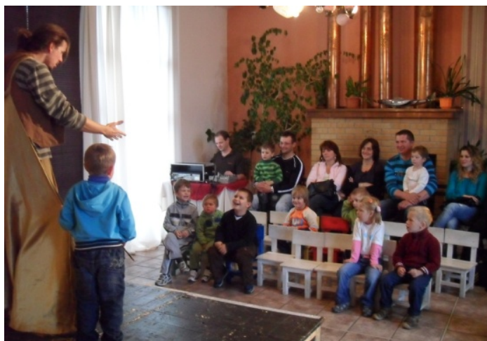
Obr. 22 Divadelné predstavenie Otesanček

Opis aktivity: Učiteľka rozdelila deti do dvoch skupín podľa toho, či navštívili alebo nenavštívili divadelné predstavenie „Otesanček“ v bábkovom divadle v rámci školského výletu (obr. 22). Potom diskutovala o rozprávke s deťmi, ktoré boli v divadle. Poslucháči počúvali rozprávanie svojich kamarátov o deji rozprávky a o zážitkoch z divadla a v závere mohli klásť deťom – odborníkom otázky.