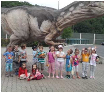
Obr. 35 Výlet do Dinoparku

Opis aktivity: Učiteľka v komunikatívnom kruhu motivovala deti rozprávaním o školskom výlete. Najprv si všetci pripomenuli, kde všade boli na školskom výlete, prípadne, kde boli na výlete s rodičmi. Potom im navrhla, aby spoločne vymysleli, kam by mohli ísť na nasledujúci školský výlet. Vysvetlila im pravidlá, že zdvihnutím ruky sa môžu prihlásiť a po vyzvaní vyjadriť svoj návrh, aby ho mohla zapísať na tabuľku. Po dokončení návrhov sa deti venovali inej činnosti a učiteľka zatiaľ návrhy vyhodnotila. Zapísala ich do novej tabuľky a pripisovala čiarky podľa ich opakovania. V závere aktivity sa deti opäť zhromaždili pred tabuľkami, učiteľka čítala ich návrhy a počítali, koľkokrát sa návrh opakoval. Dohodli sa, že výsledok oznámia rodičom. Tabuľku umiestnili v šatni, aby si rodičia mohli prečítať návrhy detí. Deti mali za úlohu vysvetliť rodičom, čo v škole robili, a zistiť, či s návrhom súhlasia.