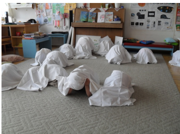
Obr. 56 Dramatické stvárnienie vajíčka

Reflexia aktivity: Do dramatického stvárnienia vývojových štádií motýľa sa zapojili všetky deti. Pri dramatickom stvárnení kukly učiteľka pomaly odrátavala dni, počas ktorých trvalo toto vývojové štádium (napr. prvý deň ráno, obed, večer, noc, druhý deň ráno, obed, večer, noc, tretí deň... desiaty deň...). Deti prežívali pri jednotlivých stvárnieniach vývojových štádií motýľa veľkú radosť, čo vyjadrili aj v sebareflexii.