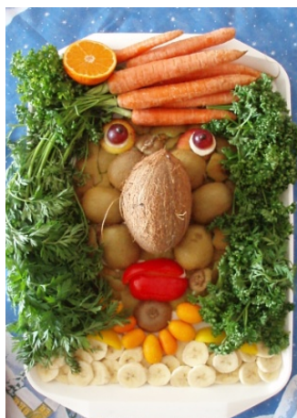
Obr. 84 Portrét z ovocia a zeleniny vytvorený učiteľkou I

Uvádzame jednu netradičnú aktivitu realizovanú v rámci projektu. Deti pozorovali obrazy G. Arcimbolda a mali povedať, čo na nich vidia. Ďalej mali vymyslieť, z čoho by vytvorili podobný obraz. Učiteľka doniesla do triedy celé aj nakrájané kúsky rôznych druhov ovocia a zeleniny. Ako inšpiráciu im ukázala portréty, ktoré vytvorila z ovocia a zeleniny (obr. 84, 85). Deti mali pomenovať ovocie a zeleninu, z ktorých boli vytvorené učiteľkine obrazy. Mali prísť na to, ktoré druhy ovocia a zeleniny sú nakrájané v miskách. Potom samy vytvárali portréty (obr. 86). Deti o aktivitu prejavili veľký záujem.