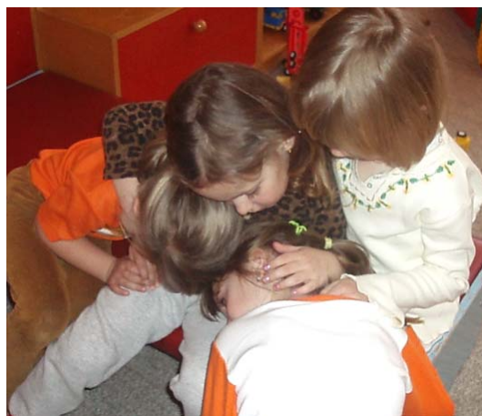
Obr. 11 Zmierenie po konflikte