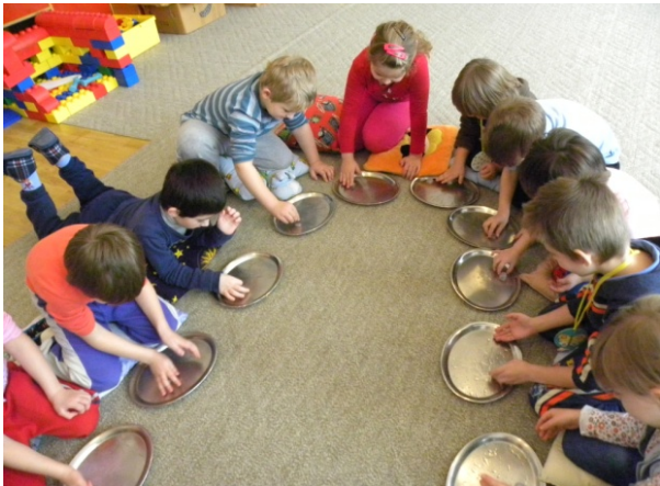
Obr. 43 Topenie kocky ľadu

Obmena aktivity: Deti môžu pozorovať topenie dvoch kociek ľadu na tácke súčasne, pričom sa jednej kocky nedotýkajú a druhú držia v rukách.