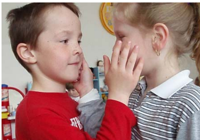
Obr. 10 Odpustenie po konflikte