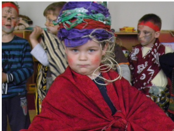
Obr. 2 Maska sultána