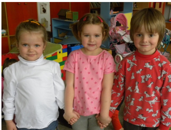
Obr. 87 Fotografia s vybranými kamarátmi I

Ak by sa stalo, že niektoré dieťa by nebolo vybrané iným dieťaťom ako najlepší kamarát, do hry by sa zapojila učiteľka, ktorá by si dané dieťa vybrala na spoločnú fotografiu.