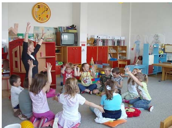
Obr. 53 Reagovanie pohybom na skladbu Motýlik

Učiteľka zadala deťom hudobnú hádanku: O čom bude hudobná skladba? Deti počúvali hudobnú skladbu Edvard Hagerup Grieg: Motýlik – počúvanie hudby a pohybom na ňu reagovali (obr. 53). Po vypočutí nasledoval rozhovor o tejto skladbe (oboznámenie s menom hudobného skladateľa, vysvetlenie tohto pojmu, navodenie detí na názov skladby, určenie hudobného nástroja, ktorý znel...). Ďalšou činnosťou bolo maľovanie na baliaci papier v skupinách pri stolíkoch na hudbu – znázorňovanie letu motýlika (obr. 54). Deti mali voľný výber farieb, výtvarných pomôcok na maľovanie (štetcov, špongií, kefiek a pod.). Učiteľka im vysvetlila, že počas maľovania budú počúvať hudobnú skladbu o motýlikovi. Podľa situácie skladba môže znieť aj druhýkrát.