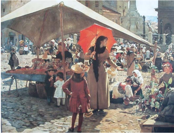
Obr. 72 Obraz Trh v Banskej Bystrici