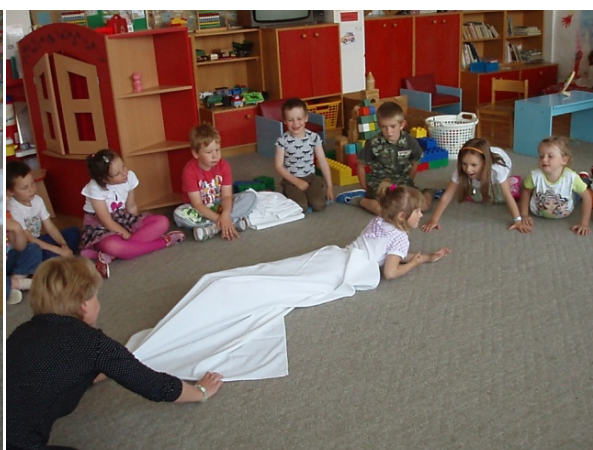
Obr. 57 Dramatické stvárnienie larvy