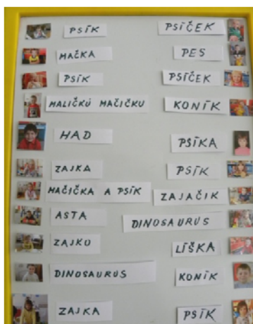
Obr. 47 Obľúbené zvieratá detí

Učiteľka im vysvetlila, že ku každej fotografii v tabuľke napíše názov zvieratka, podľa toho, ktoré zvieratko pomenujú. Navrhla im, aby skúsili uhádnuť, ktoré zvieratko si vyberie najviac detí. Postupne písala na papier názvy zvierat a prikladala ich k fotografiám detí (obr. 47). Potom bolo ich úlohou nájsť svoje zvieratko na obrázku v knihách alebo encyklopédiách a s pomocou učiteľky ho odfotografovať. Odfotografované obrázky zvierat s deťmi vytlačila a pripevnila na tabuľku namiesto napísaného názvu zvieratka. Deti obrázky jednotlivých zvierat počítali. Učiteľka vytvorila novú tabuľku, v ktorej boli pod sebou na obrázkoch druhy zvolených zvieratiek. Nakoniec každé dieťa vzalo svoju fotografiu z nástenky a priplo ju k vybranému zvieratku (obr. 48). V závere všetky deti spoločne zhodnotili výsledok a presvedčili sa o správnosti svojho predpokladu.