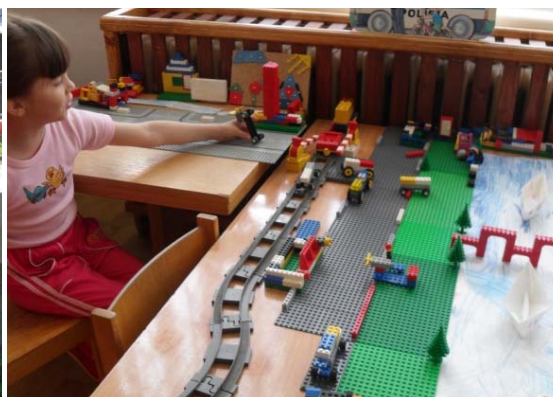
Obr. 41 Vytváranie modelu dediny