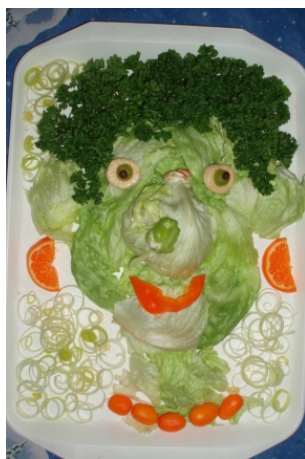
Obr. 85 Portrét z ovocia a zeleniny vytvorený učiteľkou II