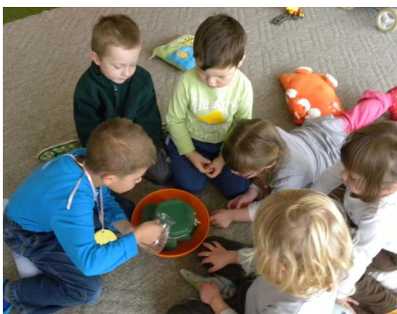
Obr. 49 Testovanie premokavosti materiálu I

Pri každom meraní ich učiteľka upozornila, aby odmerkou nalievali na testovaný materiál vždy rovnaké množstvo vody. Po zistení množstva vody, ktoré presiaklo cez materiál, ju vyliali znovu do odmerky a s pomocou učiteľky poznačili do záznamového hárka, koľko vody daným materiálom presiaklo (obr. 51). Jednotlivé záznamy (farebné čiarky) zobrazujúce množstvo presiaknutej vody možno farebne odlíšiť, napr. vyznačiť rovnakou farbou, ako je farba testovaného materiálu. Iným spôsobom označovania môžu byť rôzne symboly, prípadne deti môžu nalepiť kúsky testovaných materiálov k príslušným záznamom.