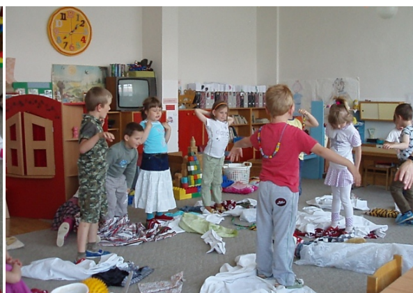
Obr. 59 Dramatické stvárnienie dospelého jedinca – motýľa