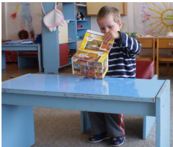
Obr. 7 Čarovná škatuľka

Reflexia aktivity: Počas aktivity vládlo v triede ticho plné očakávania, deti rešpektovali kamaráta, ktorý pozeral do škatuľky, a netrpezlivo očakávali, čo v škatuľke videl. Do hry sa zapájali deti všetkých vekových kategórií. Obmenu aktivity je vhodné zaradiť pre 5- – 6-ročné deti. Aktivitou sa u detí prirodzene rozvíja nielen obrazotvornosť, ale aj komunikácia a súvislé verbálne vyjadrovanie.