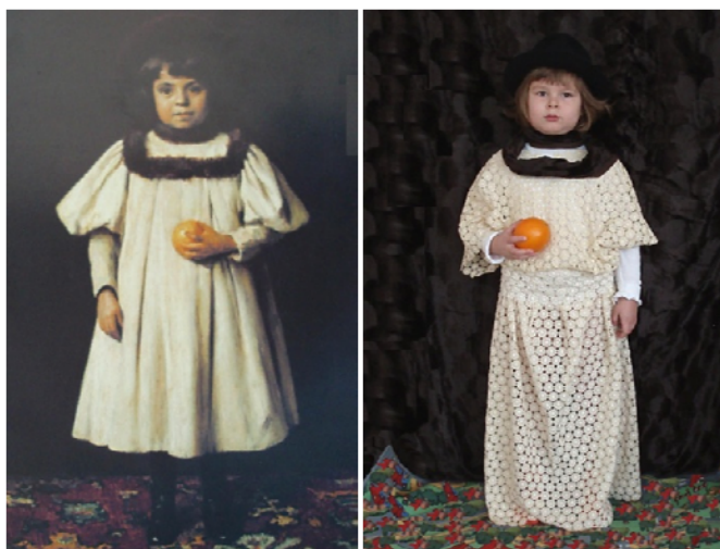
Obr. 67 Obraz Podobizeň dcéry Karoly (z katalógu)