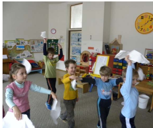
Obr. 18 Hra na obláčiky