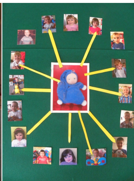
Obr. 32 „Zvedavničkova“ nástenka

Reflexia aktivity: Deti dokážu objektívne zhodnotiť správanie kamarátov a poukázať na ich dobré i zlé vlastnosti. Potrebný je pritom citlivý prístup učiteľky, aby deti nebadane navodila na rozmýšľanie