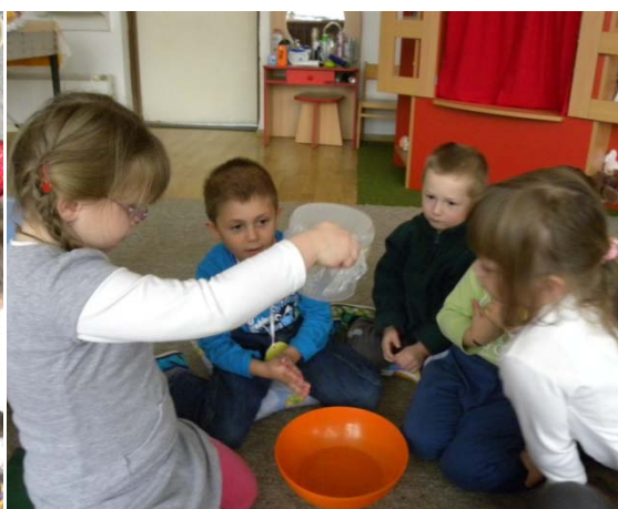
Obr. 50 Testovanie premokavosti materiálu II

Reflexia aktivity: Pri využívaní experimentu ako produktívnej metódy je dôležité formulovanie hypotéz (teoreticky alebo prakticky zdôvodnených predpokladov) a premenných , preto je aktivita vhodná len pre nadané a talentované deti vo veku 5 – 6 rokov.