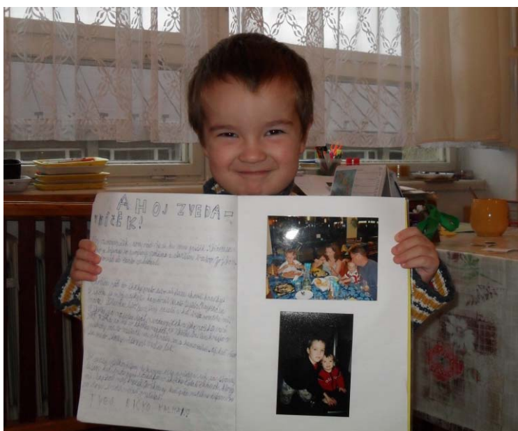
Obr. 31 „Zvedavničkova“ knižka