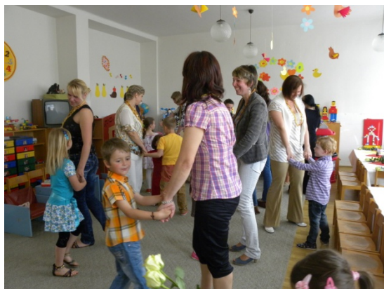
Obr. 24 Besiedka ku Dňu matiek