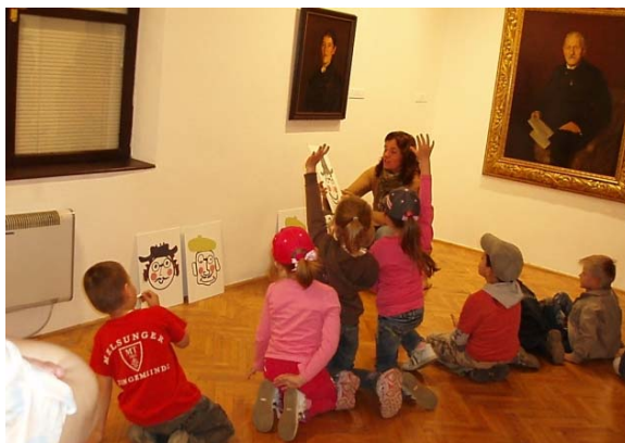
Obr. 82 Prezentovanie portrétov