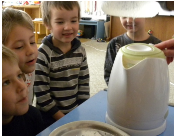
Obr. 42 Demonštrácia dažďa

Opis aktivity: Učiteľka nadviazala na tému oblakov a navrhla deťom hru na dážď. Motivovala ich, aby navrhli postup hry. Deti pri návrhoch využili skúsenosti s dramatickým stvárnením oblakov. Učiteľka im vysvetlila, že pršať z oblakov začne vtedy, keď je v oblaku veľmi veľa kvapiek, čo spôsobí, že sa oblak stane ťažkým. Pri hre deti využili rytmický nástroj hríbik. Po hre si posadali na koberec. Učiteľka demonštrovala pokus zameraný na vznik dažďa. Rýchlovarnú kanvicu položila na tácku a deťom povedala, že voda v nádobe bude predstavovať vodu na našej Zemi. Potom ukázala na sklenenú nádobu s vodou, ktorá predstavovala oblak na oblohe, a ktorú držala nad rýchlovarnou kanvicou. Do sklenenej nádoby pridala aj kocky ľadu, ktoré predstavovali ľadové kryštáliky nachádzajúce sa v oblakoch. Deti pozorovali, čo sa stane, keď sa voda z rýchlovarnej kanvice začne vyparovať.