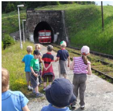
Obr. 36 Výlet do Telgártu