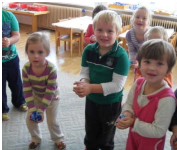
Obr. 4 Príprava na dramatické stvárnenie dažďa

Reflexia aktivity: Aktivita je vhodná pre deti všetkých vekových kategórií. Prejavovali veľký záujem o krčenie papiera, pretože pre ne bola motiváciou hra na dažďové kvapky. Mali možnosť vybrať si papiere rôznych odtieňov a farieb, pričom s učiteľkou diskutovali o tom, aké farby môže mať dažď. Okrem papierov modrej a čiernej farby si vyberali aj papiere farieb dúhy. Samotná hra na dažď spôsob-