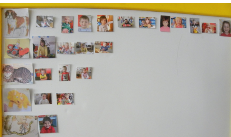
Obr. 48 Vyhodnotenie bádateľskej aktivity