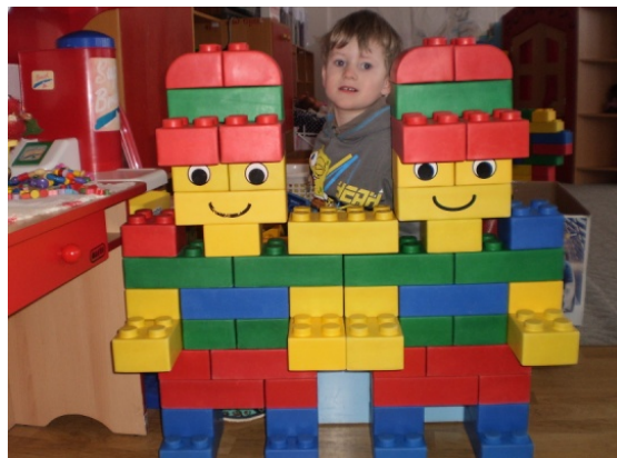
Obr. 39 Manipulovanie s Lego tehľami