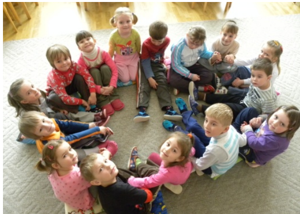
Obr. 21 Komunikatívny kruh

Opis aktivity: Denným rituálom je pre deti komunikatívny kruh (obr. 21). Učiteľka ich doň zvoláva zvončekom po príchode do materskej školy. Víťanie dňa znázorňovali v sede na vankúšoch pohybom na riekanku: „Slnko každé ráno vstáva, všetkým ľuďom silu dáva. Pozobúda všetky kvietky, do srdiečka nám zasvieti, aby sme sa mohli hrať, všetkých ľudí milovať.“ V riadenej diskusii vo veľkej skupine učiteľka motivovala deti pri rozprávaní návrhnutím určitej témy podľa aktuálnej situácie. Deti rozprávali loptičke Zvedavke svoje pocity, zážitky. Po riadenej diskusii spievali piesne, prednášali básne, riekanky, dopĺňali symboly do kalendára počasia, spolu s učiteľkou zostavovali program dňa.