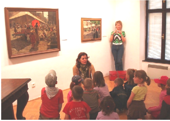
Obr. 78 Rozhovor detí s galerijnou pedagogičkou