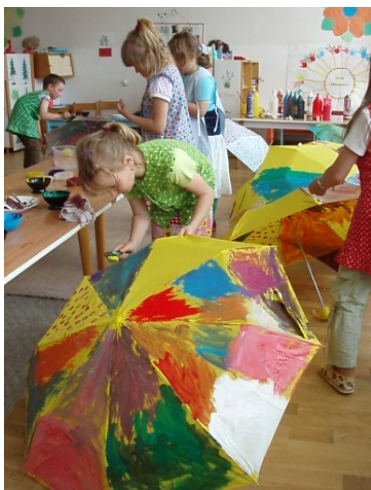
Obr. 62 Maľovanie dáždnikov

Reflexia aktivity: Na činnosť bolo potrebné vopred pripraviť triedu a pomôcky, aby malo každé dieťa svoj pracovný priestor. Podľa počtu detí je možné jeden dáždnik poskytnúť na maľovanie aj dvom deťom. Z aktivity mali deti nevšedné zážitky a samotný proces maľovania bol pre ne radostný. Našli sa aj nesmelé deti, ktoré potrebovali povzbudenie učiteľky.