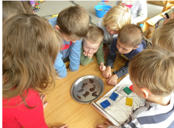
Obr. 44 Pozorovanie stuhnutej čokolády

Názov aktivity: JE TO PRIESVITNÉ ALEBO NEPRIESVITNÉ?