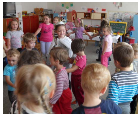
Obr. 28 Tanec s oslávencom