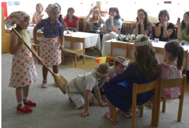
Obr. 17 Dramatizácia rozprávky O múdrom chlapčekovi a hlúpej liške

Reflexia aktivity: Predpokladom uplatnenia uvedenej metódy je ovládanie textu rozprávky a pochopenie priebehu deja. Učiteľka musí zvážiť, ktoré deti vyberie do jednotlivých skupín na základe ich komunikačných schopností. Dôležité je, aby deti, ktoré sú v komunikácii zručnejšie, boli zastúpené v oboch skupinách. Od učiteľky sa očakáva, že bude čo najviac deťom nápomocná pri tvorení otázok, aby ich pri tejto aktivite povzbudzovala. Matky potleskom odmeňovali všetky deti pri odpovediach na otázky.