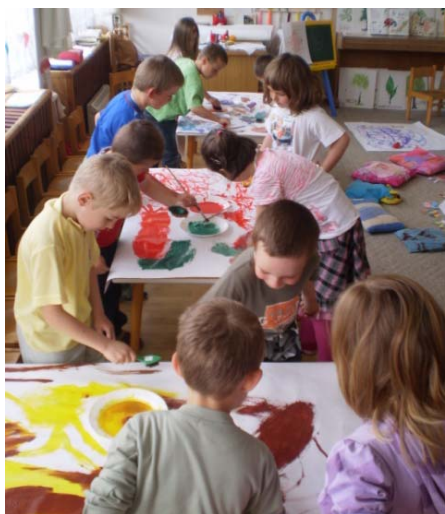
Obr. 54 Maľovanie na hudbu

Učiteľka zadala deťom hudobnú hádanku: O čom bude hudobná skladba? Deti počúvali hudobnú skladbu Edvard Hagerup Grieg: Motýlik – počúvanie hudby a pohybom na ňu reagovali (obr. 53). Po vypočutí nasledoval rozhovor o tejto skladbe (oboznámenie s menom hudobného skladateľa, vysvetlenie tohto pojmu, navodenie detí na názov skladby, určenie hudobného nástroja, ktorý znel...). Ďalšou činnosťou bolo maľovanie na baliaci papier v skupinách pri stolíkoch na hudbu – znázorňovanie letu motýlika (obr. 54). Deti mali voľný výber farieb, výtvarných pomôcok na maľovanie (štetcov, špongií, kefiek a pod.). Učiteľka im vysvetlila, že počas maľovania budú počúvať hudobnú skladbu o motýlikovi. Podľa situácie skladba môže znieť aj druhýkrát.