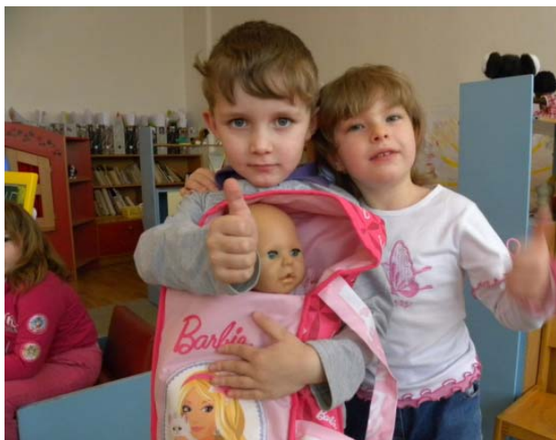
Obr. 8 Hra na rodinu