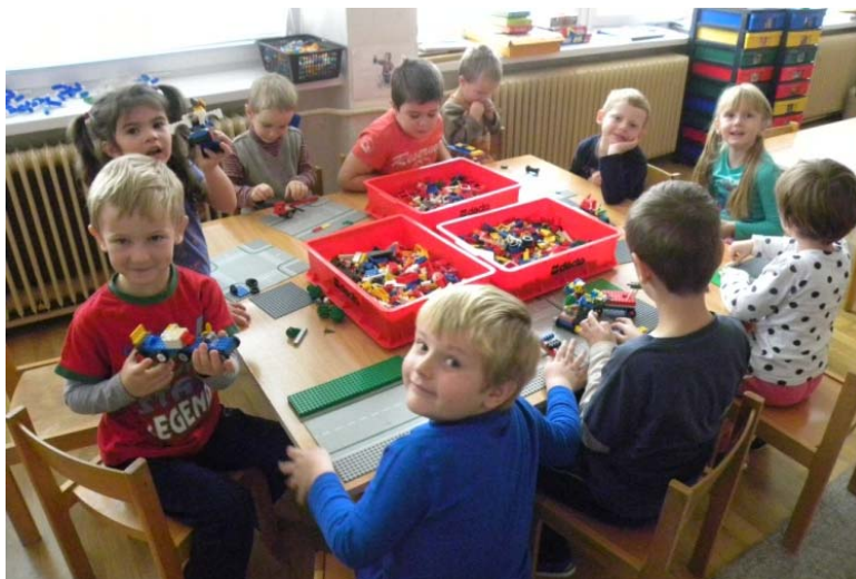
Obr. 34 Realizácia zmien vytvorených produktov z Lego Dacta

Reflexia aktivity: Deti sa aktívne zapájali do rozhovoru. Stále rozprávali, že je to robot, a že stále aj ostane robotom, menili len jeho funkcie. (Např.: Keď ho zväčšia, bude sa s ním dať cestovať. Ak by sa zmenšil, bude neviditeľný. Ak by ho obrátili, museli by byť ľudia pripútaní, aby z neho nevypadli.) Aktivita bola plná humoru.