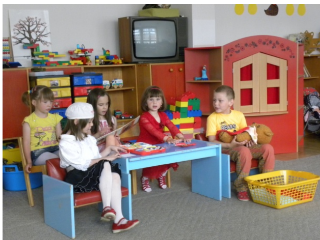
Obr. 15 Dramtizácia rozprávky Chorý medvedík

Opis aktivity: Učiteľka čítala deťom veršovanú rozprávku Chorý medvedík. Po prečítaní navodila deti na improvizáciu časti príbehu, v ktorej Anička prišla s medvedíkom k lekárovi (obr. 15). Deti najprv pripravili potrebné rekvizity a potom sa dohodli, kto bude v dramtizácii vystupovať.