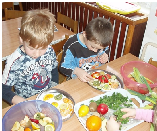
Obr. 86 Tvorba portrétov deťmi