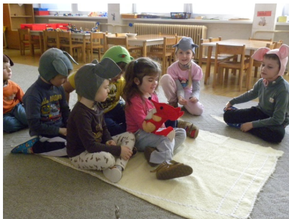
Obr. 14 Hra na rukavičku