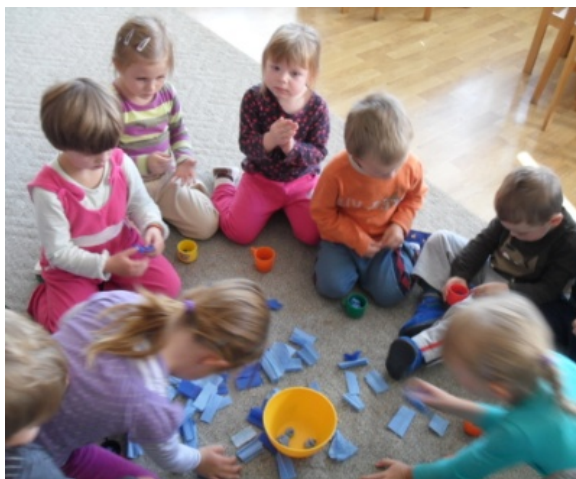
Obr. 3 Krčenie krepového papiera

Opis aktivity: Učiteľka motivovala deti hrou na dažď. Krčili nastrihané kúsky krepového papiera a ukladali ich do misiek (obr. 3). S pripravenými rekvizitami sa hrali na dažďové kvapky. Úlohou detí bolo dažďové kvapky pripravené v zovretých dlaniach vyhodiť na dohovorený signál (napr. počítať do 10) do vzduchu (obr. 4, 5). Potom pokrčené papiere znázorňujúce dažďové kvapky deti pozbierali a hra sa opakovala, kým o ňu nestratili záujem.