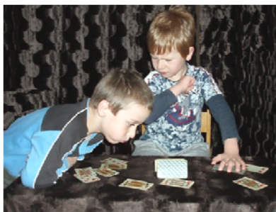
Obr. 70 Interpretácia obrazu I