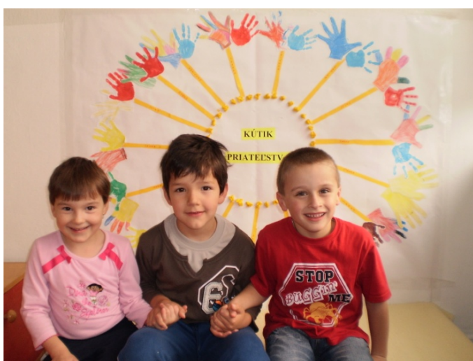
Obr. 12 Aktivita na tému Priateľstvo