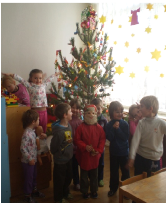
Obr. 19 Hra na Mikuláša

Opis aktivity: Učiteľka navrhla deťom, aby si spoločne vytvorili vlastný príbeh o Mikulášovi. V komunikatívnom kruhu si postupne podávali loptičku a každé dieťa, ktoré držalo loptičku v ruke, mohlo príbeh doplniť o jednu alebo niekoľko viet. Ak dieťa nemalo záujem zapojiť sa do vytvárania príbehu, podalo loptičku ďalšiemu kamarátovi, čo všetci rešpektovali. Učiteľka príbeh nahrávala na diktafón a v závere si ho všetci spoločne vypočuli z nahrávky. V druhej fáze aktivity nasledovala dramatizácia vytvoreného príbehu (obr. 19, 20).