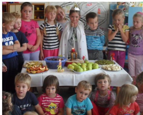
Obr. 27 Spoločná fotografia na oslave