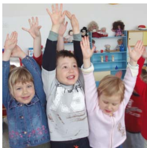
Obr. 13 Vyjadrenie radosti z kamarátstva