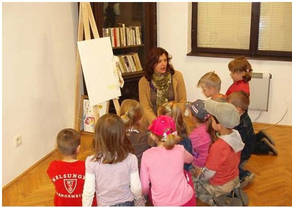
Obr. 80 Oboznamovanie s pomôckami maliarov