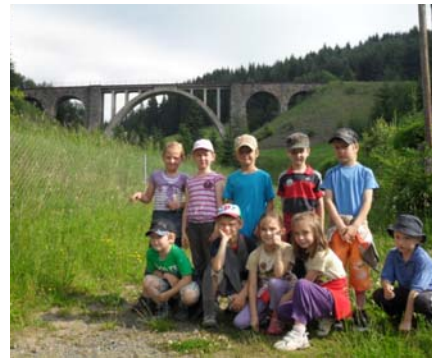
Obr. 37 Viadukt v Telgárte

Reflexia aktivity: Deti boli aktívne a trezlivé, dokázali počkať, kým ich učiteľka vyvolá, pretože chceli, aby bol ich návrh zapísaný do tabuľky. Kým sa nedozvedeli výsledok, sami vyjadrovali domnienku, aké budú výsledky. Pretože sa táto aktivita uskutočňovala v závere školského roka, išlo o reálne zisťovanie záujmu detí o školský výlet. V najväčšej miere navrhovali výlet do Dinoparku, pretože v daný týždeň tam bolo jedno z detí a rozprávalo o ňom kamarátom. Téma dinosaurov je u detí veľmi obľúbená, preto tento návrh zvíťazil a výlet do Bratislavy sa uskutočnil (obr. 35). Zrealizovali sme aj druhý návrh. Cestovali sme vlakom do Telgártu, kde deti mali možnosť vidieť tunel (obr. 36) aj viadukt (obr. 37).