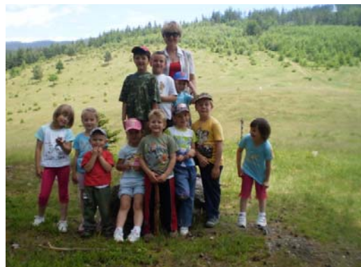
Obr. 65 Turistická vychádzka II