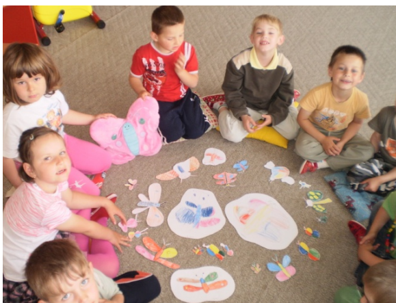
Obr. 52 Vystrihnuté motýle