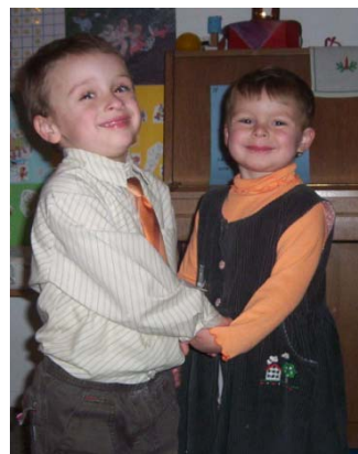
Obr. 25 Tanec na besiedke