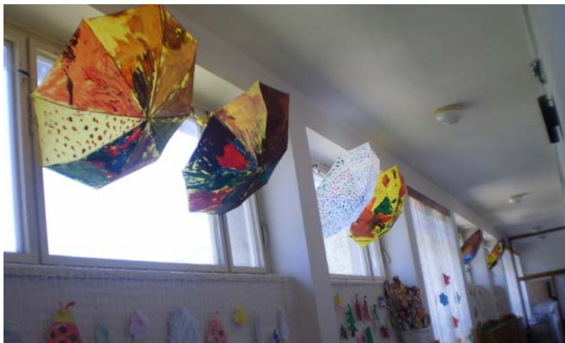
Obr. 63 Maľované dáždniky ako výzdoba interiéru materskej školy