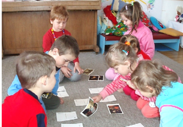
Obr. 77 Hra pexeso

Opis aktivity: Učiteľka mala na koberci pripravené pomôcky – pohľadnice, na ktorých boli reprodukcie diel Dominika Skuteckého (v pároch). Deti sa s ňou najprv voľne rozprávali o tom, čo na nich vidia. Ich úlohou bolo vymyslieť názov každého obrazu. Potom im učiteľka z pohľadnice prečítala skutočné názvy obrazov a porovnávali ich s názvami, ktoré vymysleli. Nasledovala tradičná hra pexeso (obr. 77).