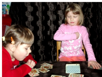
Obr. 71 Interpretácia obrazu II

Reflexia aktivity: Dôležitý bol rozhovor učiteľky s deťmi o obraze, jeho slovná interpretácia a nasledujúca interpretácia pohybom. Táto aktivita opäť deti zaujala a po predchádzajúcom dni boli rady, že aj ony sa môžu zahrať na obraz tak, ako dieťa, ktoré interpretovalo obraz Podobizeň dcéry Karoly predošlý deň. Niektoré deti si vyskúšali interpretáciu oboch postáv na obraze.