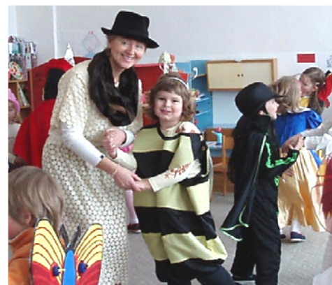
Obr. 83 Dcéra Karola na fašiangovej veselici

V galérii mohli deti pozorovať portréty rôznych ľudí. Zaujímavou aktivitou bolo vytváranie portrétov z pripravených pomôcok (obr. 81) a ich neskoršie prezentovanie (obr. 82). Deti rozprávali, aký portrét vytvorili, ako sa ten človek cíti, ako sa tvári a pod.