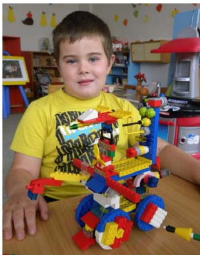
Obr. 33 Robot

Opis aktivity: Po hrách a hrových činnostiach detí učiteľka využila konštrukciu chlapca z Lego Basic (obr. 33). Chlapec najprv porozprával deťom, čo postavil a na čo má jeho výtvor slúžiť. Potom spolu s ostatnými deťmi vymýšľali, ako možno robota využiť inak. Učiteľka u nich stimulovala tvorbu nápadov otázkami, na ktoré odpovedali podľa vlastnej predstavivosti. V rozhovore s nimi zakomponovala všetky otázky súvisiace s touto metódou: Prispôbiť? Zmeniť? Zväčšiť? Zmenšiť? Nahradiť? Inak usporiadať? Obrátiť? Kombinovať?