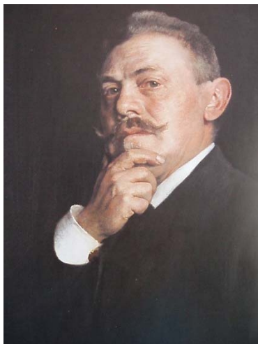
Obr. 74 Autoportrét D. Skuteckého

Opis aktivity: Učiteľka zisťovala prekoncepty detí na tému portrét a autoportrét. Potom im tieto pojmy vysvetlila a ukázala ich v katalógu Dominika Skuteckého (obr. 74). Deti postupne hovorili, ako na ne tieto obrazy pôsobia, snažili sa pomenovať náladu, ktorú obraz vyjadruje. Nasledovala hra „na obraz“. Deti si v kruhu podávali prázdny rám obrazu a mali znázorniť najprv mimikou, neskôr aj využitím rekvizít, rôzne nálady a pocity (obr. 75, 76). Úlohou ostatných detí bolo pomenovať náladu alebo pocit, ktorý dieťa v obraze vyjadrovalo.