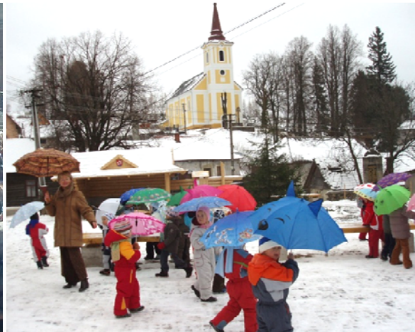
Obr. 73 Interpretácia obrazu