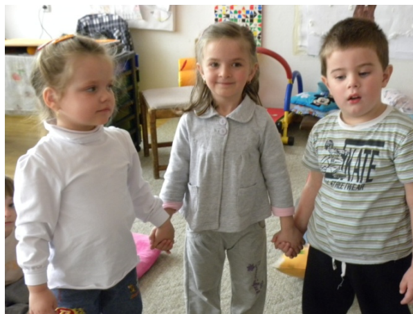
Obr. 88 Fotografia s vybranými kamarátmi II