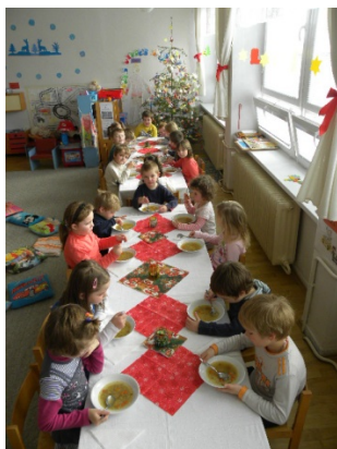
Obr. 23 Vianočná besiedka

Reflexia aktivity: Možnosti na realizáciu besiedok počas školského roka sú viaceré: jesenná besiedka pre starých rodičov, Mikulášska, vianočná, fašiangová, veľkonočná besiedka, besiedka ku Dňu matiek (obr. 24), besiedka ku Dňu detí, besiedka na rozlúčku s materskou školou. Je nežiaduce, aby sa deti drilom učili program naspamäť, aby ich učiteľky štylizovali do neprirozených rolí a nútili do vystúpení, naopak, je podstatné, aby učiteľka prihliadala na emocionálnosť detí, na ich záujmy, potreby, záľuby, aby mali možnosť samy si vybrať, ako sa chcú prezentovať (obr. 25). Dôležité je zväziť časové trvanie besiedky s akcentom na začiatok besiedky, aby deti neboli unavené, aby bol zostavený program premyslený a dával deťom po stránke psychohygieny možnosť odpočinku medzi jednotlivými výstupmi. Mali by sa zmysluplne striedať statické a dynamické časti výstupov. Je vhodné nepriamo zapojiť do programu aj pozvaných hostí, či už vhodnými hádankami, kvízmi, alebo ich v závere zapojiť do tanečných aktivít. Veľmi pozitívne pôsobí, ak program obsahuje aj humorné vsuvky, ktoré rozveselia hostí, uvoľnia atmosféru. Predovšetkým záleží na prirodzenom správaní učiteľky, ktorá celú besiedku vedie, aby jej nechýbal nadhľad a vžitie do pocitov hostí i účinkujúcich detí.