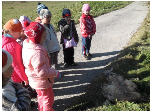
Obr. 9 Vychádzka do prírody

Opis aktivity: Deti boli na vychádzke v lese a videli, ako je príroda znečistená odpadkami, zdochlinami (obr. 9). Na základe tejto skúsenosti neskôr v triede inscenovali situácie zažité v lese a hľadali riešenia. Sedeli na stoličkách po krajoch triedy, aby ostal v jej strede voľný priestor, ktorý predstavoval les. Ľubovoľné dvojice detí sa hrali, ako sme boli na vychádzke, pričom najprv odchádzali za dvere, aby sa dohodli na postupe inscenovania prežitej situácie. Po inscenáciách nasledovala riadená diskusia vo veľkej skupine, v ktorej sa deti vyjadrovali ku skúsenosti, ktorú zažili, a navrhovali rôzne východiská (brainstorming, podkapitola. 3.3).