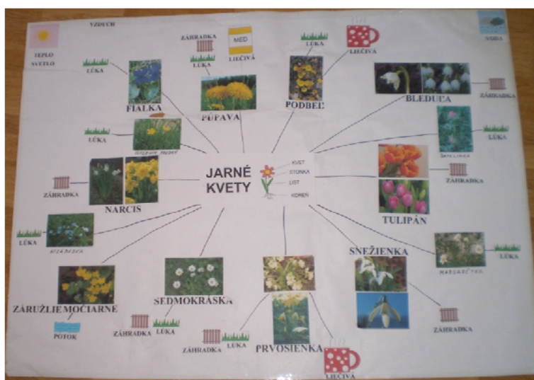
Obr. 89 Pojmová mapa „Jarné kvety“

Reflexia aktivity: Pojmovú mapu je vhodné uplatňovať ako vyvrcholenie projektu, keď sa už deti orientujú v danej téme. Pri téme jarné kvety je efektívne, ak si obrázky kvetov samy vytvoria – odfotia digitálnym fotoaparátom a v materskej škole vytlačia. Vytvorenú pojmovú mapu je potrebné umiestniť v triede na viditeľné miesto, aby bola deťom čo najviac dostupná a mohli si v aktivitách individuálne alebo v skupinách overovať získané vedomosti z danej témy.