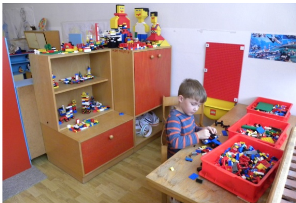
Obr. 38 Manipulovanie s Lego Dacta a Lego Basic

Reflexia aktivity: Manipulovanie je každodennou súčasťou hier a hrových činností. Hotové diela detí dávajú na výstavu a po ukončení hrových činností spoločne s učiteľkou produkty hodnotia. Majú možnosť samostatne porozprávať, čo vytvorili. Po manipulácii s konštrukčným materiálom je vhodné využiť metódu zoznamu kontrolných otázok (podkapitola 3.3). Najpoužívanejšou pomôckou pri manipulovaní sú rôzne stavebnice, ale deti si môžu rozvíjať manipulačné schopnosti aj pri práci s inými materiálmi, napr. plastelínou, cestom, papierom atď.