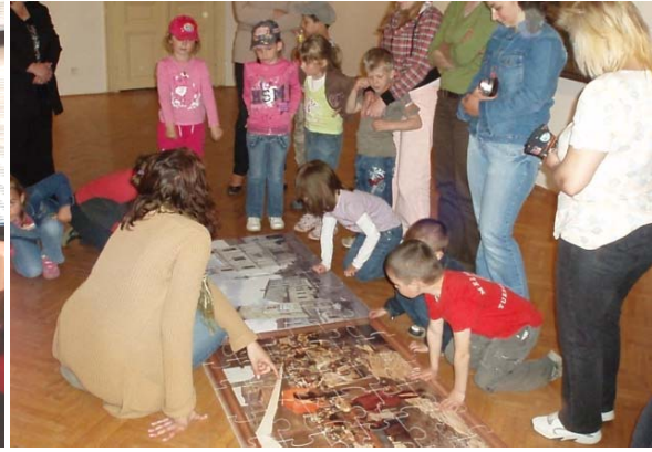
Obr. 79 Hľadanie podobností a rozdielov