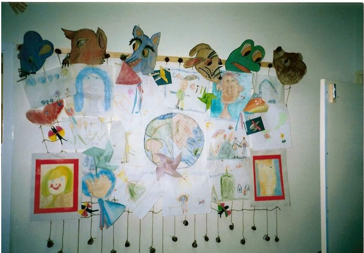
Výstavka výtvarných prác detí na tému: ZEM a jej obyvatelia