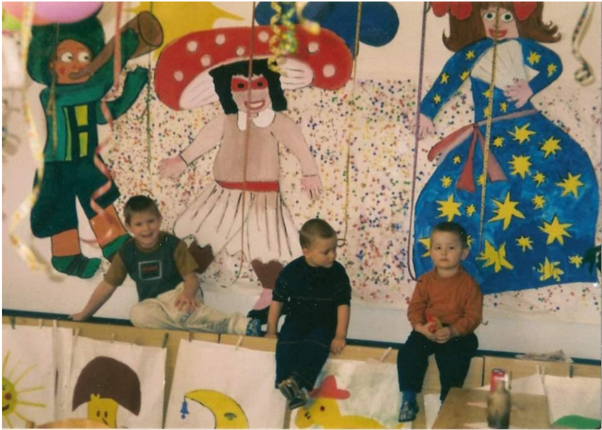
Kresba temperou – téma: Boli sme na karnevale