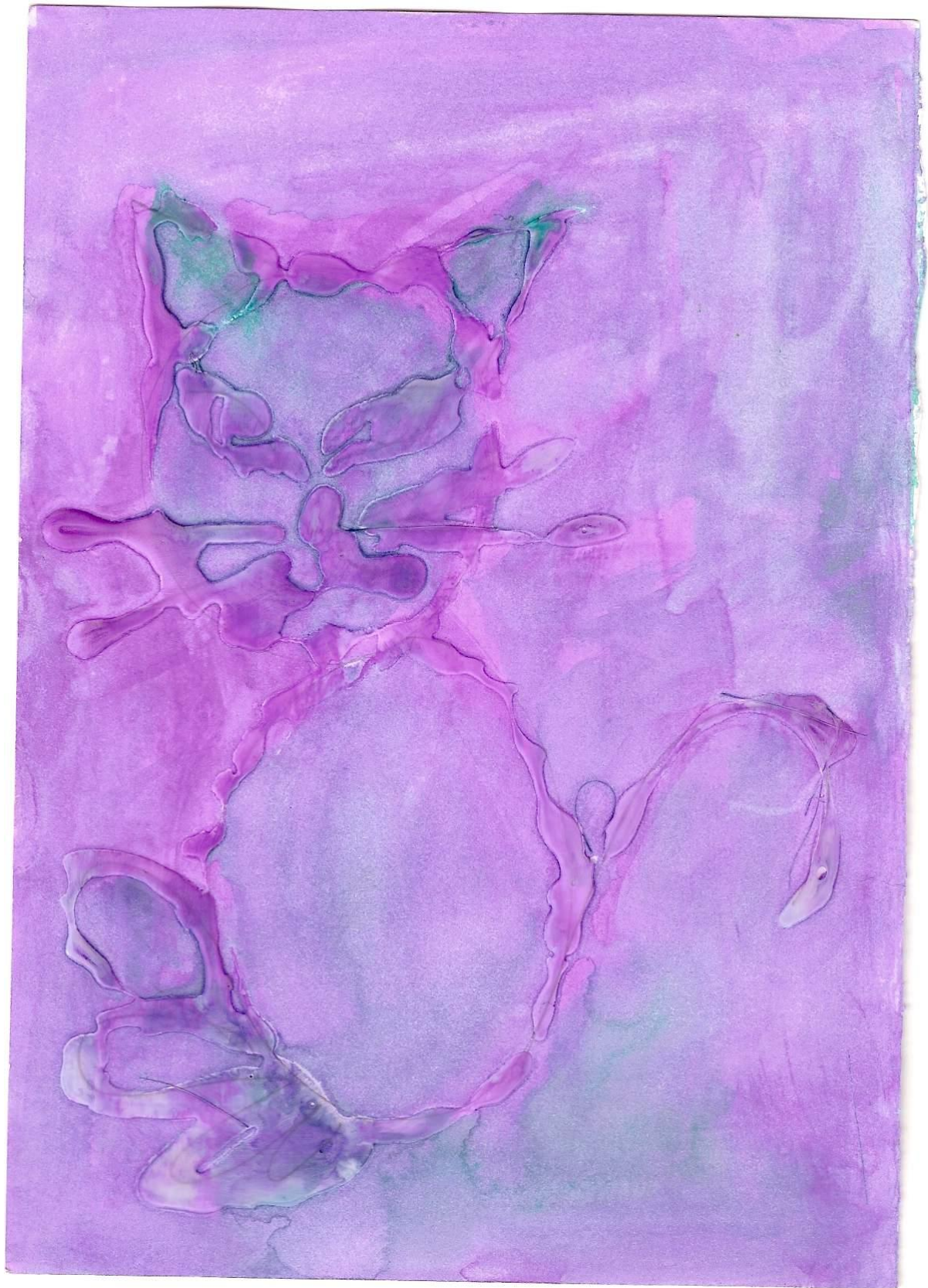
Kresba disperzným lepidlom a akvarelovými farbami