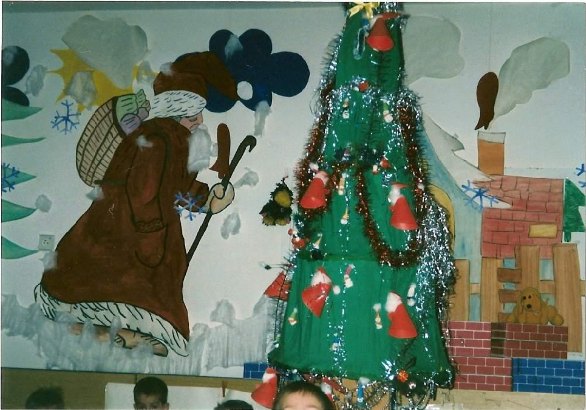
Spoločná práca učiteľky s deťmi