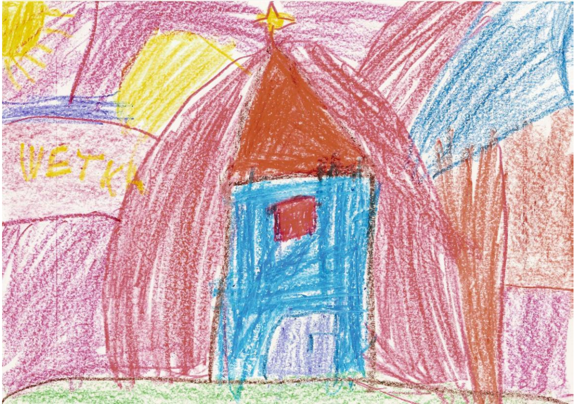
Z farebných častí poskladaný domček