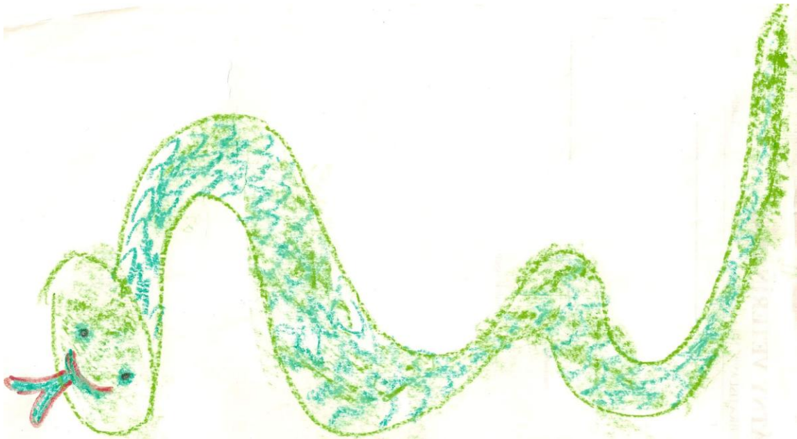
Užovka – kresba po environmentálnej prednáške