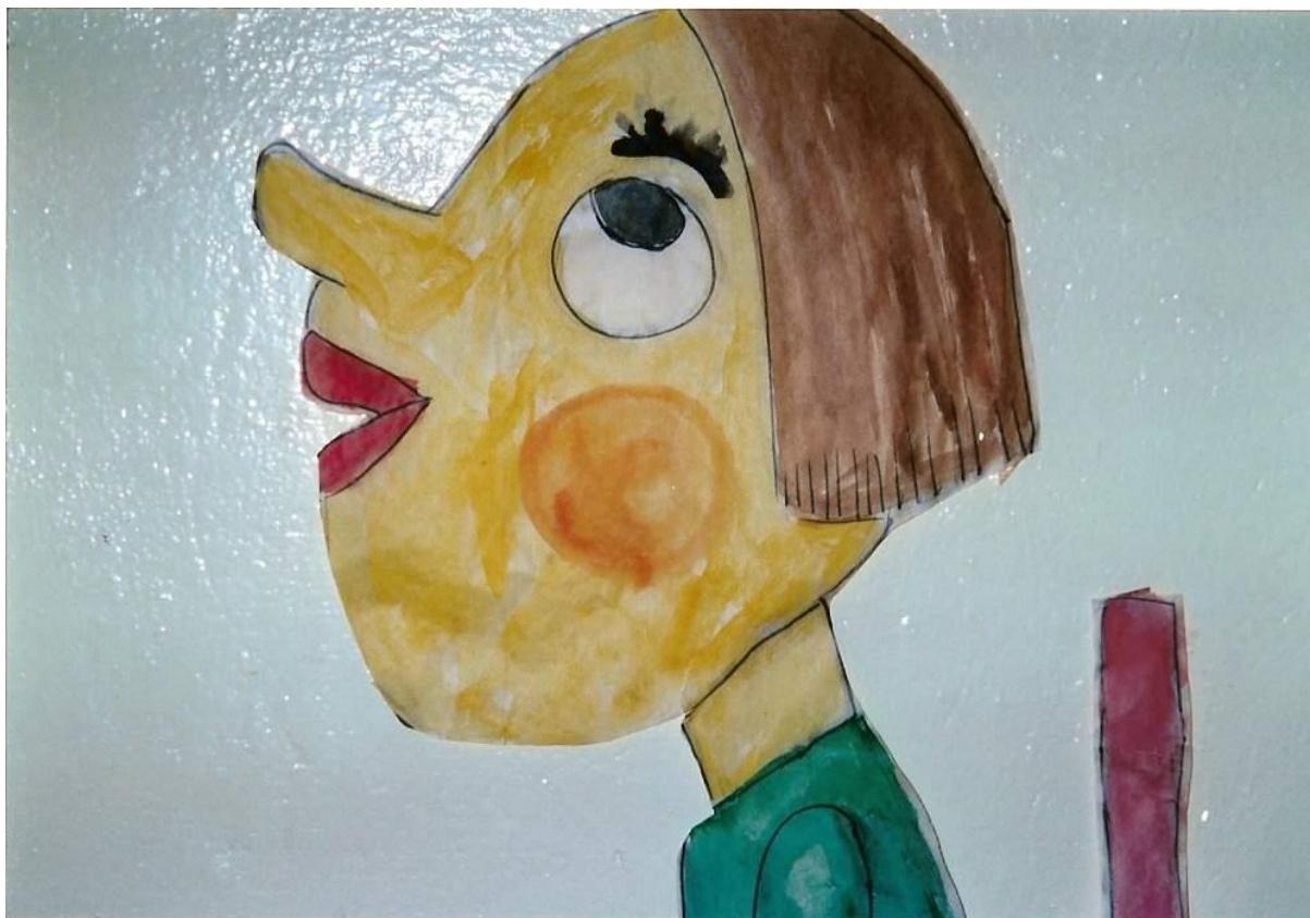
Ukážka výtvarných prác na tému: Ja a môj priateľ