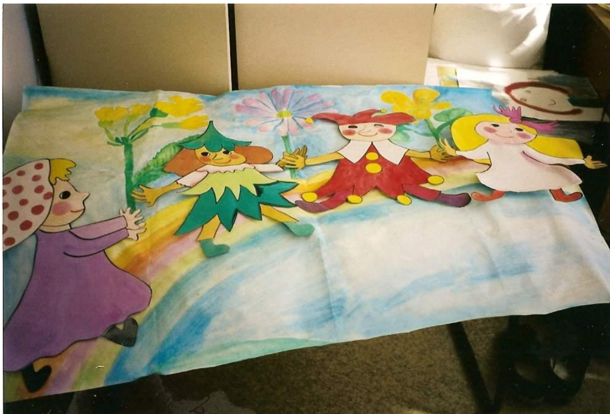
Kolektívne spracovanie témy – SVET očami detí