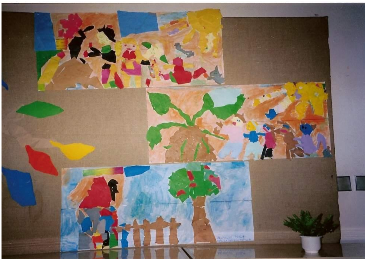
Kombinovaná technika – téma: Jeseň v záhrade, Farebná jeseň