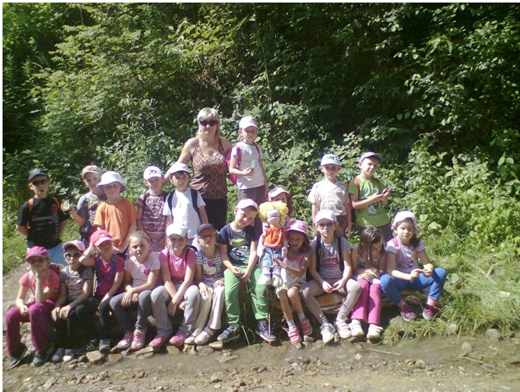
Turistická vychádzka k studničke