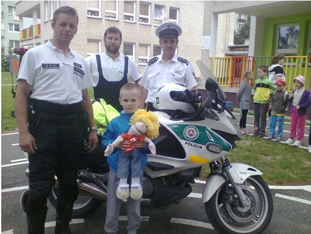
Adamko na dopravnom ihrisku