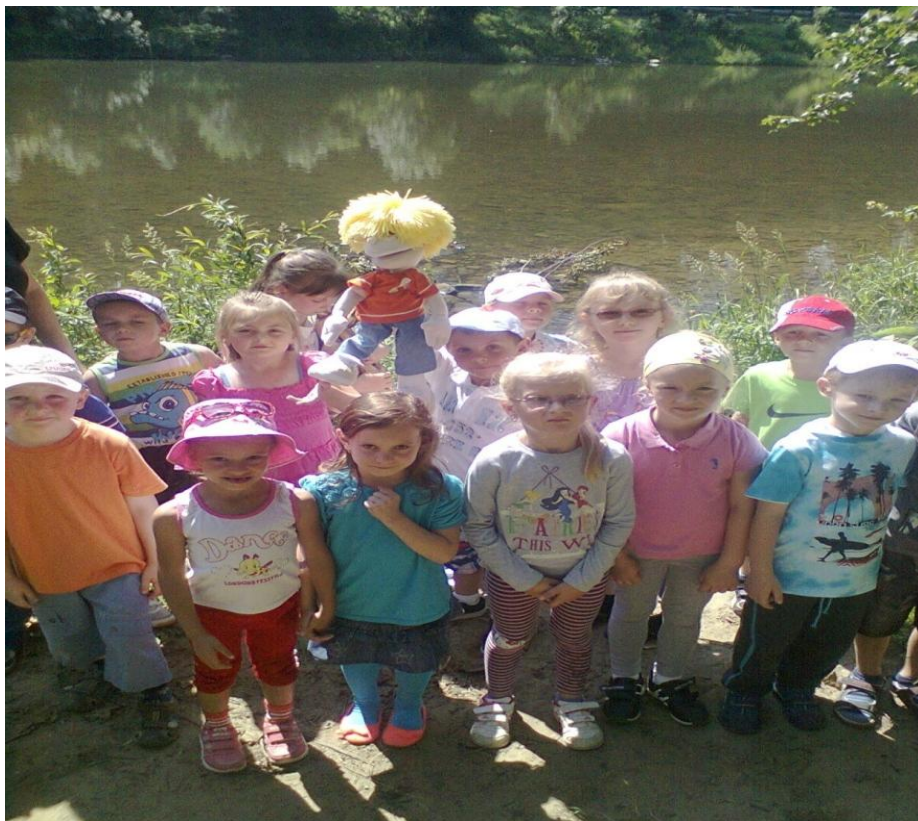
Rieka Kysuca