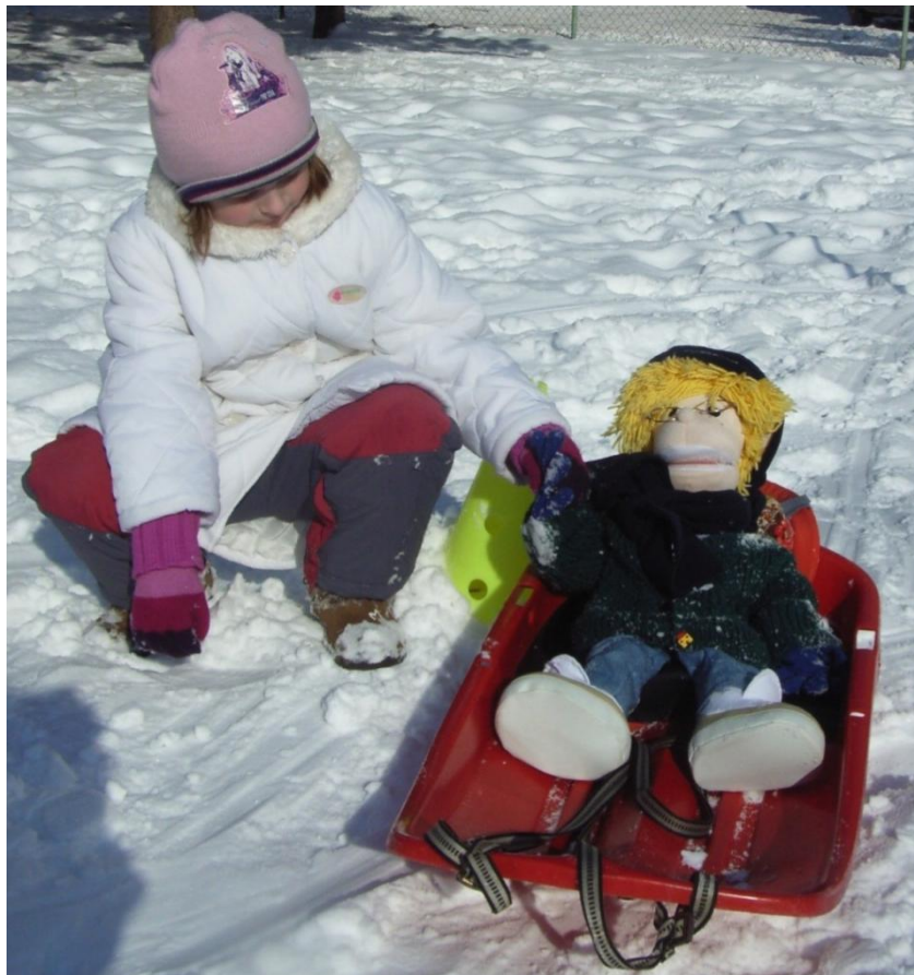
Adamkova zimná olympiáda