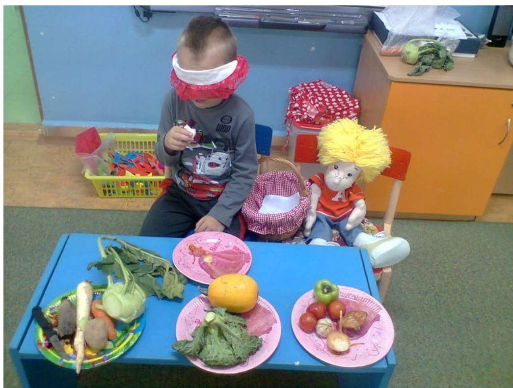
Adamkov plný košík plodov jesene