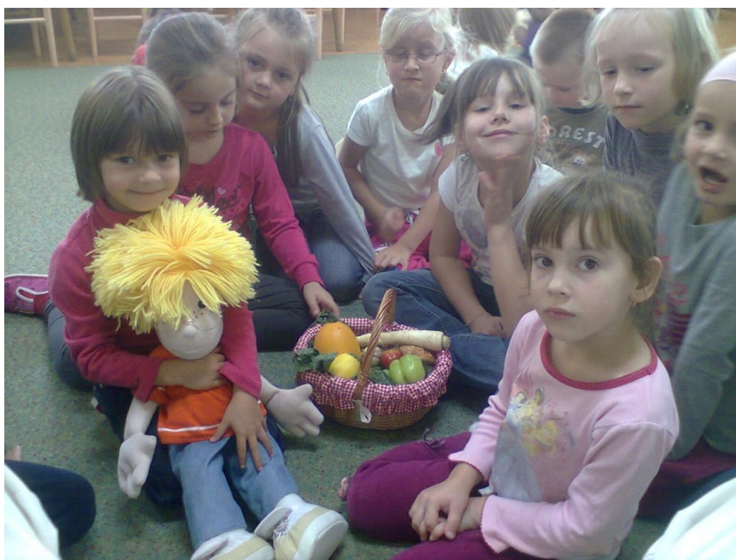
Adamkov plný košík plodov jesene