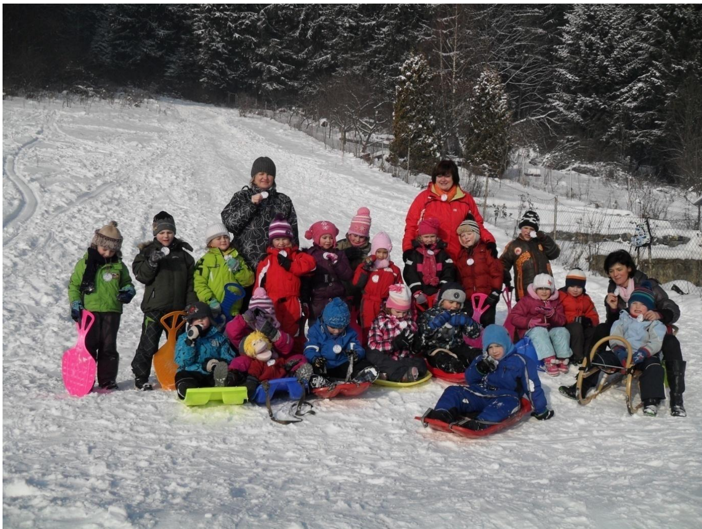
Adamkova zimná olympiáda