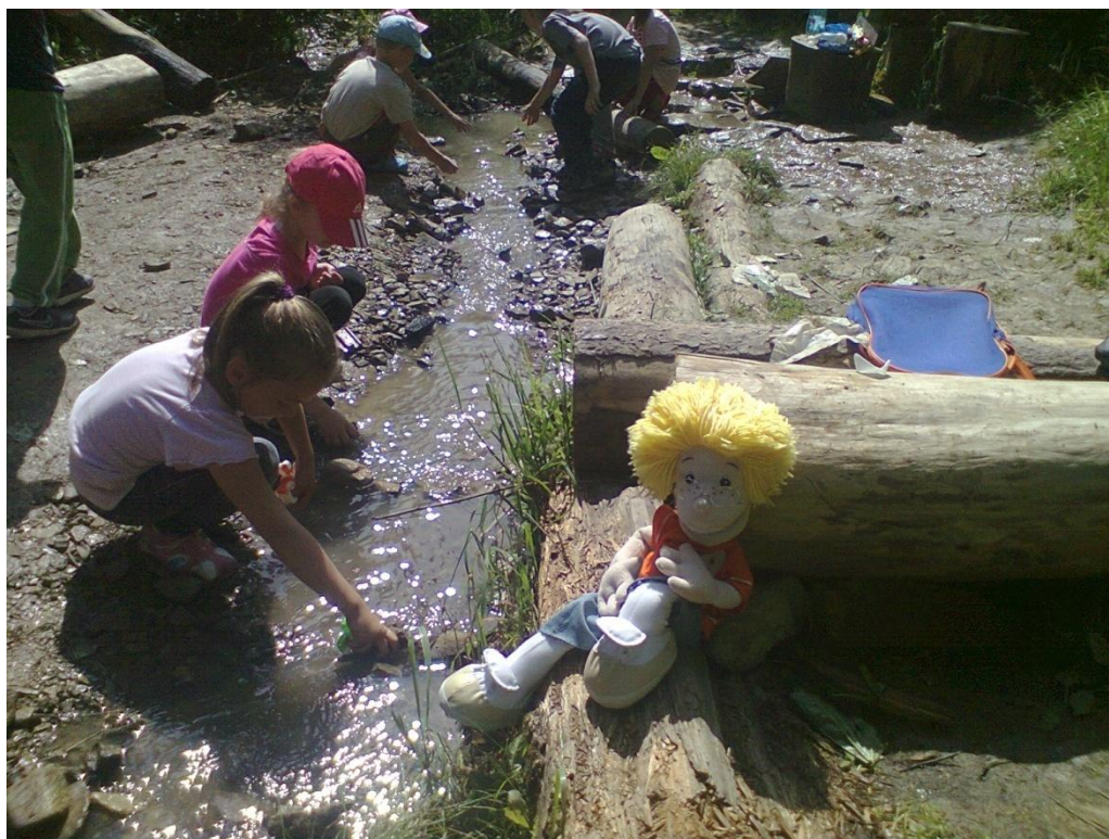
Turistická vychádzka k studničke