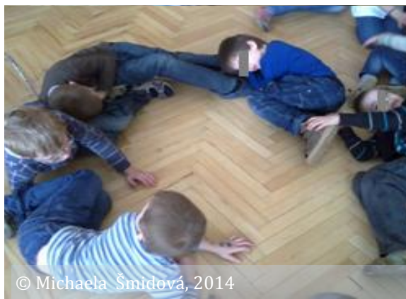
1/14 - ohľadupnosť (lezúca stonožka)