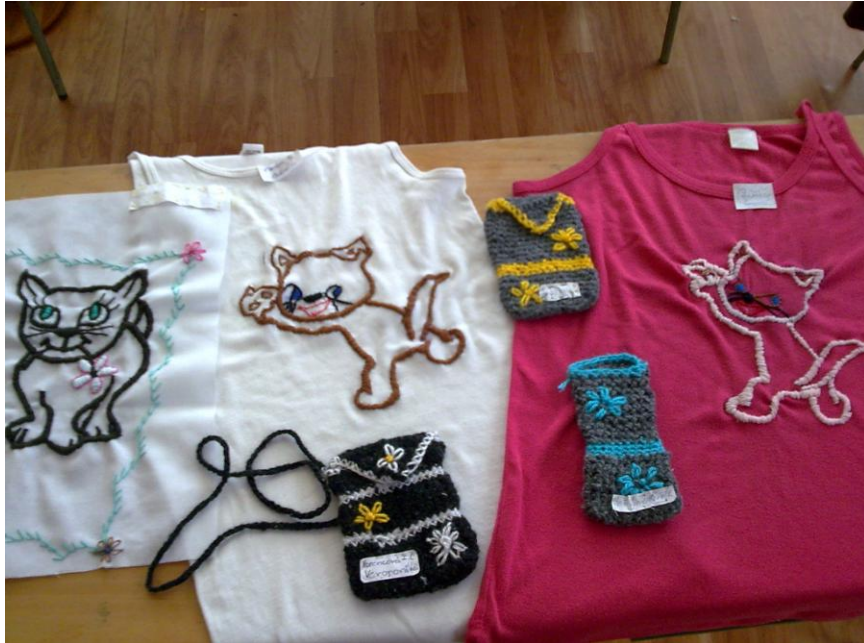
Obrázok 4 Tričko s aplikáciou