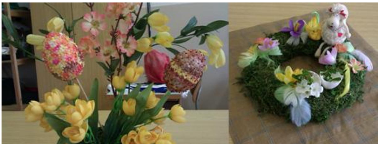
Obrázok 8 Veľkonočné dekorácie