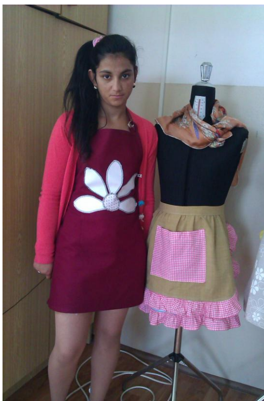
Obrázok 3 Zástera s volánom a vlastný návrh s aplikáciou

Ušitie celej zástery a tvorba technologického postupu boli v ich prípade rovnako časovo náročné.