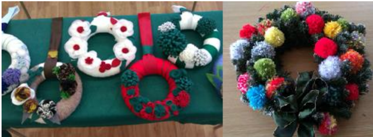
Obrázok 7 Vianočné dekorácie

Postup realizácie: Táto pracovná aktivita sa mi veľmi osvedčila. Žiaci našej školy sa každý rok zúčastňujú súťaže o najkrajší adventný veniec, ktorú organizuje CVČ. Príprava na túto súťaž začína už v októbri. Najprv si hľadáme inšpirácie na internete, potom pripravujeme materiál. Súčasťou prípravy je aj informácia o týchto sviatkoch, stručne história a hlavne tradície v rodine, tradičné jedlá, zvyky. Tie sú u žiačok veľmi silno zakorenené.