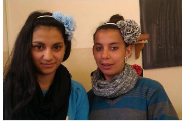
Obrázok 5 Čelenky s textilnými kvetmi