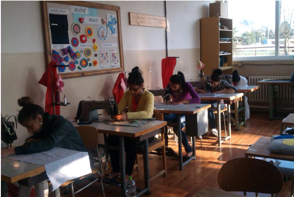
Obrázok 1 Žiačky v pracovnom nasadení

S ďalším problémom, s ktorým som sa stretla, bol materiál a jeho využitie. Keďže dnes sú textilné materiály cenovo náročné na cvičné práce sme sa naučili využívať rôzne, už použité látky a sami sme tomu dali názov „Zo starého nové“. Takže staré posteľné plachty sme prešili na utierky do kuchyne – precvičovali sme rovné šitie, zo starého obrusu vznikli zástery do kuchyne. Tu sme si nacvičili šitie volánu a nakladaného vrečka. Pre žiačky je dôležité, aby ich vydarené práce boli viditeľné aj v triede. Preto po každom pracovnom týždni vytvárajú nástenku so svojimi najlepšími prácami.