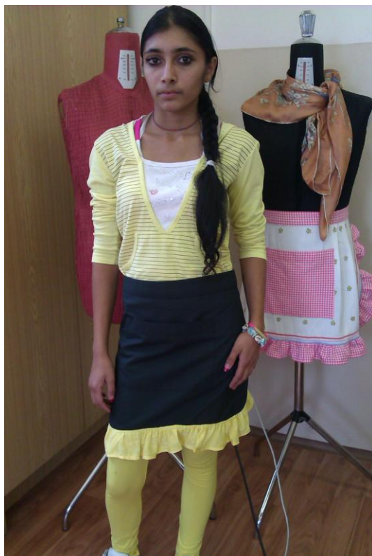
Obrázok 2 Zásterka s volánom

Predvedenie svojej práce viedlo k tomu, že žiačky sami vyhodnotili, ktorá zásterka bola najkrajšia a s pribúdajúcimi skúsenosťami vedeli aj popísať, aké chyby sa na výrobkoch vyskytli. Každá žiačka nahlas zhodnotila svoju prácu a popísala technologický postup pri šití.