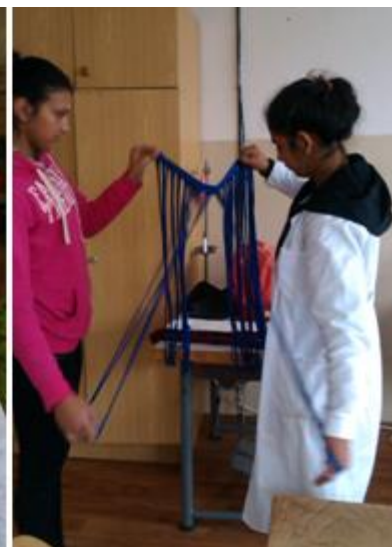
Obrázok 6 Špagátové šály a ich výroba.