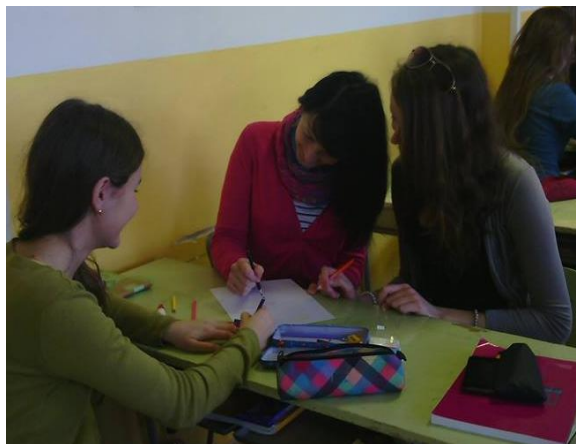
Obrázok 4 Skupinová práca

Odporúčanie pre prax: Práca v skupinkách žiakom vyhovovala v každom ohľade. Každý prezentoval svoje návrhy a z nich sa vybrali riešenia, ktoré boli podľa žiakov správne. Naučili sa pracovať v tíme, čo je v dnešnom pracovnom svete veľmi dôležité takmer na každej pracovnej pozícii. Ďalej sa naučili prezentovať svoje názory a obhájiť si ich pred ostatnými. V neposlednom rade si precvičili aj odborné termíny z oblasti manažmentu.