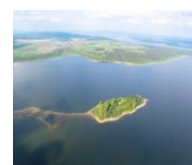
Obrázok 6 Oravská priehrada