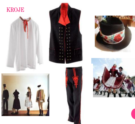
Obrázok 7 Oravské kroje