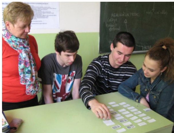
Obrázok 3 Pexeso