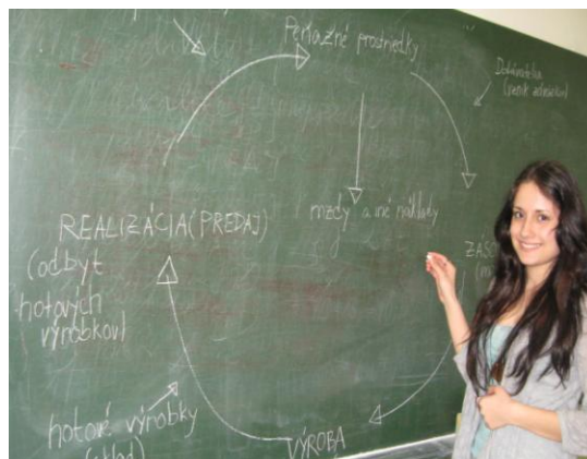
Obrázok 2 Kolobeh majetku podniku

Učiteľka: "Už sme si povedali, ako mení krátkodobý majetok svoju formu. Pokúste sa graficky znázorniť kolobeh majetku podniku".