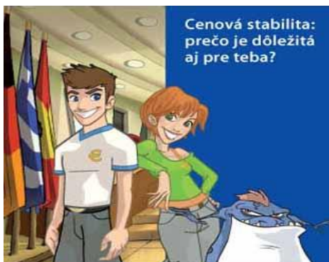
Obrázok 1 Cenová stabilita

http://www.ecb.europa.eu/ecb/educational/pricestab/html/index.sk.html