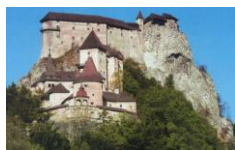
Obrázok 5 Oravský hrad