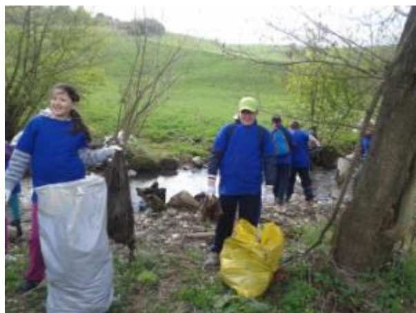
Obrázok 4,5 Zbieranie odpadkov v prírodných lokalitách