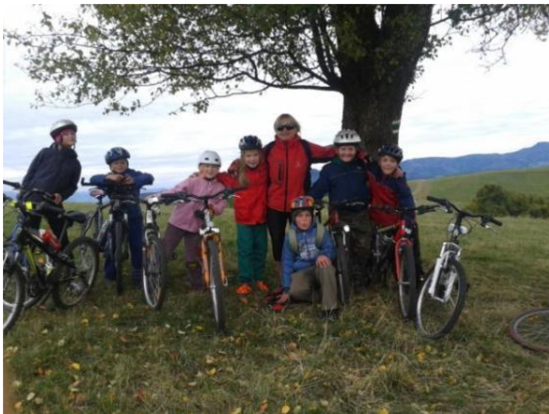
Príloha 3 Dotazník pre učiteľov