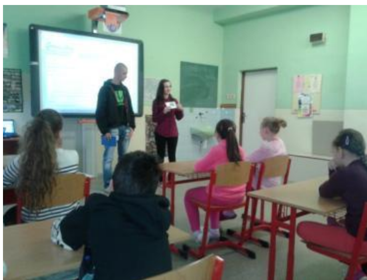
Obrázok 3 Deviataci učia štvrtákov

Pomôcky: interaktívna tabuľa, internet, výkresy, farby, štetce, rukavice, vrecia na odpadky, hrable