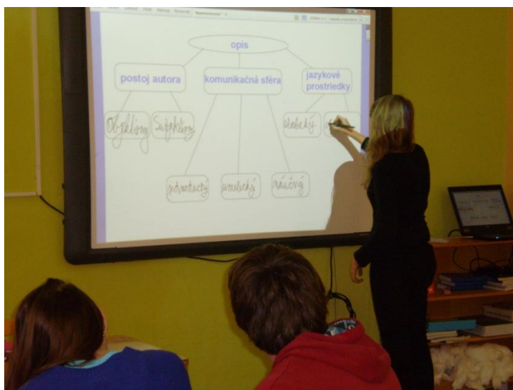
Obrázok 2 Interaktívna tabuľa PROMETHEAN Activboard

V našej škole používame interaktívnu tabuľu PROMETHEAN Activboard. Je to tabuľa s prednou projekciou, pevná, má interaktívny displej. Interaktívna tabuľa Activboard 300 (Obr. 2) je doplnená o softvér ActivInspire Profesional Edition, ktorý ponúka pracovať s interaktívnymi materiálmi. Umožňuje využívať rôzne médiá (video, obrázky, zvuky, odkazy), ktoré pomáhajú pracovať zaujímavo i dynamicky. [5]