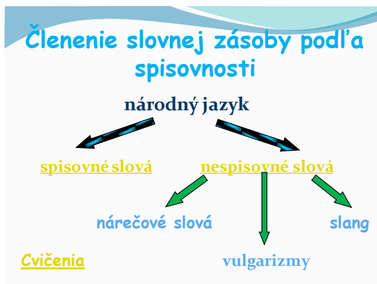
Obrázok 3 Ukážka snímky z prezentácie v PowerPointe

Ich použitie je obmedzené (súkromný rozhovor, zvada, slangový prejav...). Žiaci vedeli zaradiť k nespisovným slovám slang, vulgarizmy, nárečové slová.