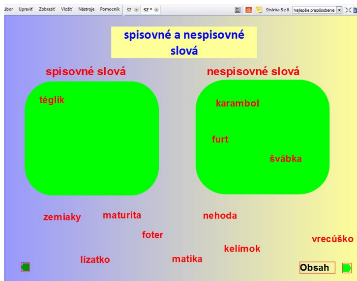
Obrázok 4 Ukážka cvičenia z interaktívnej tabule

len tie slová, ktoré tam patria. Často sa objavovali chyby pri slovách téglik, karambol, maturita, lízatko, kelímok, dokonca aj pri slove furt.