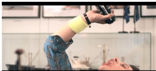
Obrázok 6 Party