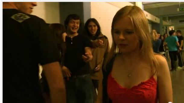
Obrázok 4 Mara

Na scénu nastupuje Jenny, ich spolužiačka, ktorá má ešte s Marou nevyrovnané účty. Využije situáciu a nahovorí Lauru na to, aby sa pomstila. Mara musí vedieť, aké to je, byť znemožnená pred celou školou. Samozrejme „kamarátka“ Jenny žiadne dobré pohnútky nemá, presvedčí Lauru, aby nafilmovala Maru nahú v sprche na mobil. Neskôr to Laura zavesí na sieť. Škandál je na svete, Mara je terčom posmechu celej školy. Film nemá moralizujúci záver, ostáva otvorený a ponúka možnosť na jeho ďalšie spracovanie na vyučovaní. Ja som ho okrem iného využila aj ako podnet pre diskusiu.