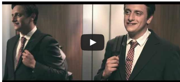
Obrázok 5 Vorstellungsgespräch