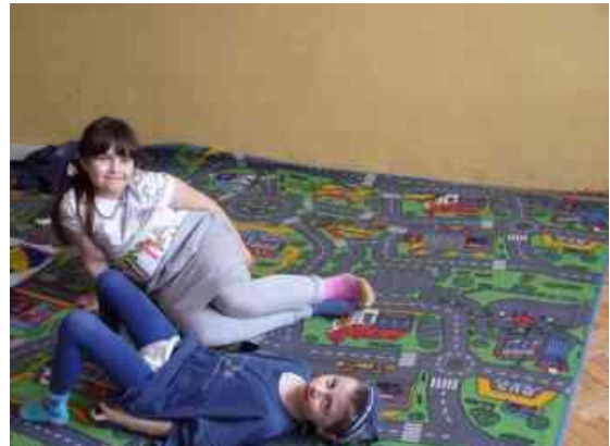
Obrázok 16 Apríl

Záver: Pochválila som žiakov aj učiteľov. Žiaci mali možnosť sledovať „učiteľov“ nie ako dominantný článok, ale ako seberovného. Ja som získala cenné poznatky z pozorovania „učiteľov“ – rôzne moje „zlozvyky“, časté frázy a tie činitele, ktoré si neuvedomujem pri vyučovaní, často maličkosti. Bola to veľmi dobrá spätná väzba, aby som sa vyvarovala prípadných chýb a nedostatkov. Žiakom sa vyučovanie veľmi páčilo. Deň sme ukončili „Čertovskou diskotékou“. Počas nej sme sa pokúšali nachytať sa navzájom na prvoaprílových vtipoch.