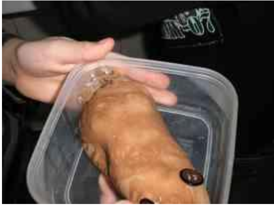
Obrázok 9 Ježko