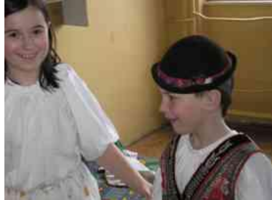
Obrázok 20 Kroj