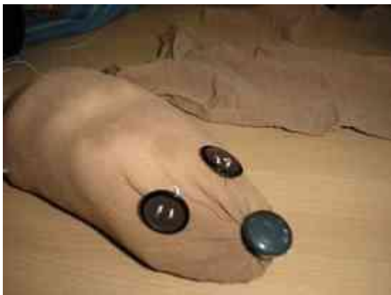
Obrázok 11 Ježko