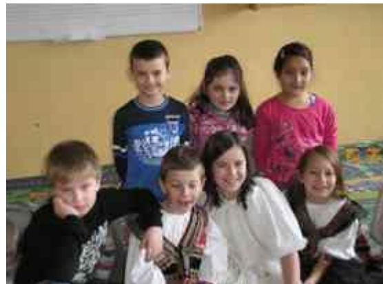
Obrázok 22 Kroj

Úloha: V závere som deťom zadala problémovú úlohu. Na danú melódiu (jednoduchý nápev) mali napísať riekanku (text). Prezentácia bola mimoriadne zábavná a príjemne ukončila naše putovanie hudobnou cestou poznávania ľudových tradícií.