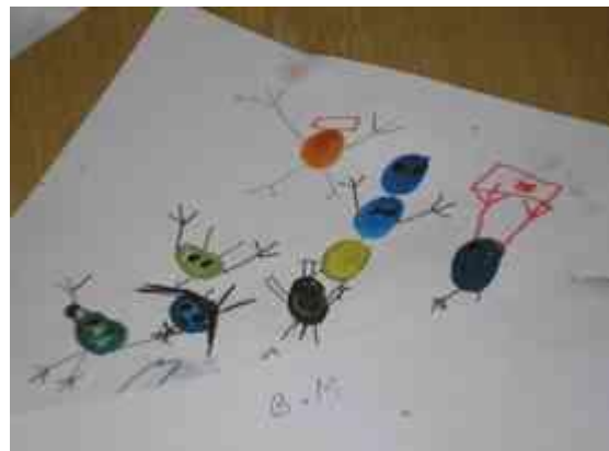
Obrázok 4 Spontánna tvorba

Záver: Vo výsledných dielach hľadáme tvary, obrazce, čo nám niečo pripomínajú.