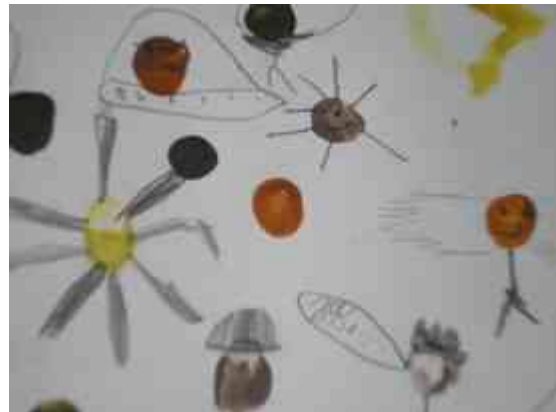
Obrázok 2 Spontánna tvorba