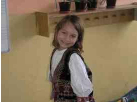
Obrázok 19 Kroj

Ciel': Cieľom je zvládnuť nácvik tanca. Pre porovnanie sa deti rozdelia do dvoch skupín. Prvá skupina tancuje ľudové tance, druhá skupina moderné tance. Tento projekt nám oživila babka našej žiačky, ktorá k nám prišla na besedu. Pre deti bolo prekvapenie, že naša babka prišla v kroji. Porozprávala nám o zvykoch na Veľkú noc. Bolo zaujímavé sledovať ako sa žiaci zapájali do jednotlivých aktivít, s nadšením pracovali na jednotlivých úlohách.