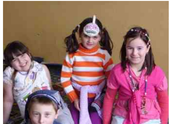
Obrázok 14 Apríl