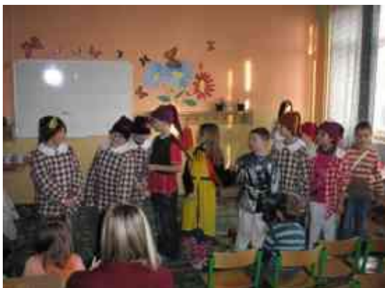
Obrázok 25 Snehulienka