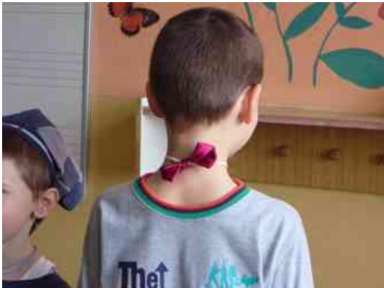
Obrázok 15 Apríl