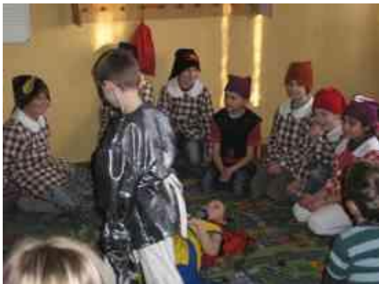
Obrázok 23 Snehulienka

Príprava: Príprava na tento deň bolo časovo náročná. Spolu s deťmi sme napísali scenár. Pripravili sme kostýmy a scénu. Deň vopred sme triedu vyzdobili vlastnoručne vyrobenými papierovými snežienkami, narcismi a tulipánmi. Mamičkám sme prichystali chlebíčky. Uvarili sme veľikánsky hrniec bylinkovo - ovocného čaju a mamičky mohli prísť.