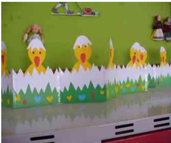
Obrázok 5 Veľká noc