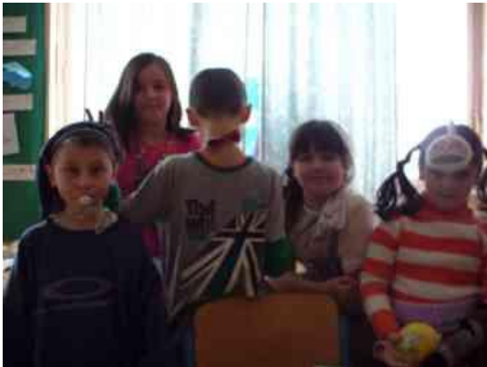
Obrázok 13 Apríl

pomohla. Nezasahovala som priamo do výučby, ale diskkrétne poradila, pošepkala. Atmosféra bola veľmi príjemná, uvoľnená a veselá.