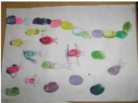
Obrázok 3 Spontánna tvorba