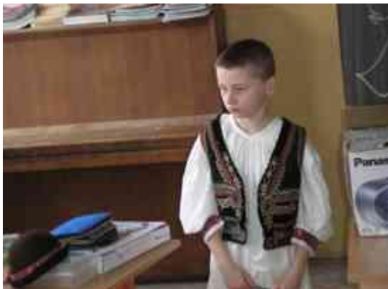
Obrázok 21 Kroj