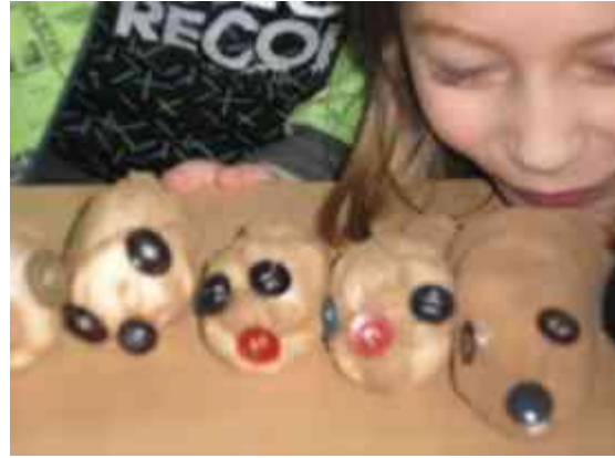
Obrázok 10 Ježko