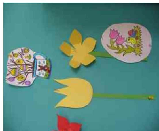
Obrázok 8 Veľká noc