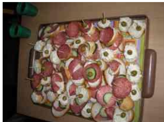
Obrázok 26 Snehulienka

Poznámka: Každé dieťa pripravilo svojej mamičke vlastnoručne obložený chlebík a prestrelo na stôl. Každý si svojich hostí privítal a usadil.