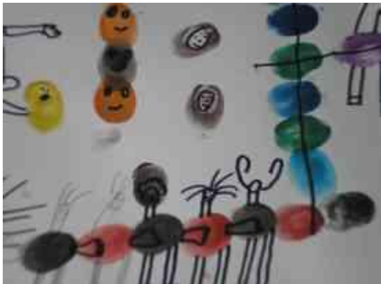
Obrázok 1 Spontánna tvorba

Postup: Žiakom pripravíme rôzne materiály a farby, ale výber necháme na nich. Pomôcky sú pripravené na laviciach. Žiaci si môžu vyberať podľa záujmu. Počas práce deti neusmerňujeme, neradíme, len povzbudzujeme a chválime.