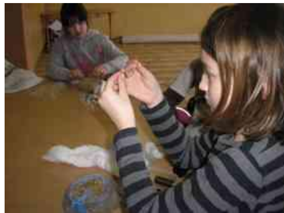
Obrázok 12 Ježko

Záver: Cieľom je podnietiť záujem žiakov, aby sa ich zručnosti efektívne rozvíjali. Samostatne vedeli riešiť úlohy.