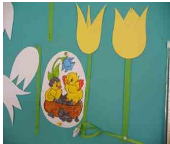
Obrázok 6 Veľká noc