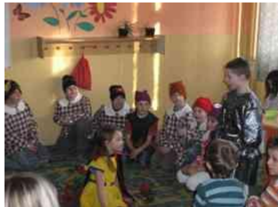
Obrázok 24 Snehulienka