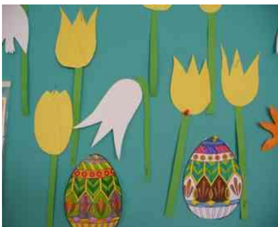
Obrázok 7 Veľká noc