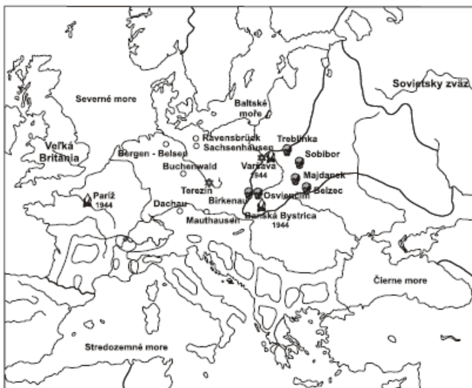
Obrázok 17 Obrysová mapa