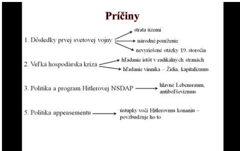
Obrázok 2: Príčiny druhej svetovej vojny

Etapy druhej svetovej vojny: Počas tejto časti sme vysvetľovali udalosti, ktorými historici rozdelili druhú svetovú vojnu do etáp. Žiaci ich videli na obrazovke, takže stačilo len jednoducho vysvetliť danú udalosť a prečo sa považuje za medzník (obrázok 3). Tiež sme stručne opísali danú fázu.