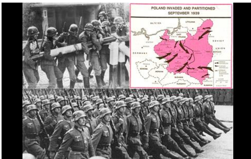
Obrázok 11: Obrázky a fotky

Pri vysvetľovaní pojmu čudná vojna sme sa opýtali, čo si myslia prečo západné mocnosti skutočne nebojovali, a či to bolo výraznou taktickou chybou. Odpovede boli rôzne a žiaci dospeli k tomu, že Nemecko by pravdepodobne nezvládlo nápor z dvoch strán. Tu sa ukázalo výborné historicko-vojenské povedomie žiaka.