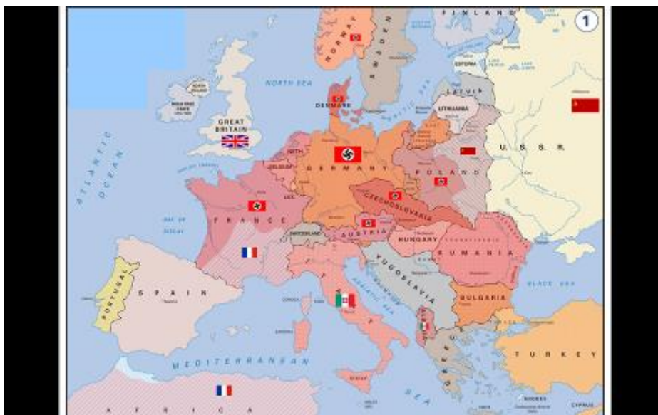
Obrázok 14: Obsadenie západu