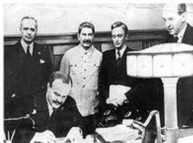
Obrázok5: Pakt o neútočení

↓ dohoda o rozdelení sfér vplyvu medzi Nemeckom a ZSSR v Pobaltí, Fínsku, Poľsku a Rumunsku