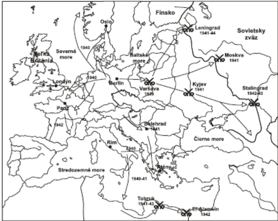
Obrázok 16 Obrysová mapa