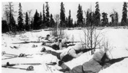
Obrázok 12: Zimná vojna