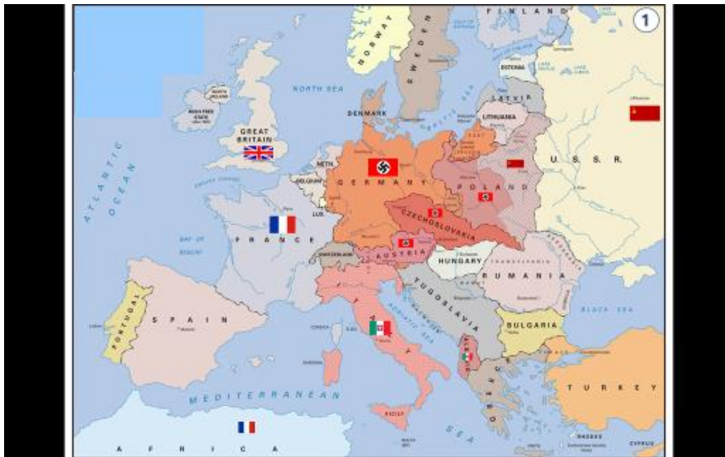
Obrázok 10: Postup Nemcov a Sovietov v Poľsku