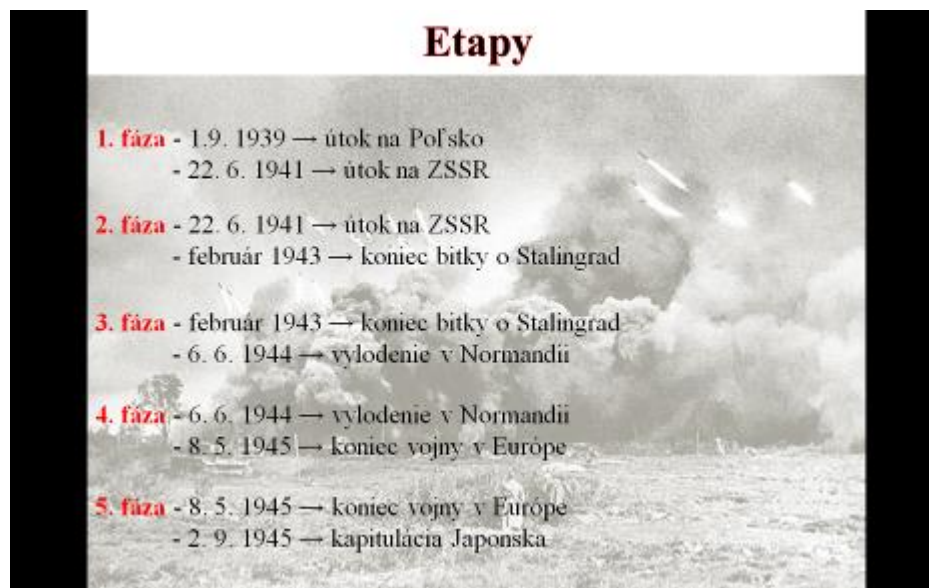
Obrázok 3: Etapy druhej svetovej vojny

Etapy druhej svetovej vojny: Počas tejto časti sme vysvetľovali udalosti, ktorými historici rozdelili druhú svetovú vojnu do etáp. Žiaci ich videli na obrazovke, takže stačilo len jednoducho vysvetliť danú udalosť a prečo sa považuje za medzník (obrázok 3). Tiež sme stručne opísali danú fázu.