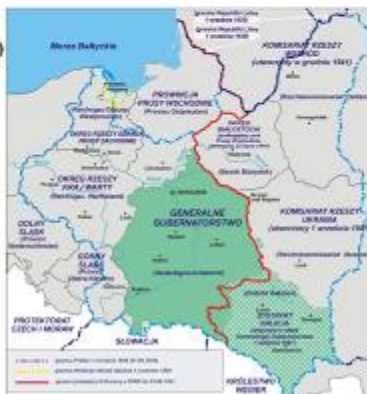
Obrázok 9: Rozdelenie Poľska