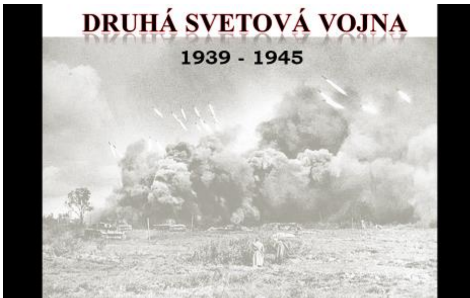
Obrázok 1: Druhá svetová vojna