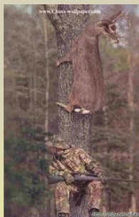
Obrázok 3 Ukážka č. 2 k 6. úlohe