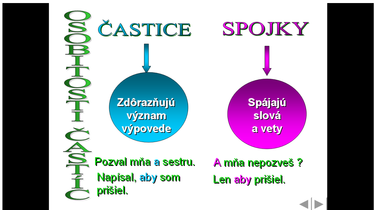
Obrázok 5 Osobitosti častíc

Snímka 3 - Na tejto snímke si žiaci osvojili osobitosti častíc a spojok. Práve tieto slovné druhy robia žiakom často problémy pri začlenení rovnako znejúceho slova k slovnému druhu .