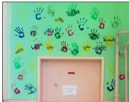
Obrázok 8 Autogramy

Práci na tomto projekte bola opäť dôkazom toho, že učiteľ ako osobnosť má obrovský vplyv na motiváciu žiaka. Nielen tým, čo hovorí, ale najmä svojím presvedčením, zainteresovanosťou a priamosťou. Žiaci veľmi rýchlo vycítia neúprimnosť a pretváрку a potom sa to odrazí na ich motivácii a prístupe k práci. A to platí dvojnásobne pri výchovných predmetoch. Pre učiteľa je prínos projektov aj v tom, že má možnosť dostať sa k žiakom istým spôsobom bližšie a spoznať lepšie ich vlastnosti, nakoľko sa venujú dlhú dobu jednej veci a každý deň prichádzajú s inou náladou a v inom psychickom rozpoložení. Môže zistiť, ako sa vedú vyrovnávať s tlakom zvonka (časovým, náročnosťou a očakávaniami okolia). Prácu žiakov učiteľ hodnotil slovnou po častiach – nielen vždy po skončení niektorej maľby, ale aj počas práce. V praxi často učiteľ musí hľadať nejaké pozitívum práce žiaka, aby ho bol schopný motivovať k ďalšej činnosti a k dokončeniu