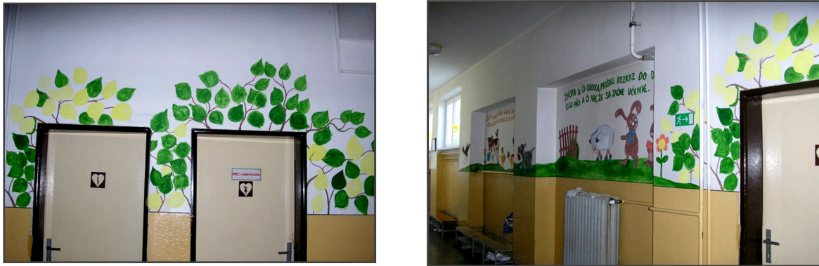
Obrázok 3, 4 Chodba 1.-4.

Táto časť žiakov unavovala – pravdepodobne kvôli svojej monotónnosti a modro-bielej kombinácii farieb. No napriek tomu, žiaci maľbu dokončili a rozmiestňovaniu obrazov na stenách a ich vešaní sa venovali všetci – každý radil, meral.