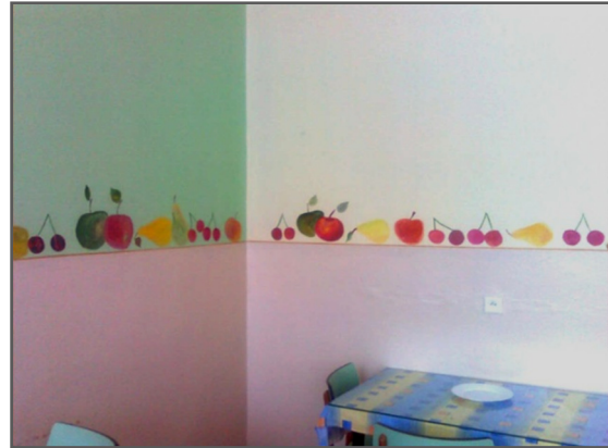
Obrázok 5, 6 Jedáleň