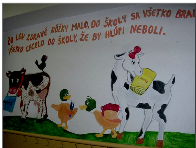
Obrázok 9 Ilustrácia básne L. Podjavorinskej

Keď sa zhrnú zistenia z hodnotení žiakov, vytvorí sa o triede istý obraz a po prečítaní hodnotení si dokáže na základe týchto dotazníkov o triede názor vytvoriť hocikto. Aj z odpovedí v anonymných hodnotiacich listoch vyplýva, že žiaci sú harmonicky pôsobiaci kolektív, výborne sa s nimi spolupracuje, vedia spolupracovať v skupinách, no majú v triede žiaka, ktorý má problém začleniť sa do society triedy a zrejme práve preto na všetky otázky v hodnotiacom liste odpovedal negatívne.