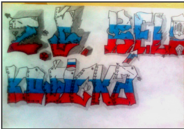
Obrázok 1 Vstupná chodba

Chlapcom dávali dievčatá za úlohu maľovať rôzne jednoduchšie veci – listy, trávu, ony si rozdelili prácu na zvieratách. Toto rozhodnutie žiakov učiteľ rešpektoval, nakoľko všetci žiaci na projekte pracovali. Časový rozvrh práce sa nepodarilo naplniť podľa plánu, žiaci potrebovali na dokončenie štyri hodiny namiesto dvoch. Keďže maľba vyžadovala ešte čas navyše, niekoľkí žiaci zostali v čase mimo vyučovania po obedňajšej prestávke a maľba bola dokončená.