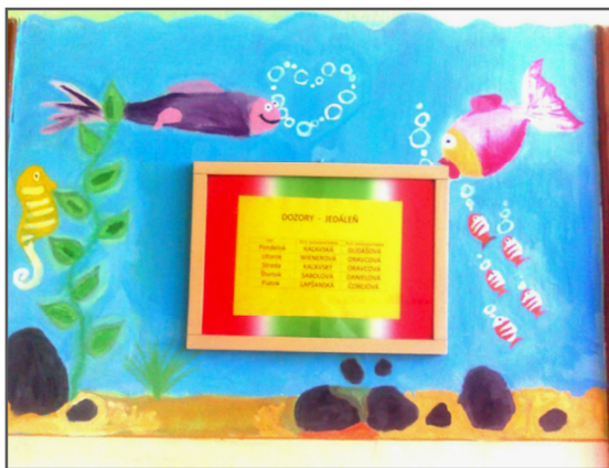
Obrázok 7 Akvárium