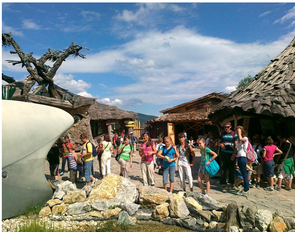
Naši výletníci v rozprávkovej dedinke Habakuky na Donovaloch