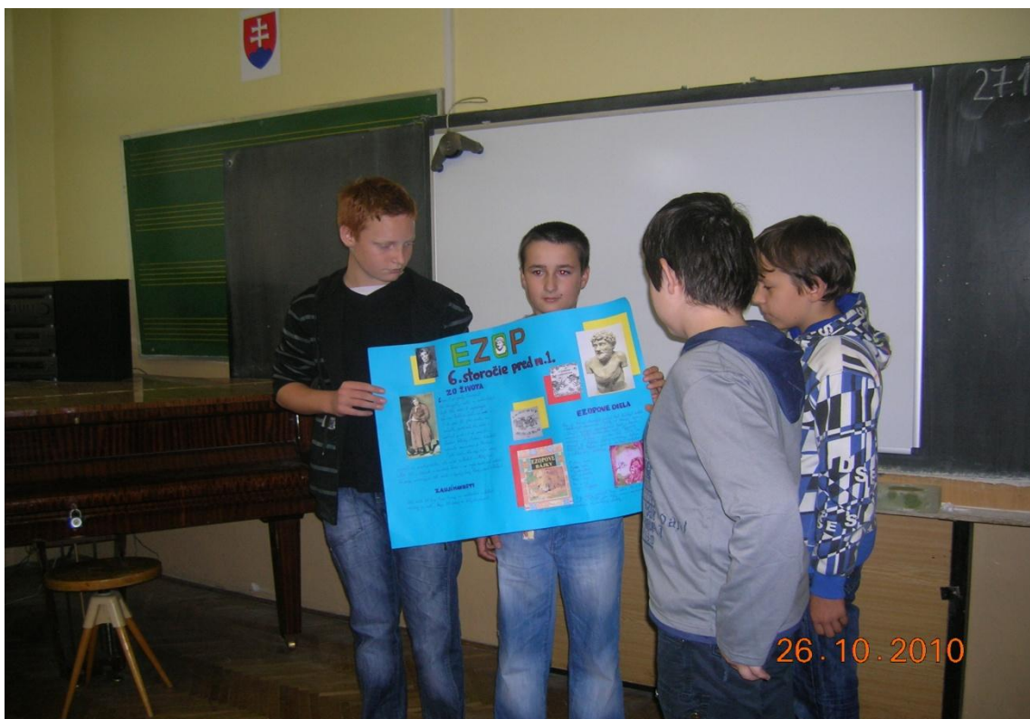
A toto sú naši chlapci šiestaci a ich Ezop