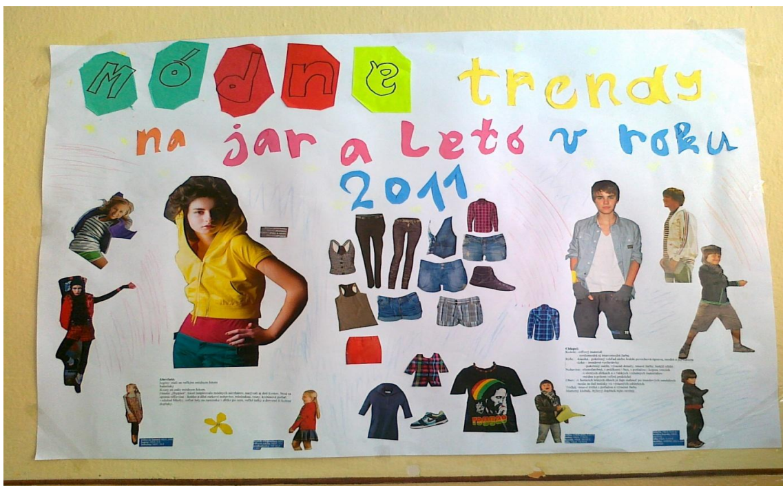
Jeden z výstupov tvorivej dielne – plagát Módne trendy