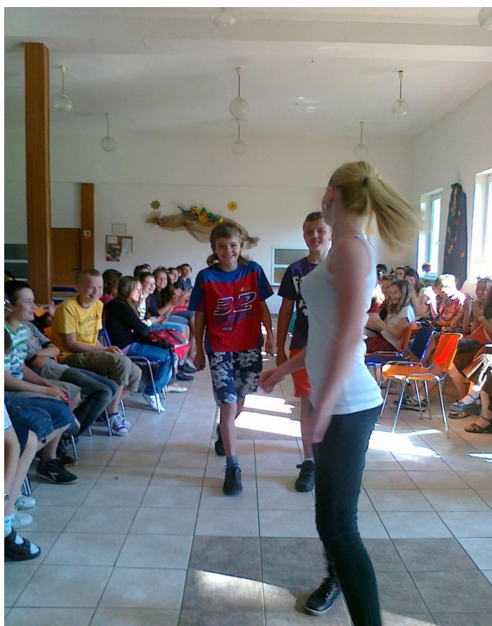
Na móle bolo naozaj veselo