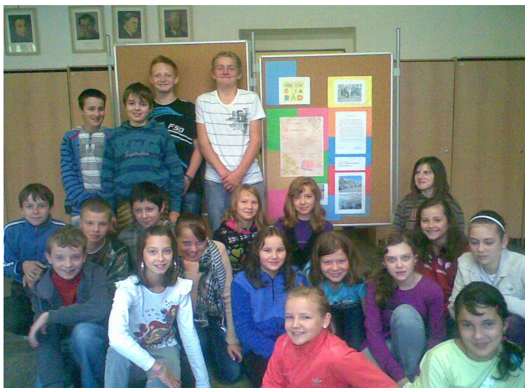
Posledný okamih z aktivity našich šiestakov