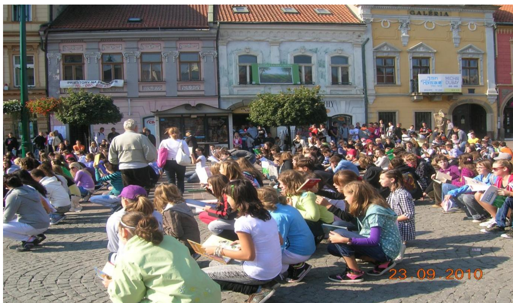
Naši žiaci v meste Prešov nacvičujú Čitariádu.