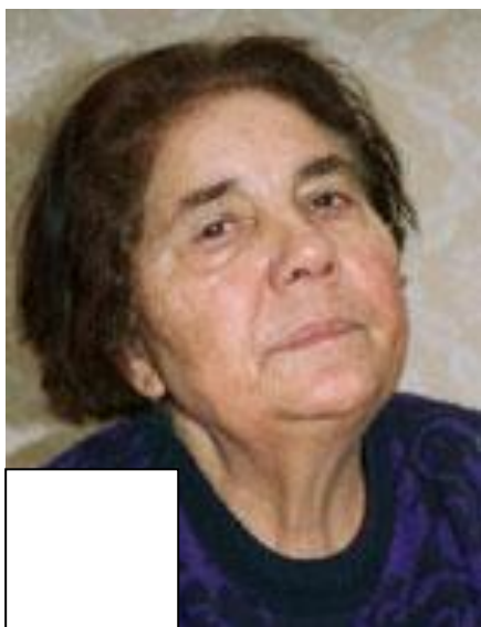
Elena Lacková spisovateľka