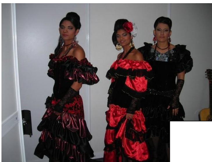
Sabrosa hudobná skupina