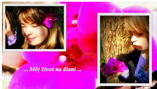
Obrázok 1 Sociálna integrácia

„Smieme byť takí, akými sme – avšak takí, aby sme vedeli žiť so sebou samými, s druhými ľuďmi bez toho, aby sme ubližovali, poškodzovali atď. a naďalej zostali súčasťou spoločnosti, ktorá žije v súlade s prírodou“ (Prucha, 2009a).