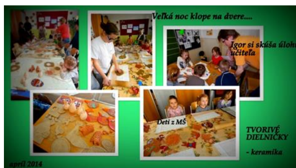
Obrázok 10,11 Tvorivé dielničky