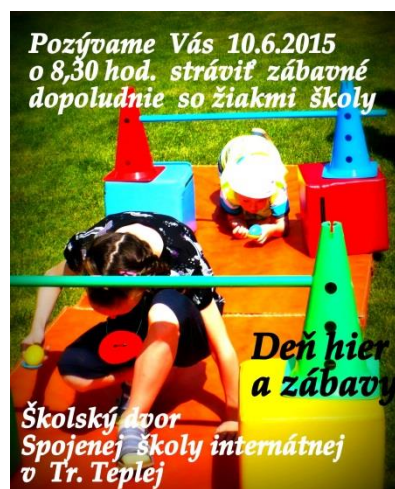
Obrázok 14 Pozvánka

Deti MŠ a žiaci školy sa opäť stretli začiatkom júna na Dni hier a zábavy, ktorý SŠI organizovala v priestoroch školského dvora.