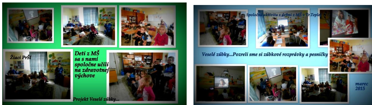
Obrázok 12,13 Rozumová výchova

V marci a apríli 2015 sa zúčastňovali vzdelávacieho projektu „Veselé zúbky“, ktorý organizuje DM drogéria. Žiaci PrŠI a malí škôlkari sa veľa dozvedeli o starostlivosti o chrup. Stretávali sa raz do týždňa - na hodine veselých zúbkov. Prichádzali do PrŠI na vyučovací predmet zdravotná výchova. Aktivity realizované z projektu „Veselé zúbky“, sme poslali do súťaže, ktorú organizuje DM drogéria. Zároveň bola aktivita realizovaná počas metodického dňa Integrácia na dlani. Počas krátkeho vstupu videli špeciálni pedagógovia z trenčianskeho regiónu spoločné vyučovanie detí MŠ a žiakov praktickej školy z tretieho ročníka. Predviedli starostlivosť o chrup, vytvorili postavičku Zubožrúta (Príloha 3).