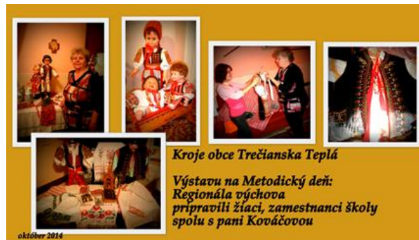
Obrázok 2,3,4 Kroje obce Trenčianska Teplá