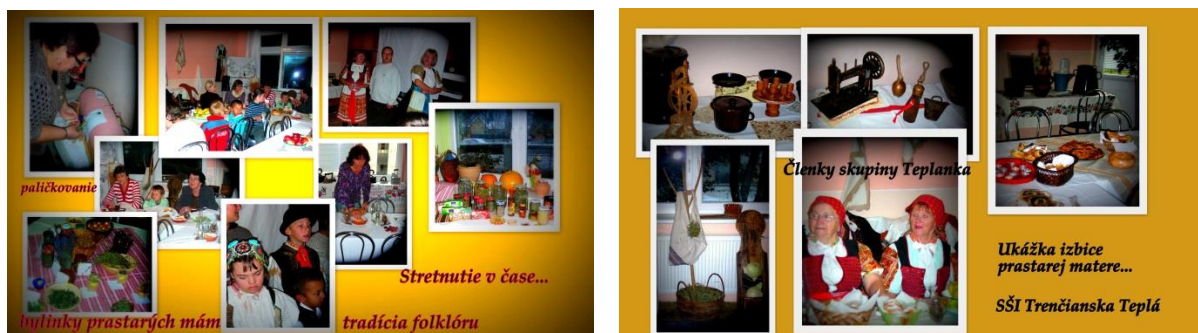
Obrázok 6,7 Izbica prastarej matere