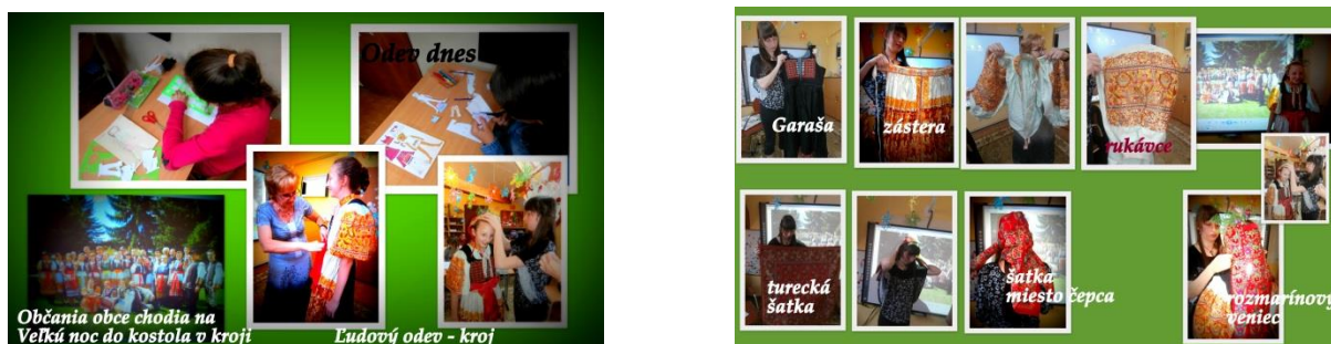
Obrázok 8,9 Ukážka vyučovacej hodiny - Ľudový odev - kroj