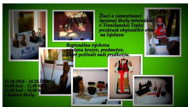
Obrázok 5 Pozvánka na výstavu: Regionálna výchova

súboru Teplanka, Obecného úradu v Trenčianskej Teplej môžu počas metodického dňa učiť, robiť ukážky a aktivity v krojoch obce. Vážime si spoluprácu obce pri realizácii akcie.