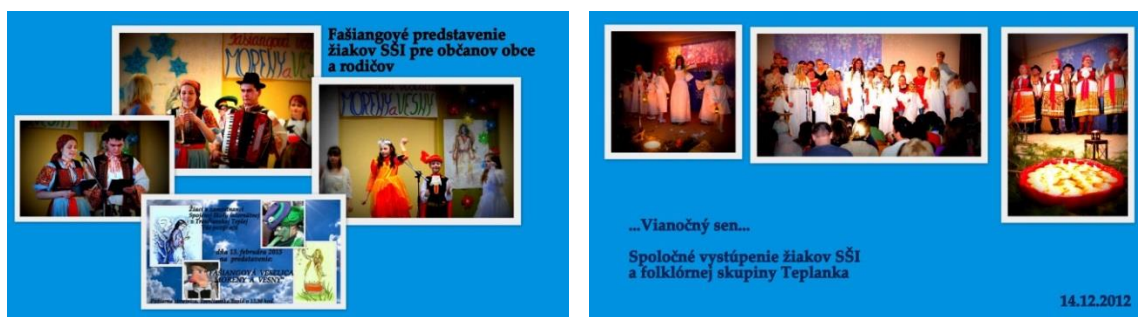
Obrázok 15,16 Kultúrne predstavenia – Fašiangy, Vianoce