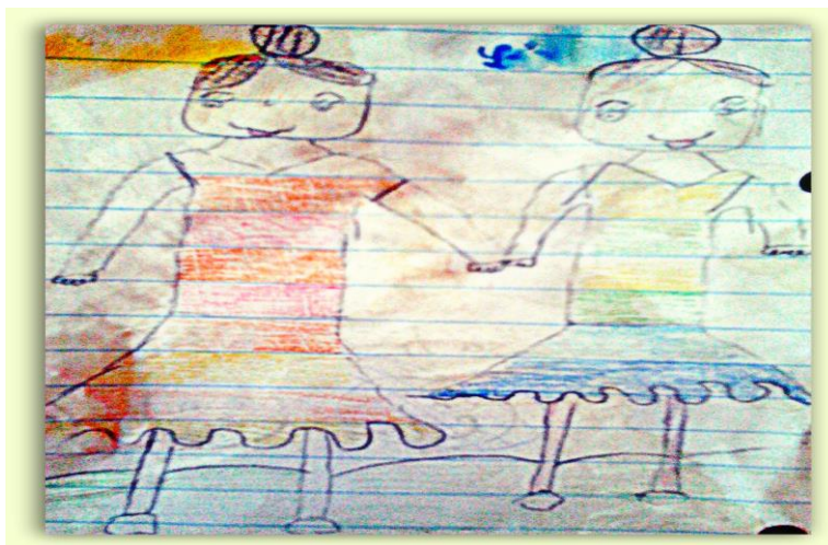
Obrázok 3 Funkčné systémy