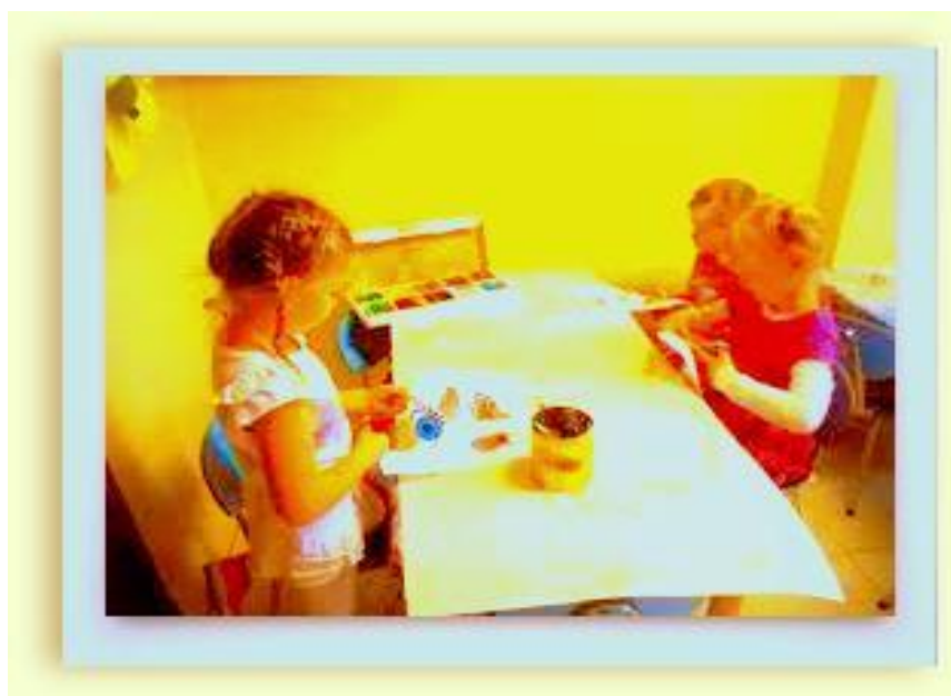
Obrázok 2 Spoznávaj ma