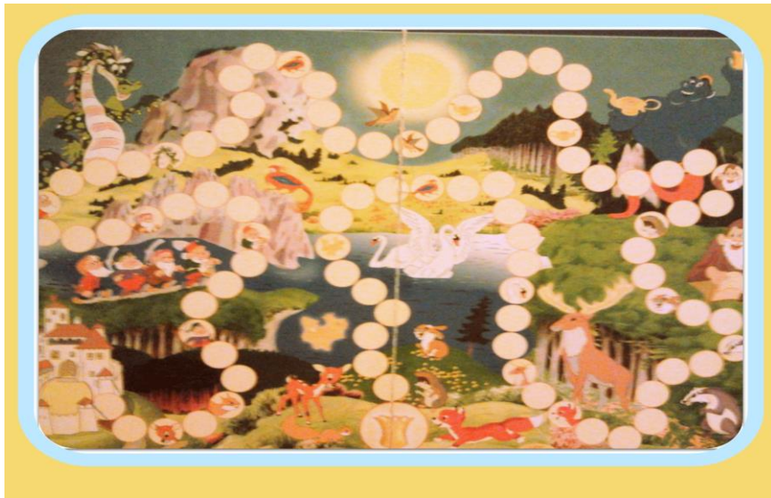
Obrázok 1 Rozprávková mapa