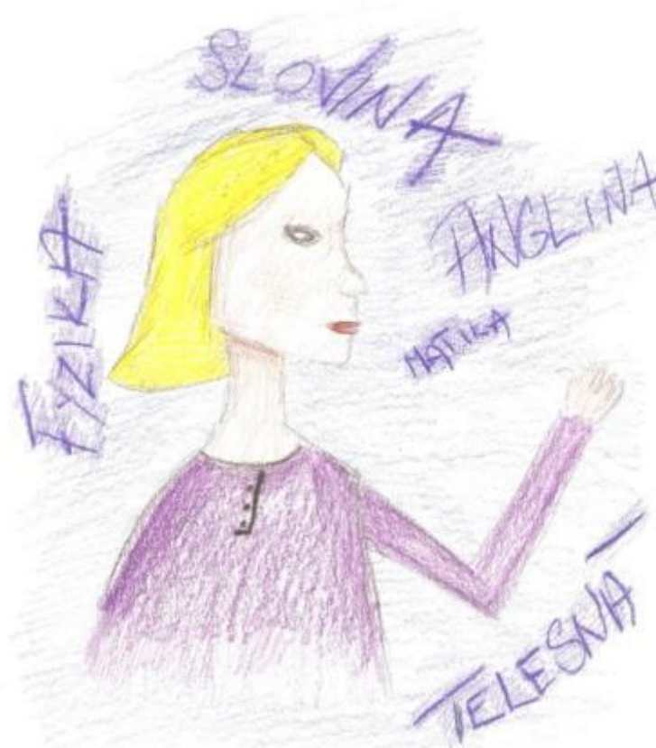
Obrázok 10, Múdra Šárka