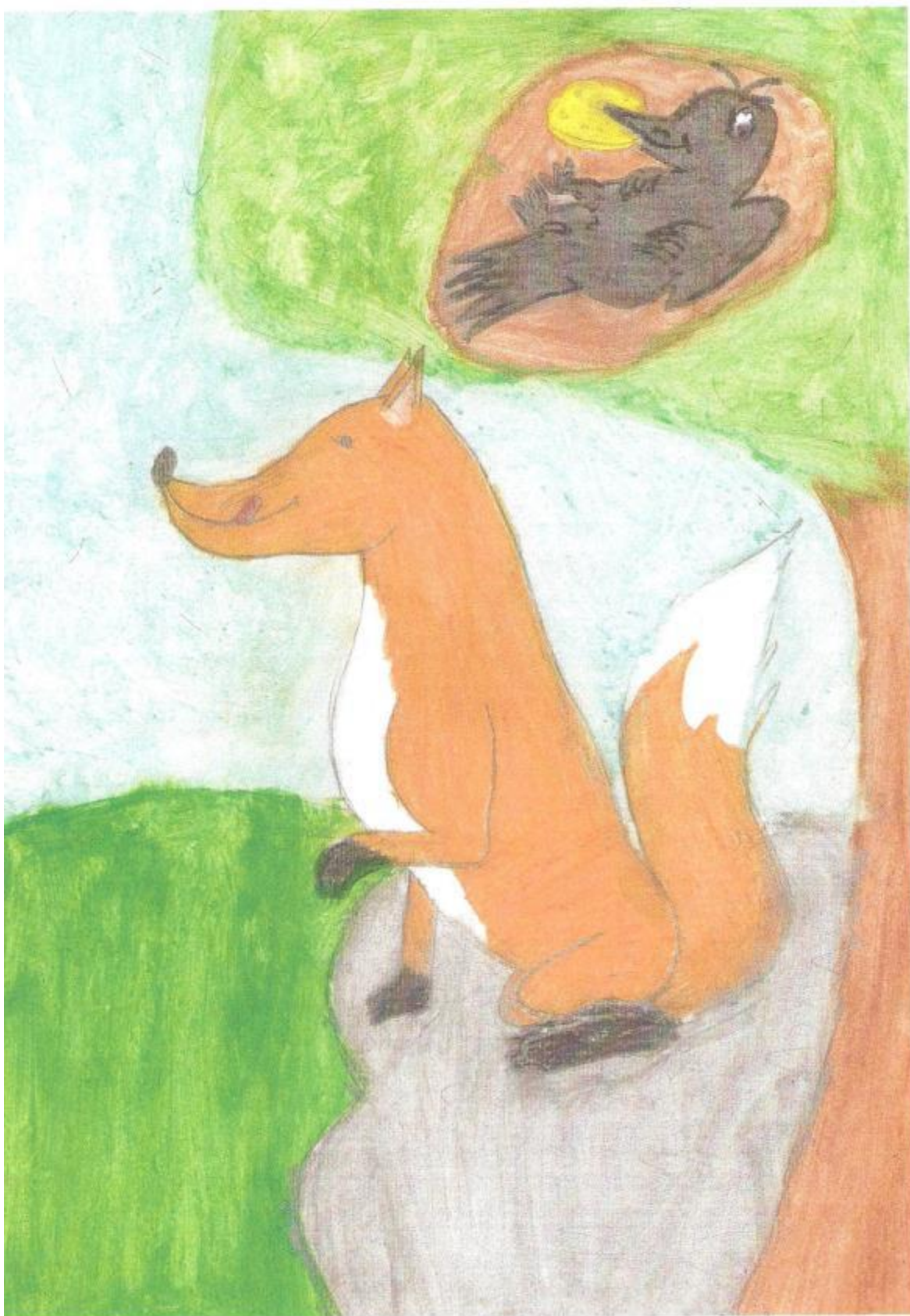
Obrázok 5, Nenásytná líška – ilustrácia