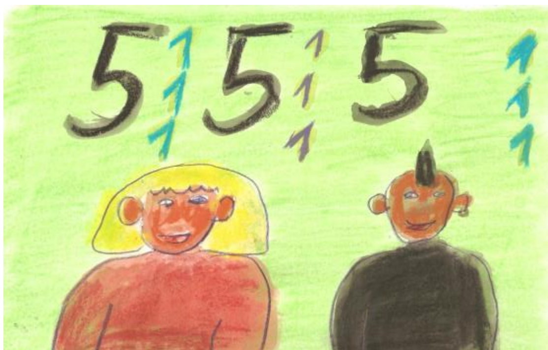
Obrázok 11, Spolužiaci