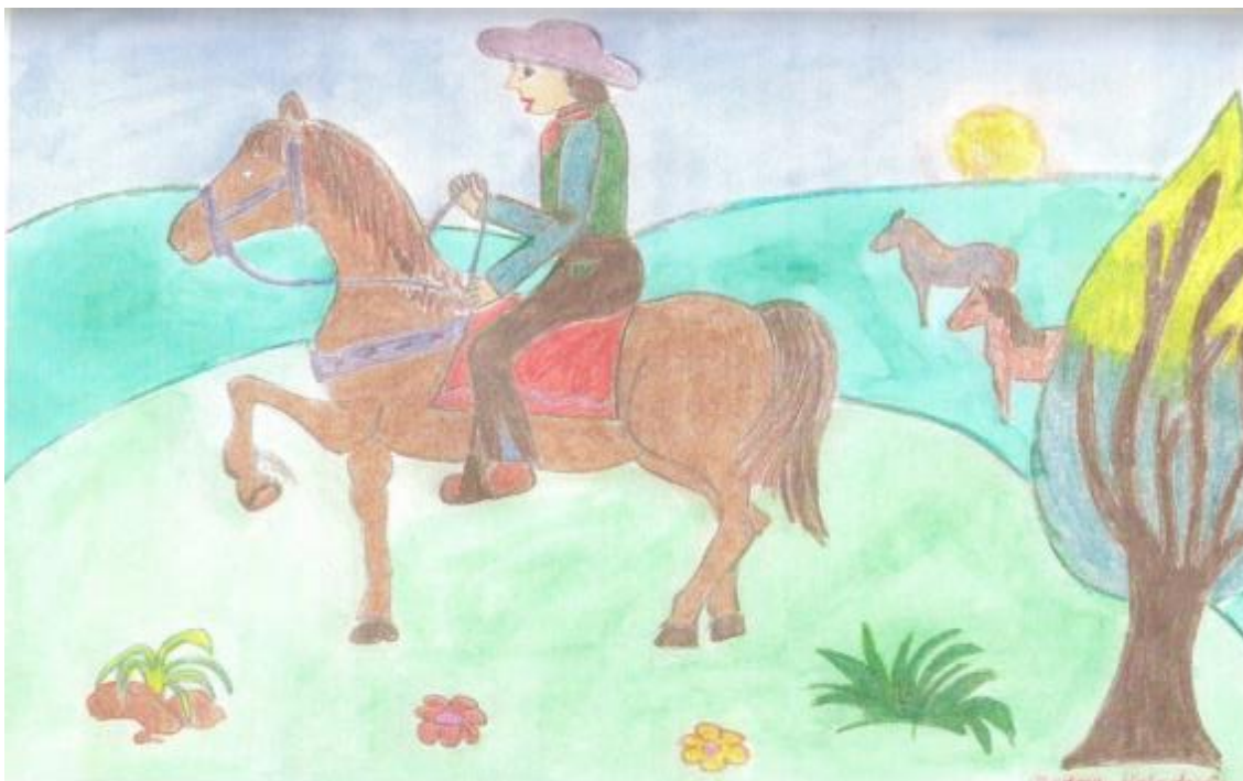
Obrázok 1, Veterný kôň - ilustrácia