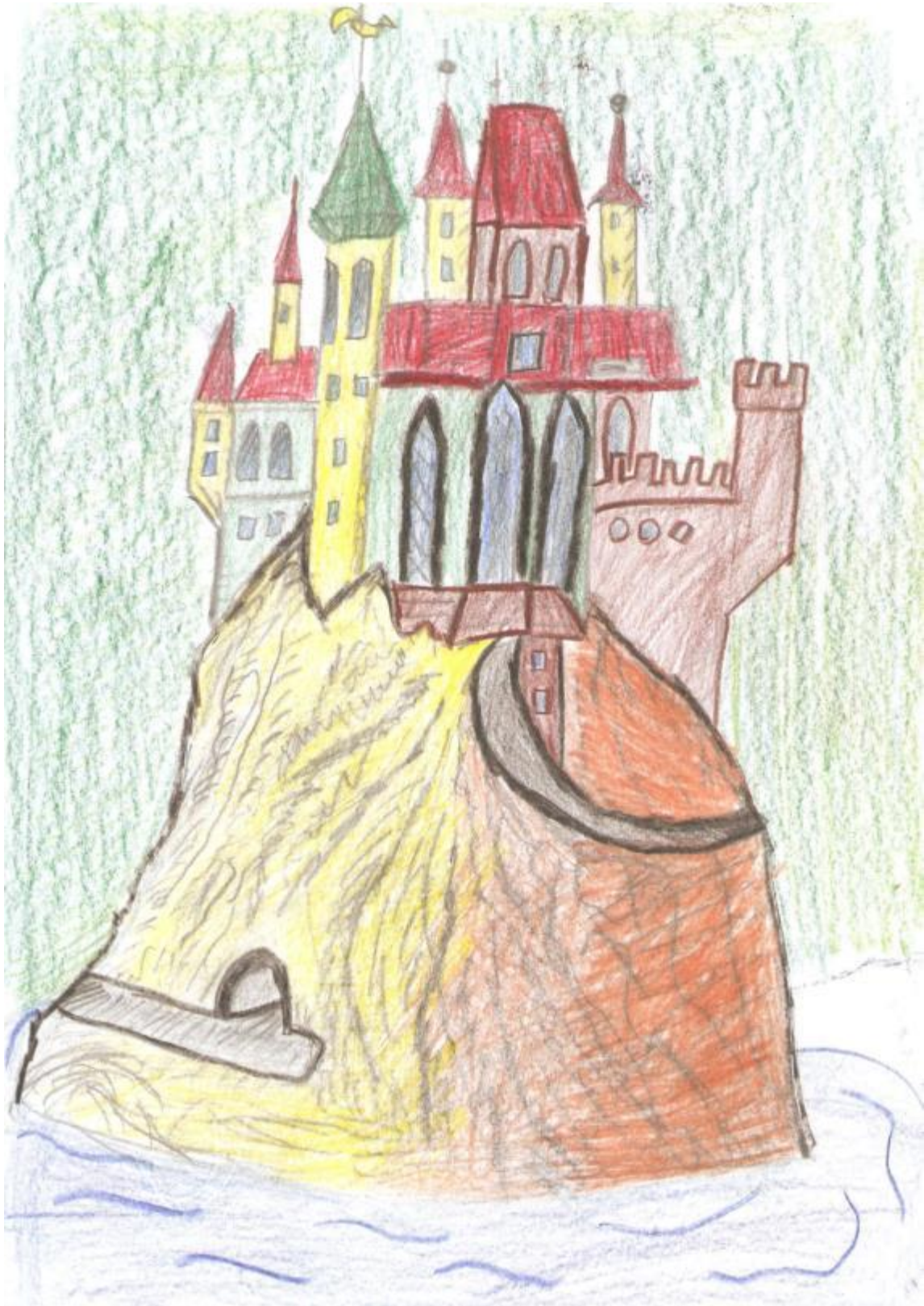
Obrázok 3, Veterný zámok – ilustrácia