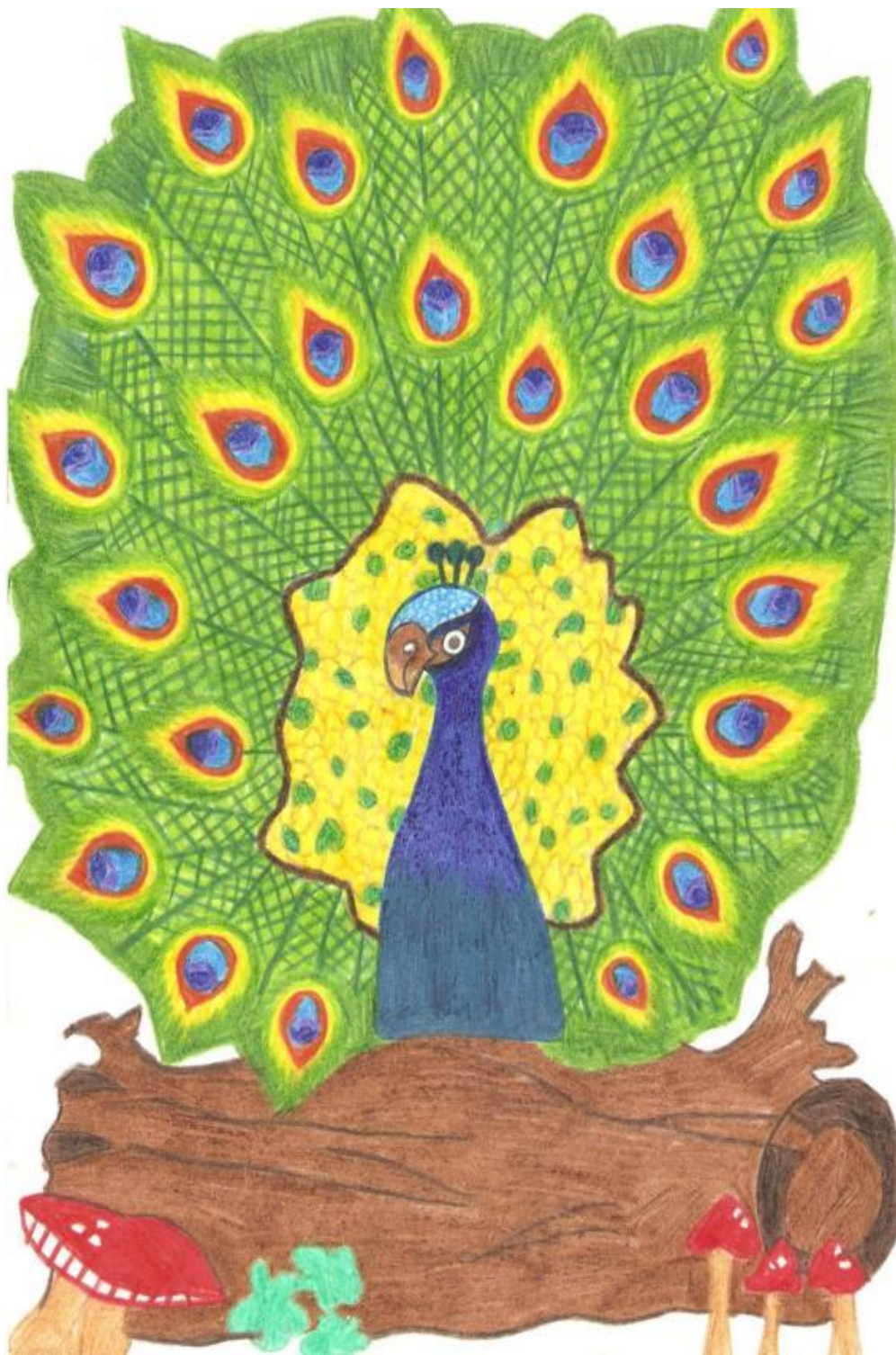
Obrázok 12, Parádnica