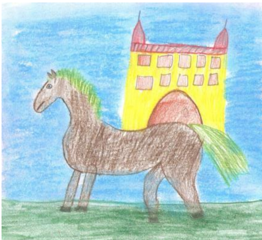
Obrázok 2, Rozprávkový kôň - ilustrácia