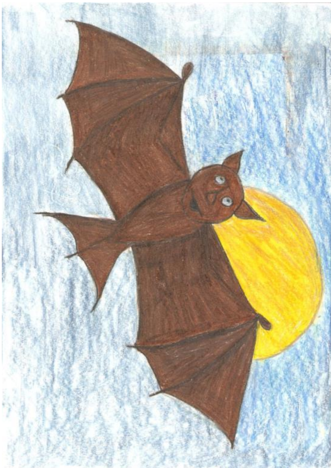
Obrázok 8, Zradca