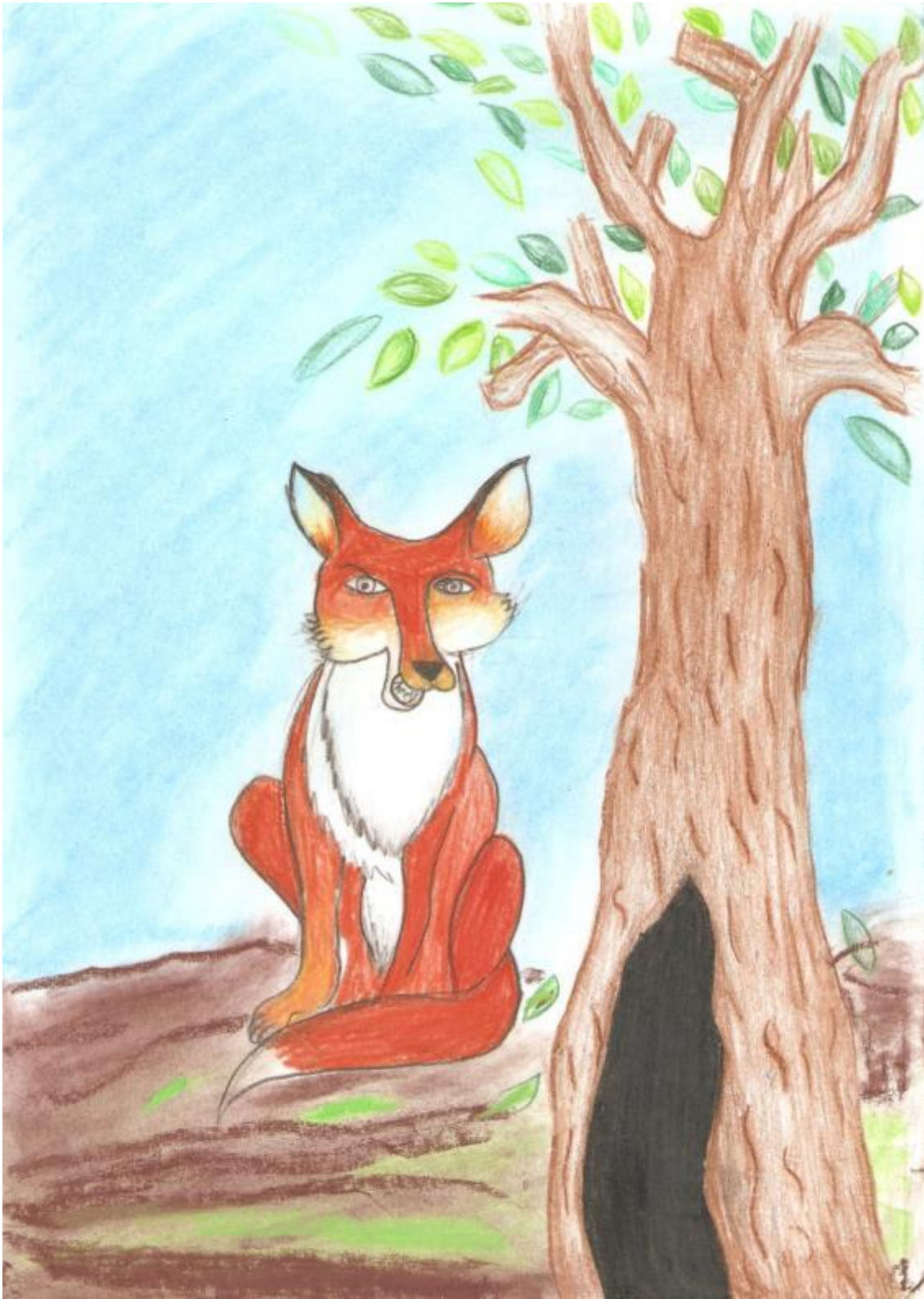
Obrázok 4, Prefíkaná líška – ilustrácia