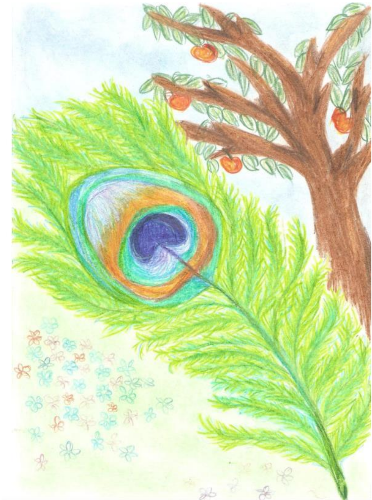
Obrázok 13, Začarovaná jablonka