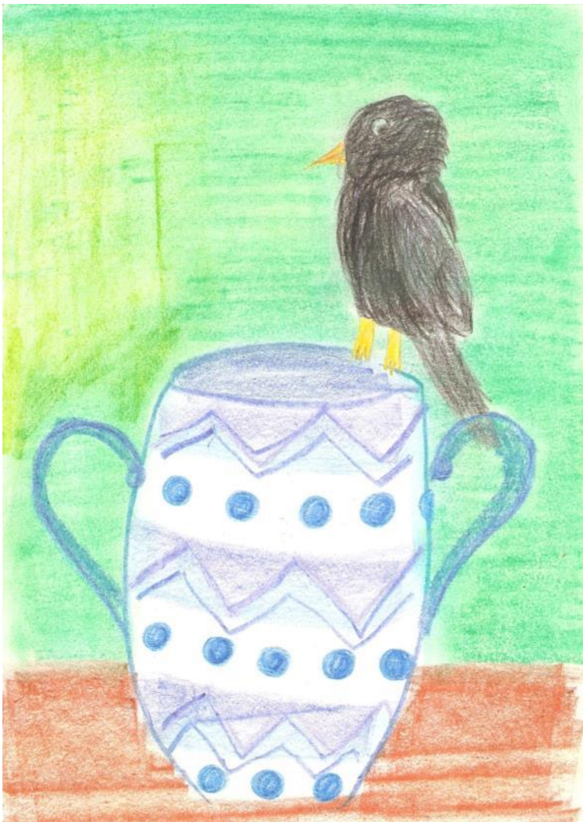
Obrázok 7, Smädnä vrana