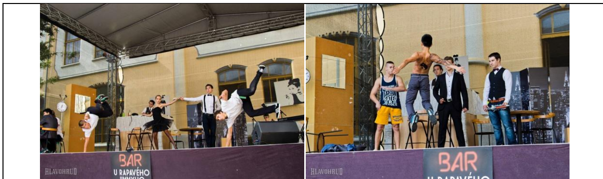
Obrázok 7 Otvárací ceremoniál OH Hlavohrud' 2013 (vľavo – úvodný tanec, vpravo – scénka z predstavenia)

Najdôležitejšia časť v tvorivom procese tohto otvorenia bola neustále potreba viesť dialóg o vhodnom a nevhodnom obsahu. Žiacke prvotné nápady pozostávali často agresívnych a povrchných motívov, ktoré bolo potrebné pretaviť do humornej a sofistikovanejšej podoby, čo sa nám napokon pomerne dobre podarilo. Vďaka grotesknej podobe tejto témy „na hrane“ (mafia) ju publikum (aj pedagogický zbor) prijali tolerantne, obzvlášť ak vzali do úvahy fakt, že samotné organizátorské triedy boli rovnako do istej miery „triedami na hrane“.