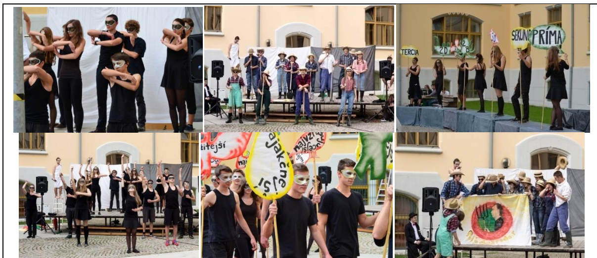
Obrázok 9 Otvárací ceremoniál OH Okamih 2014 (vľavo – tanec „času“, uprostred – poľnohospodári a nosiči transparentov, vpravo – rozostavenie tanečníkov na piedestáloch, poľnohospodári v scénke odhalenia maskota)

rozprúdili dišputu o tom, že človek si nedokáže vážiť čas, ktorý dostal do rúk, a v rozhodujúcich okamihoch vždy robí rozhodnutia, ktoré vedú ku konfliktom alebo k horšiemu. Boh Pesimista je skeptický, boh Optimista dáva človeku nádej, preto znovu spustí čas, aby videli, čo sa stane s poľnohospodármi následne – tí sa následne udobia a otvorenie olympiády zrealizujú. Do príbehu vstupuje aj fyzická osoba „pána Okamiha“, neznámeho muža v čiernom, ktorý zastavuje alebo spúšťa čas, a následne sa objaví aj na vlajke s maskotom. Špecifikom tohto ceremoniálu bolo scénické riešenie, keď okrem hlavného pódia sme vytvorili dve krídla v tvare štvrtkruhov z piedestálov, akýsi „Olymp“ (palety pokryté plátnom) so „sochami“ (študenti na jednotlivých piedestáloch stvárňovali sochy s transparentmi tried, obrysami bývalých maskotov a prívlastkami, ktoré je možné pripísať slovu „okamih“ – najzaujímavejší, najkrajší, atď.). Na tieto piedestály vystúpili aj žiaci pri odriekaní žiackej prísahy.