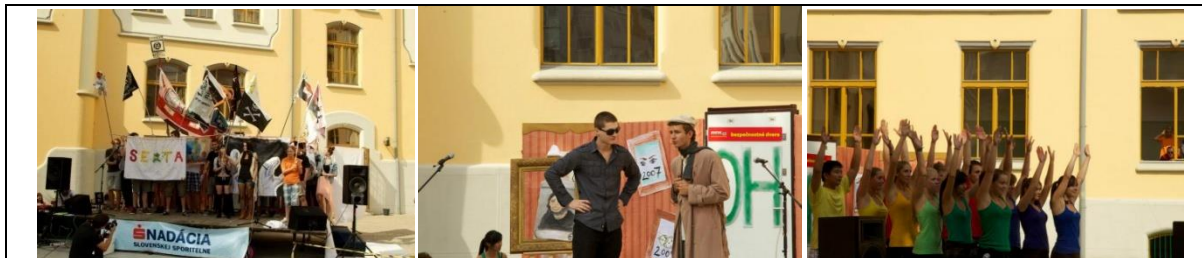
Obrázok 5 Otvárací ceremoniál OH Lamohlav 2012 (vľavo – zástupcovia tried s vlajkami, uprostred – postavy detektívov, vpravo – tanec Rubikovej kocky)

Galaprogram, ktorý mal byť zároveň oslavou 25. ročníka olympiády, sme sa rozhodli postaviť tiež predovšetkým na hravosti a výraznom výbuchu študentskej energie ako esenciálnom prvku, vďaka ktorému olympiáda doteraz existuje. Galaprogram otváral tanec postavy Rubikovej kocky, detektívov a organizátorov s deťmi (ročník príma). Pomedzi vyhlasovania výsledkov jednotlivých disciplín sme vytvorili krátke komické neverbálne scény, ktoré mali navodiť daný druh disciplín (pri vedeckých – chemický pokus vedcov, pri športových – preteky troch pretekárov, a pod.). V záverečnej sekvencii vystúpení sme pripomenuli 25. výročie olympiády prostredníctvom nástupu dievčat-organizátorsk v slávnostných šatách do externého hlasu, ktorý sumarizoval doterajší život personifikovanej „olympiády“ a program uzavreli masový tancom vo forme „flash-mob“, kedy postupne žiaci rôznych tried vybiehali z hľadiska a pridávali sa na javisku do spoločného vystúpenia.