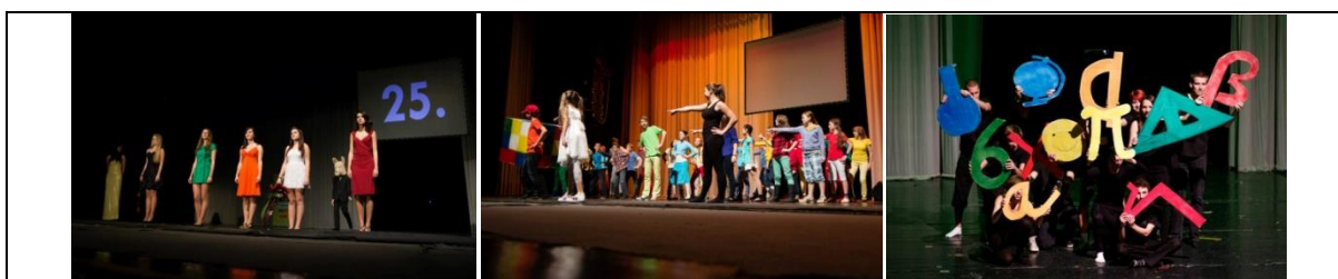
Obrázok 6 Galaprogram OH Lamohlav 2012 (vľavo – nástup dievčat pri slávnostnom pripomenutí 25. výročia, uprostred – úvodný tanec s Rubikovou kockou, vpravo – krátka scéna ku vyhlasovaniu vedeckých disciplín pre vyšší stupeň)

Galaprogram, ktorý mal byť zároveň oslavou 25. ročníka olympiády, sme sa rozhodli postaviť tiež predovšetkým na hravosti a výraznom výbuchu študentskej energie ako esenciálnom prvku, vďaka ktorému olympiáda doteraz existuje. Galaprogram otváral tanec postavy Rubikovej kocky, detektívov a organizátorov s deťmi (ročník príma). Pomedzi vyhlasovania výsledkov jednotlivých disciplín sme vytvorili krátke komické neverbálne scény, ktoré mali navodiť daný druh disciplín (pri vedeckých – chemický pokus vedcov, pri športových – preteky troch pretekárov, a pod.). V záverečnej sekvencii vystúpení sme pripomenuli 25. výročie olympiády prostredníctvom nástupu dievčat-organizátorsk v slávnostných šatách do externého hlasu, ktorý sumarizoval doterajší život personifikovanej „olympiády“ a program uzavreli masový tancom vo forme „flash-mob“, kedy postupne žiaci rôznych tried vybiehali z hľadiska a pridávali sa na javisku do spoločného vystúpenia.