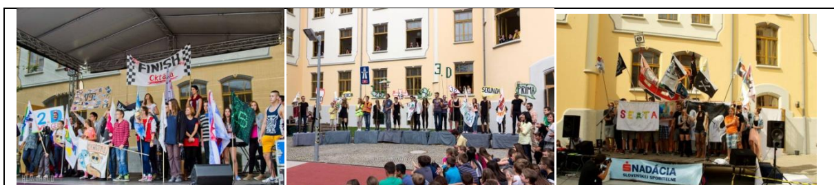
Obrázok 3 Prísaha zástupcov tried s triednymi zástavami

Súčasťou ceremoniálu je umelecké vystúpenie organizujúcich žiakov, ktoré pozostáva z tanečno-divadelného vstupu motivicky spojeného s odhalením maskota olympiády. Otvárací ceremoniál sa koná na školskom dvore v priebehu septembra (väčšinou v piatok), trvaním nepresahuje jednu vyučovaciu hodinu a predstavuje oficiálny začiatok školských olympijských hier.