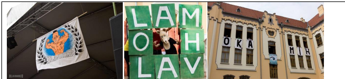
Obrázok 1 Odhalenie maskota olympiády