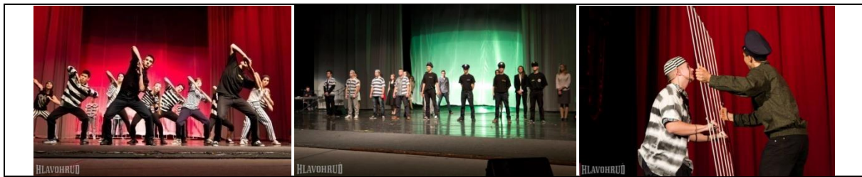
Obrázok 8 Galaprogram OH Hlavohrud' 2013 (vľavo – spoločný tanec „väzňov“, uprostred – „súdny proces“, vpravo – krátka scénka pred vyhlasovaním výsledkov)

Táto mimoprogramová okolnosť ma priviedla na nápad postaviť príbeh na nasledujúcej zápletke: štyria gangstri (žiaci triedy B) sa za svoje priestupky zadržaní do väzby, zatknú ich štyria policajti (žiaci triedy A), pričom celý galaprogram sa bude niesť v duchu „rozhovorov cez mrežu“ – väzeň vs. strážny policajt. V závere príbehu sa koná súdny proces, v ktorom sa ukáže, že gangstri žiadny zločin nespáchali, preto gangstri odchádzajú na slobodu, ale obohatení o sebareflexiu a nové priateľstvo (s policajtami). Opäť veľmi triviálny príbeh, ktorý nám ale umožnil rozohrať filozofické otázky o dobre a zle, o snoch a realite človeka, o slobode a neslobode v konaní. A v neposlednom rade sa napätie medzi oboma triedami v skúšaní tohto vystúpenia opätovne uvoľnilo.