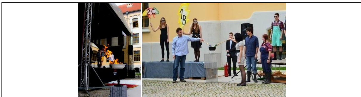
Obrázok 2 Zapálenie olympijského ohňa