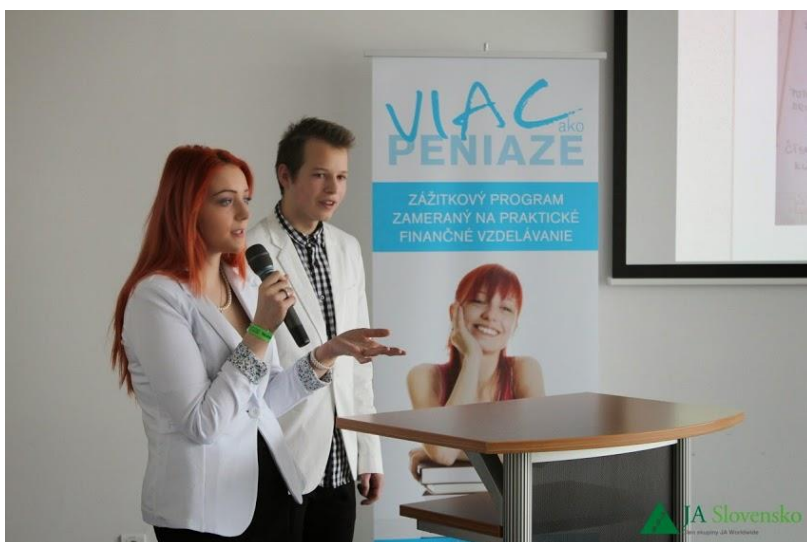
Obrázok 7 Finále súťaže Bankomat nápadov – náš tím ČistýRap