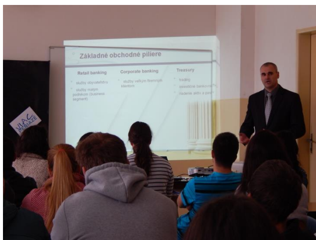
Obrázok 5 Stretnutie s konzultantom z praxe na vyučovacej hodine

Stretnutie sa mi podarilo zorganizovať len jedenkrát, a to začiatkom mája 2014. Naším konzultantom sa stal riaditeľ ružomerskej pobočky jednej banky. Témou konzultácie bola 7. kapitola online učebnice „ Moderné bankové nástroje “. V prvej časti stretnutia pán riaditeľ stručne oboznámil žiakov o histórii a fungovaní bankového systému v Slovenskej republike. V druhej časti sa zamerlal na nástroje elektronického bankovníctva a inovácie, ktoré v tejto oblasti robí jeho banka, s dôrazom na využívanie mobilných aplikácií v bankovníctve (napr. služba Viamo). Žiaci položili pánovi riaditeľovi veľa otázok, a to nielen priamo k téme, na ktoré im on ochotne odpovedal. Spokojnosť s priebehom stretnutia bola na všetkých troch stranách. V súkromnom rozhovore mi pán riaditeľ povedal, že ho veľmi teší, že mohol nielen odovzdať svoje znalosti a skúsenosti mladej generácii, ale aj on sám získal nové podnety a nápady od mladých ľudí. Žiaci boli nadšení z toho, že im odpovedal aj na otázky „na telo“ (napr. Koľko zarába bankový úradník?). Okrem toho ich zaujalo jeho rozprávanie o výbere zamestnancov. LENIVCI A ŠPEKULANTI NEMAJÚ V JEHO PRACOVNOM TÍME ŠANCU! A nakoniec som bola spokojná aj ja, pretože stretnutie dopadlo nad moje očakávania.