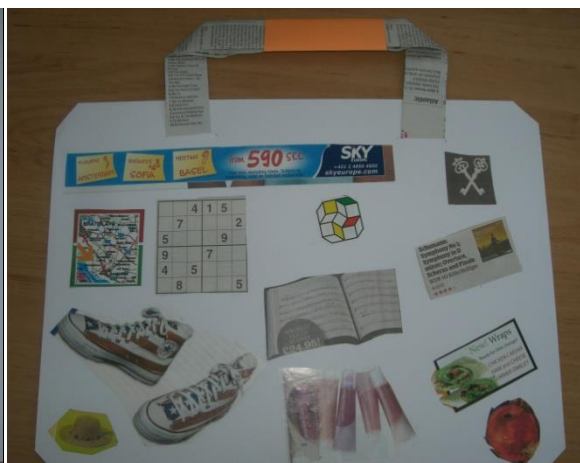
Obrázok 7: The Lost Bag – collage