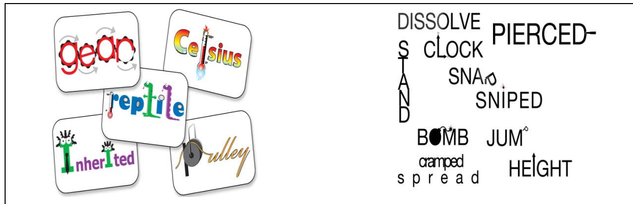
Obrázok 2: Word associations

Slovné asociácie – pomáhajú žiakom vizualizovať slová, aby si ich lepšie zapamätali.