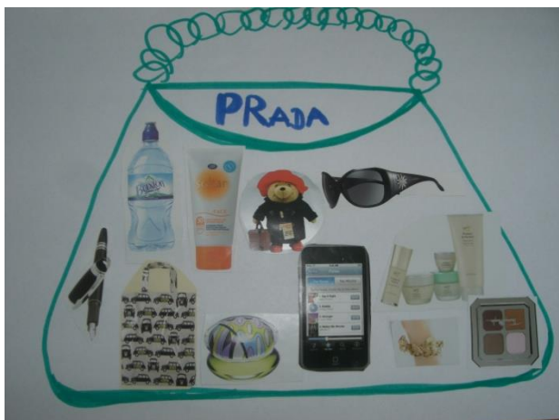
Obrázok 6: The Lost Bag – collage