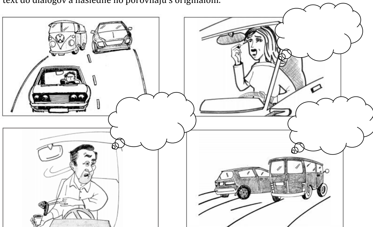
Obrázok 5: The Bad Driver

„Komiksové príbehy“ – učiteľ nájde komiksový príbeh vhodný pre danú vekovú skupinu. Rozstrihá jednotlivé časti a odstráni text. Žiaci v skupinách poskladajú príbeh a dopíšu text do dialógov a následne ho porovnajú s originálom.