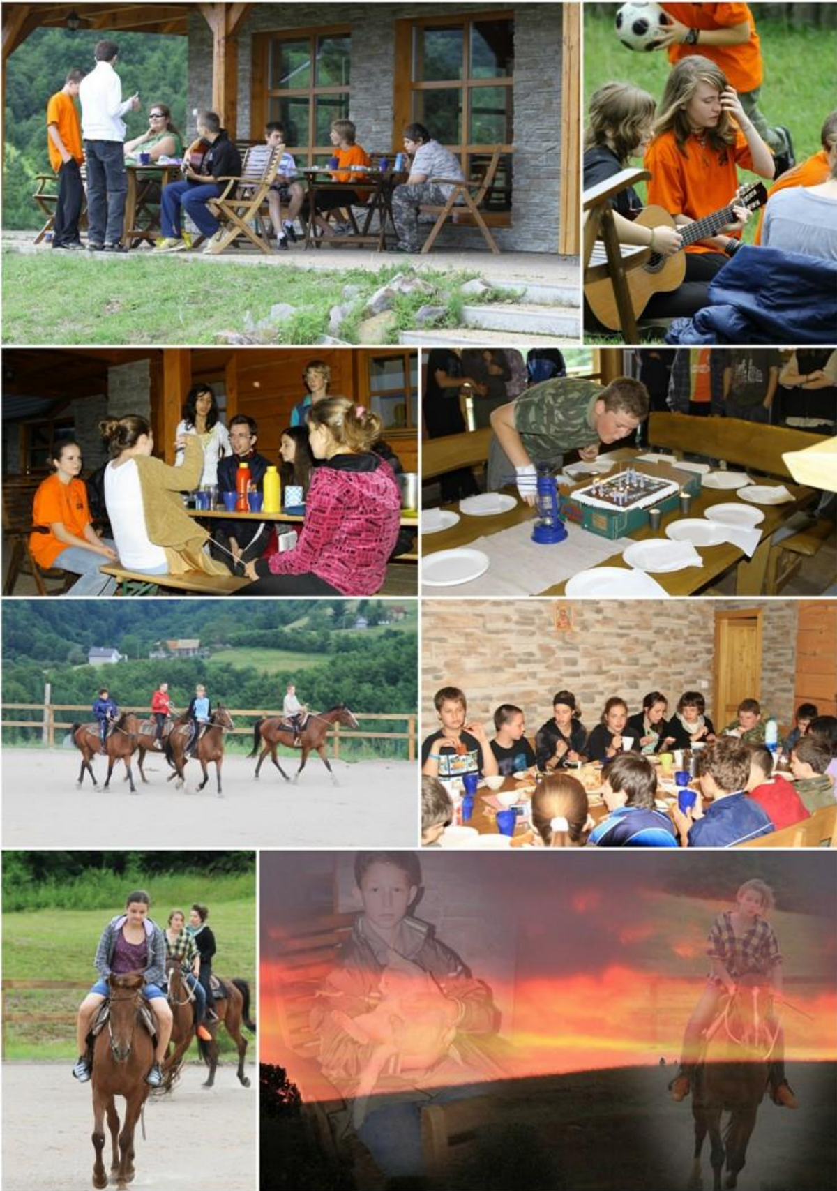
Hipoterapeutické jarné sústreďenie na farme pre 7.ročník