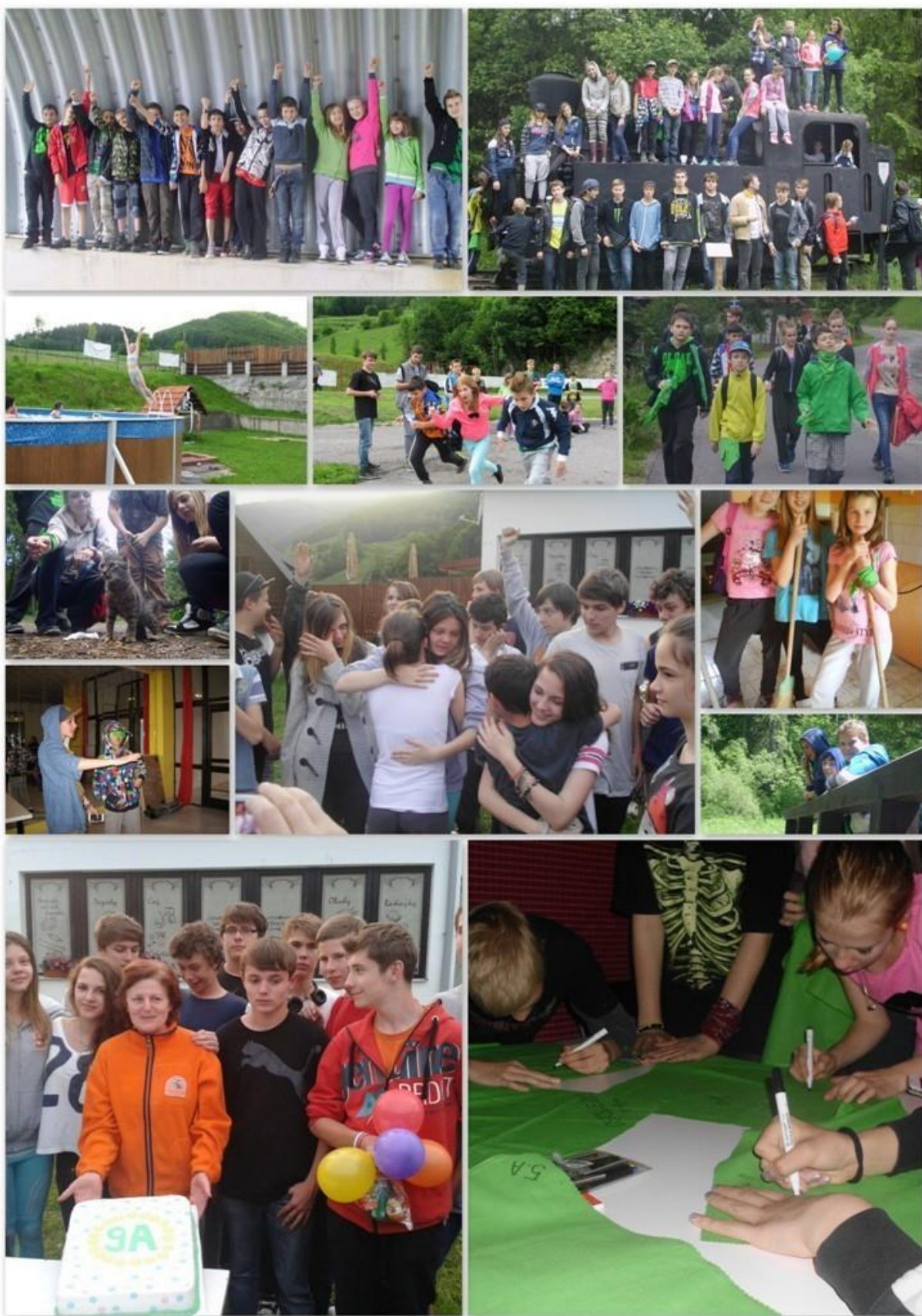
Medzigeneračné jarné sústreďenie 5., 7. a 9. ročníka