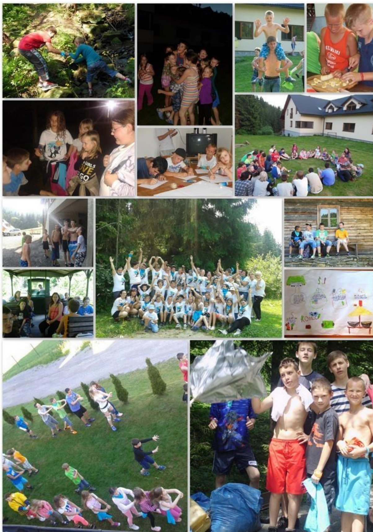
Medzigeneračné jarné sústredenie 4. a 8.ročníka