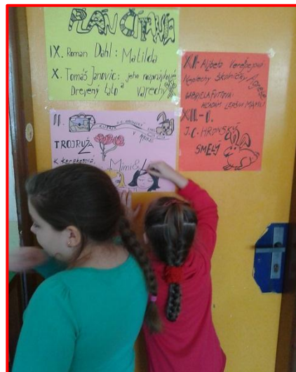
Obrázok 1 Plán čítania