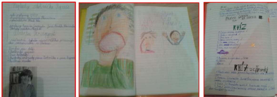
Obrázok 6 Čitateľský denník

So zavádzaním čitateľského denníka začínam už v druhom polroku 1. ročníka. Tento spôsob práce majú žiaci veľmi, sú tvoriví, nápadiť. Je zaujímavé sledovať akými zmenami denníky žiakov prešli: písmo, ilustrácie, úprava, úhladnosť, farebnosť, písanie obsahu ... (Obrázok 6).