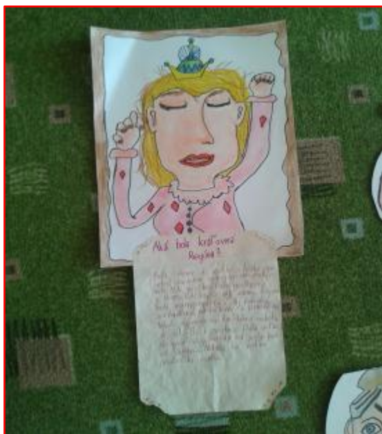
Aká bola Kráľovná Regina?, Želka III.D