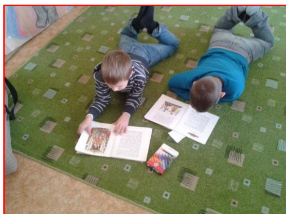
Obrázok 4 Ranná komunita