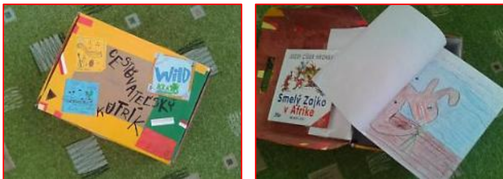
Obrázok 7 Cestovateľský kufrík

Metodická poznámka: Tento spôsob čítania vedie žiakov k vysokému stupňu aktivity, tvorivosti a nápaditosti. Aj tí, ktorí neradi čítajú, chcú čítať. Jeho vysoký stupeň motivácie žiaci dokazujú tým, že kufrík prinesú už na druhý deň. Tí ďalší to dokazujú otázkami „ Kto bude ďalší cestovať? Pani učiteľka, už budete rozpočítavať? Matko už doniesol, budem mať dnes kufrík ja?“ V závere čitateľskej dielne žiaci sedia na koberci v kruhu. V prostriedku sa nachádza kufrík, v ktorom je cestovateľský denník. Smelý Zajko docestoval a každý žiak prečíta svoj napísaný obsah. Konečne sa všetci dozvieme ako to všetko začalo a skončilo. V závere zazvoní zvonček a cestovateľskému putovania je koniec. Na tejto aktivite vidieť ako chcú deti čítať. Otázky typu: „ A teraz si to už môžem celé prečítať? Požičiate mi pani učiteľka knihu? A ktorú knihu budeme čítať?“ sú dôkazom vysokej aktivity žiakov.