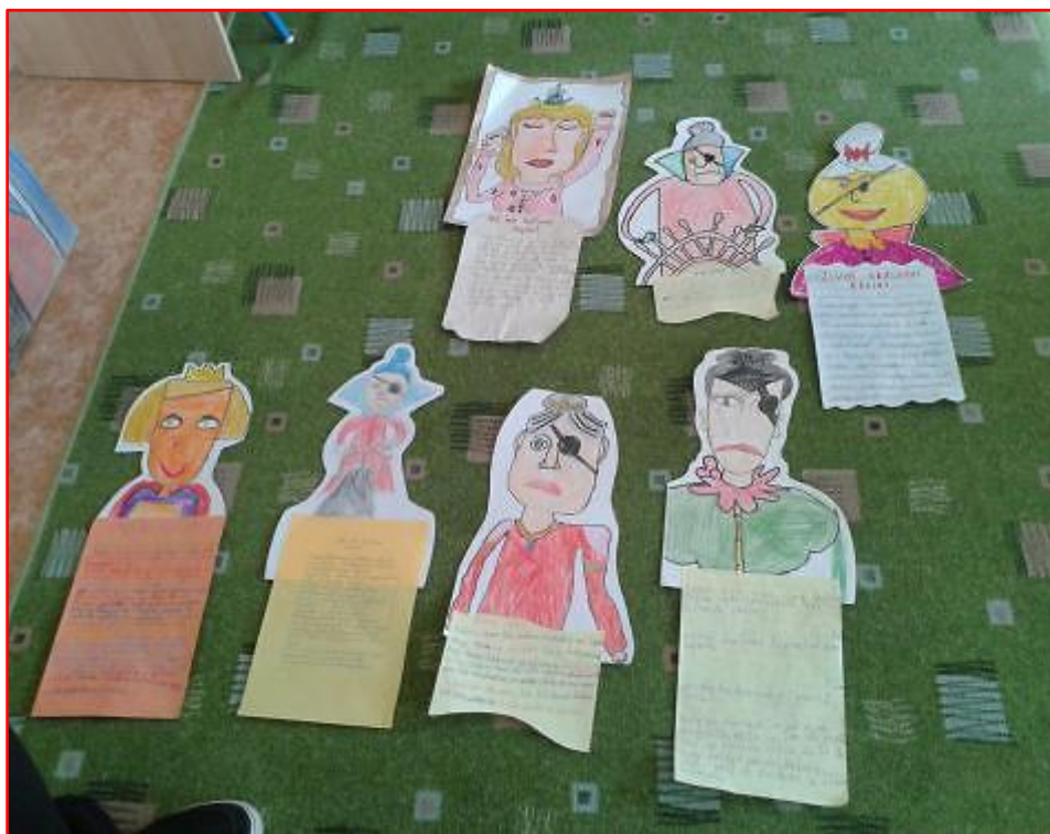
Žiacke práce, III. D