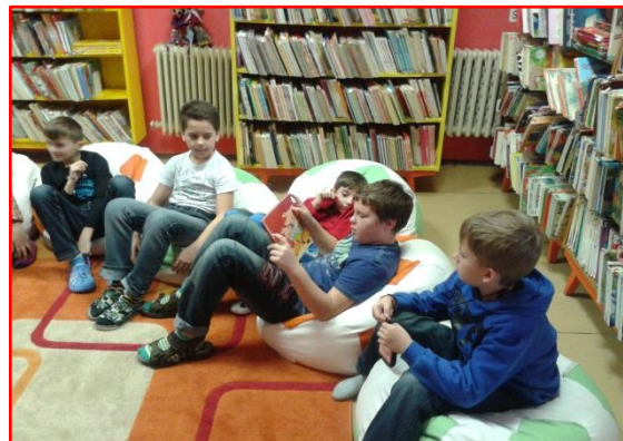
Obrázok 2 Čítame s Osmijankom