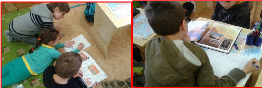
Obrázok 3 Tvorba projektov