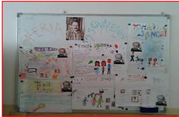
Obrázok 5 Galéria spisovateľov

Projekt musel spĺňať určité kritéria po formálnej a obsahovej stránke. V závere bloku skupiny svoje projekty prezentovali a boli vystavené v našej Galérii spisovateľov (Obrázok 5).