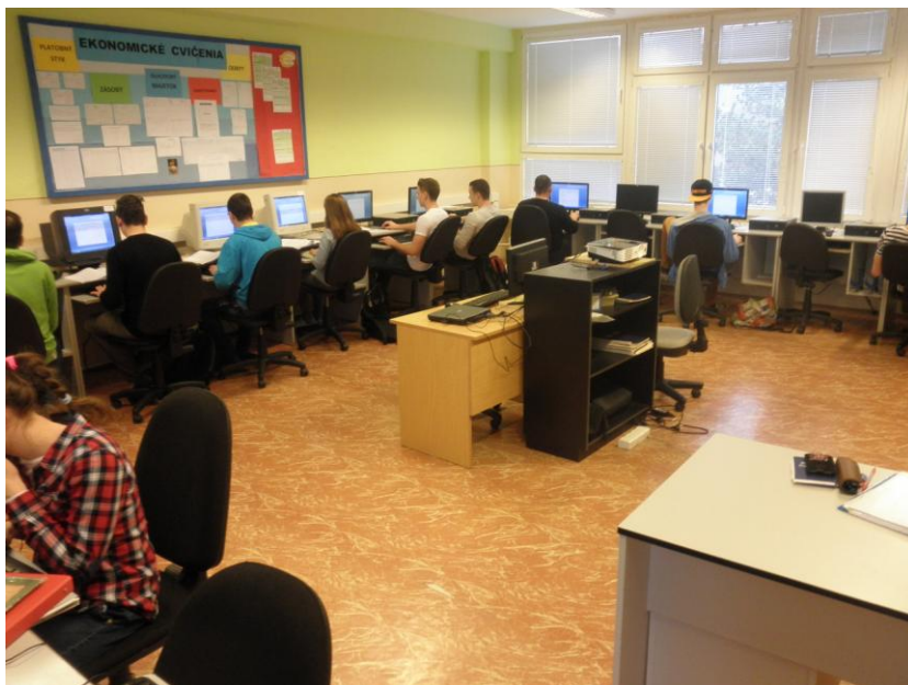
Obrázok 6 Ukážka práce s textom s II. HA/B triedou v IT - učebni