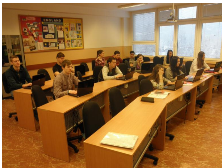
Obrázok 3 Ukážka práce s textom s II. A triedou v jazykovom laboratóriu - učebni