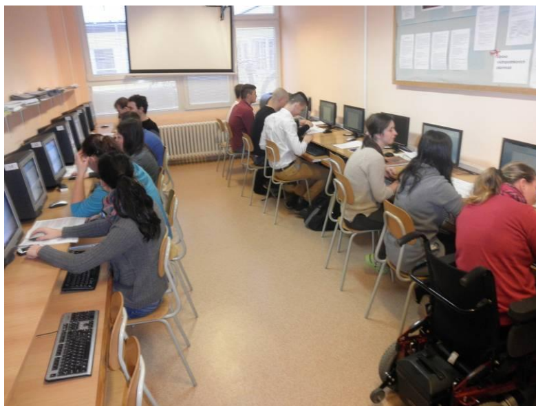
Obrázok 2 Ukážka práce s textom s II. A/B triedou v O1 učebni