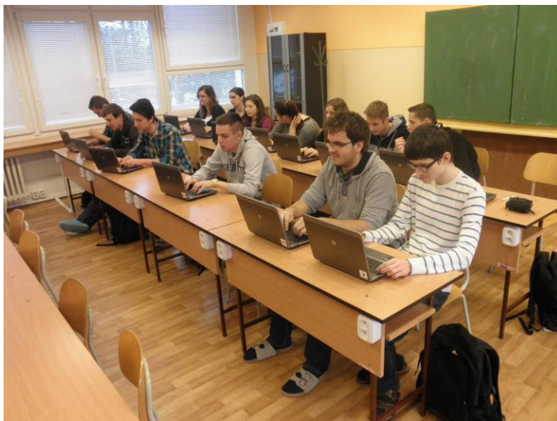
Obrázok 5 Ukážka práce s textom s II. HA/A triedou v UKV - učebni