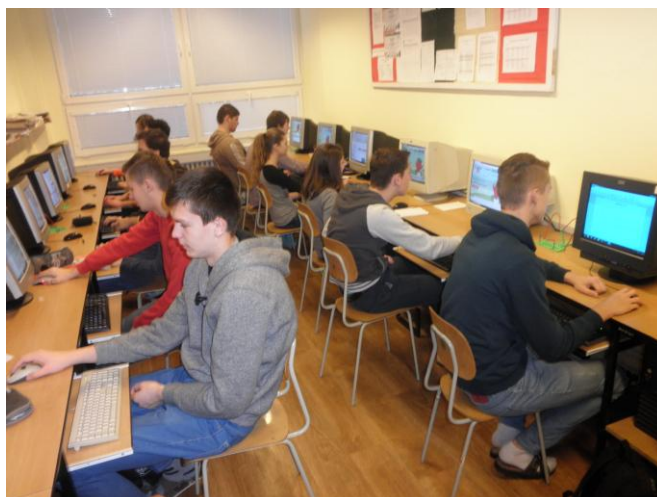
Obrázok 1 Ukážka práce s textom s II. A/A triedou v IV učebni