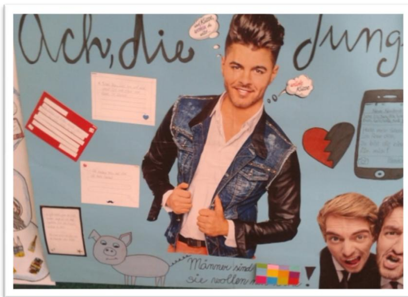
Obrázok 3 Ach, die Jungen!