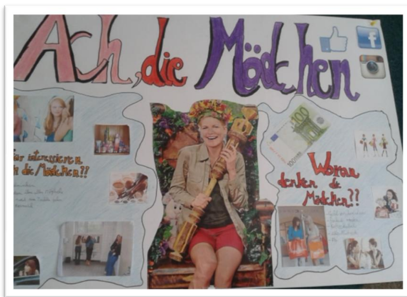
Obrázok 2 Ach, die Mädchen!

K obsahu a forme prezentácie - okrem toho, že skupiny museli vytvoriť plagát k téme, neboli ničím obmedzované - okrem požiadavky, aby opačné pohlavie neurážali. Takto otvorený priestor ponúkal možnosť žiakom stvárniť svoju predstavu naozaj osobito.