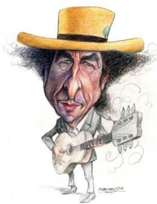
(Bob Dylan 1 )