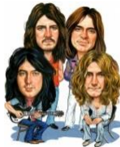
(Led Zeppelin 3 )